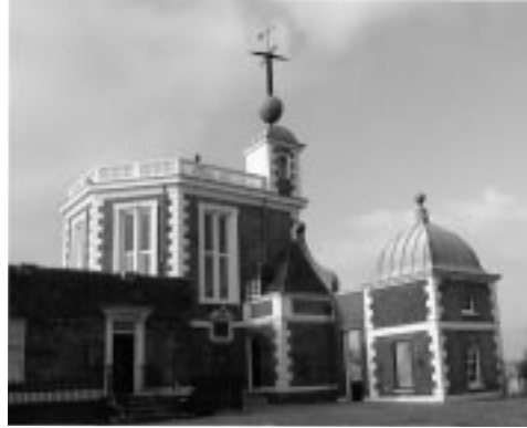
El Observatorio Real en Greenwich, Inglaterra.