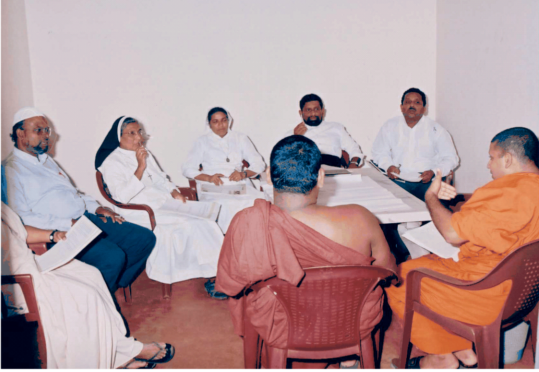
சமயத்தலைவர்களின் கலந்துரையாடலில் பங்குபற்றியோர்