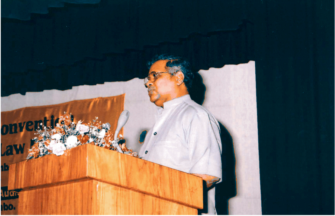
நவம்பர் 2004இல் தேர்தற் சட்டத் தீர்திருத்தம்: செயற்பாட்டிற்கான உபாயங்கள் தொடர்பான தேசிய மகாநாட்டில் எரிசக்தி, வலு அமைச்சர் கௌரவ சசில் பிரேமஜயந்த உரையாற்றுகிறார்