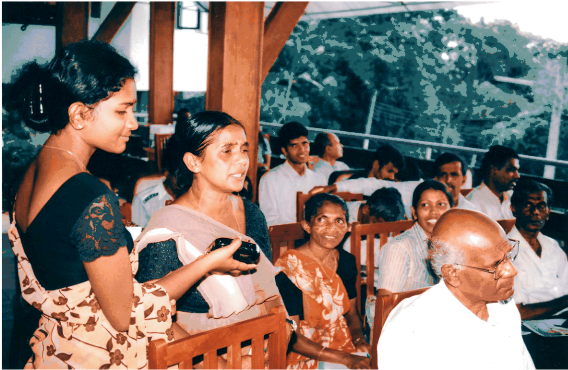
மாவட்ட மட்ட கலந்துரையாடலில் பங்குபற்றியோர்