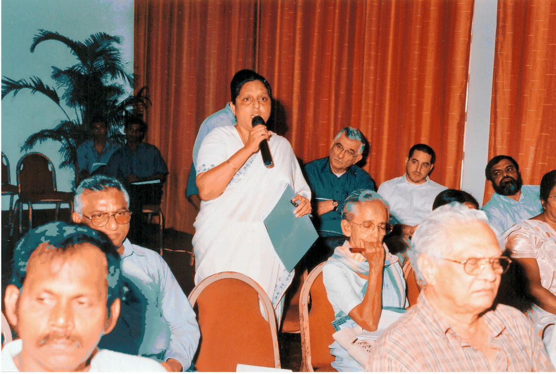
தேர்தல் செயன்முறை, சீர்திருத்தம் பற்றிய இறுதிக் கலந்துரையாடலில் பங்குபற்றியோர்; மே, 2004