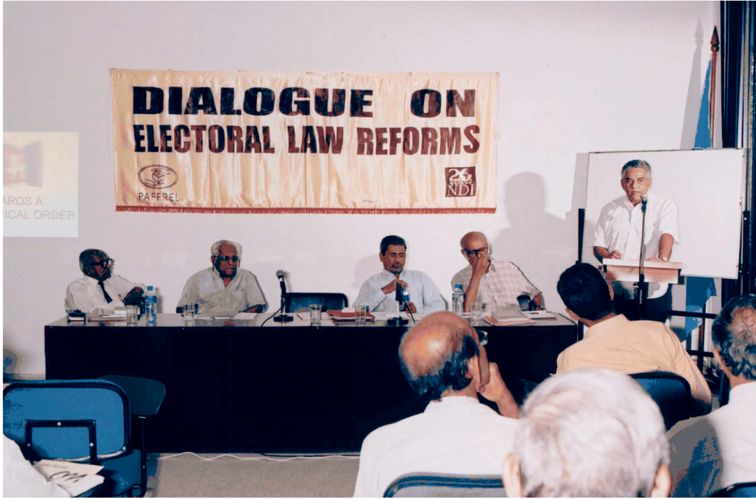
துறை சார் நிபுணர்களின் கலந்துரையாடலில் பங்கு பற்றியோர்