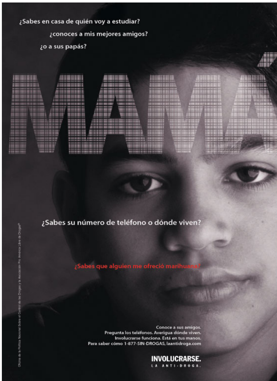
Poster de la Campaña Nacional Anti-Droga dirigida a hispanos en Estados Unidos.

Encuesta Nacional sobre el Consumo de Drogas y la Salud del año pasado, muestran que se ha producido una significativa reducción del 20% en las personas mayores de 12 años que han consumido cocaína por primera vez. El consumo de crack ha tenido una gradual declinación entre la juventud desde que alcanzó sus niveles más altos a finales de la década de 1990. Lamentablemente, en los últimos años el abuso de fármacos legales ha aumentado entre los adolescentes.