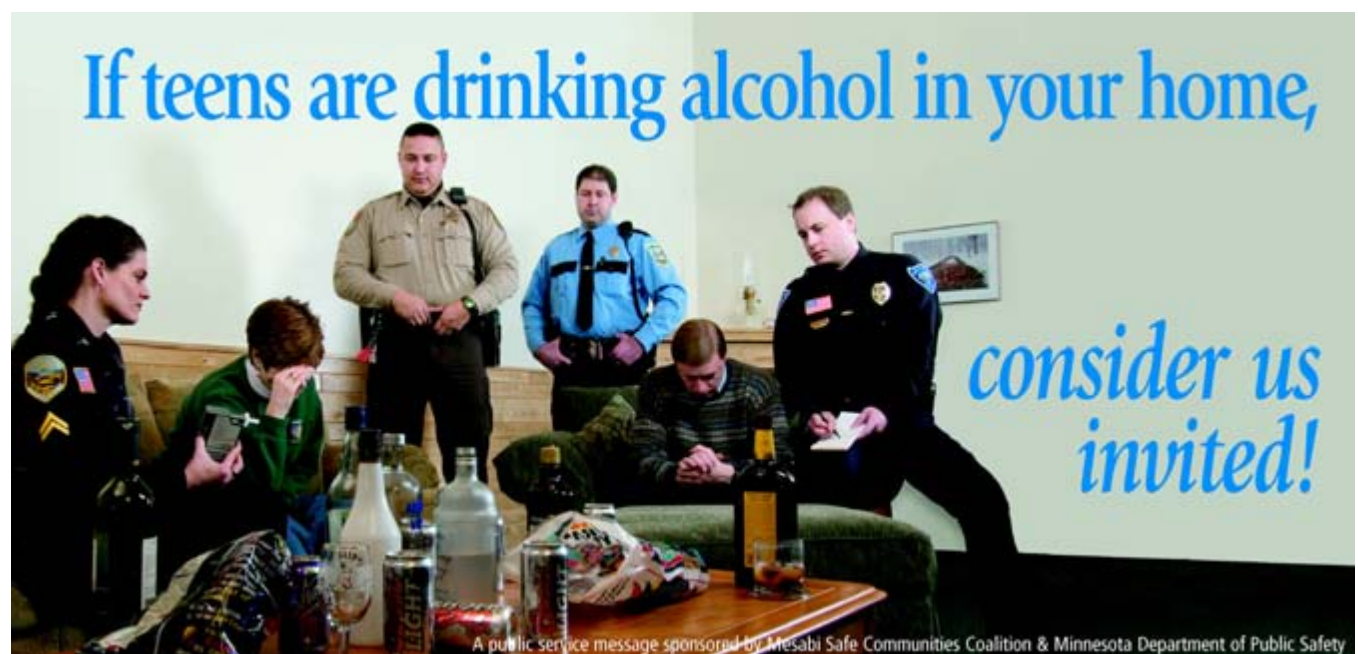
Publicidad del Departamento de Seguridad Pública de Minnesota. El mensaje dice: “Si hay adolescentes bebiendo alcohol en su casa.... considerenos invitados!”.

“Ha habido un cambio en cuanto al abuso de drogas entre los adolescentes estadounidenses”, dijo John P. Walters, director de Política Nacional de Control de Drogas. “Están recibiendo el mensaje de que las drogas peligrosas dañan sus vidas y limitan sus futuros. Sabemos que si las personas no comienzan a usar drogas durante sus años adolescentes, es muy poco probable que desarrollen problemas con las drogas más adelante en la vida. Es por esto que esta aguda disminución en el consumo de drogas entre adolescentes es una noticia tan importante: Significa que habrá menos adicción, menos sufrimiento, menos crimen, costos menores en atención de salud y mayores logros para la próxima generación de estadounidenses”.