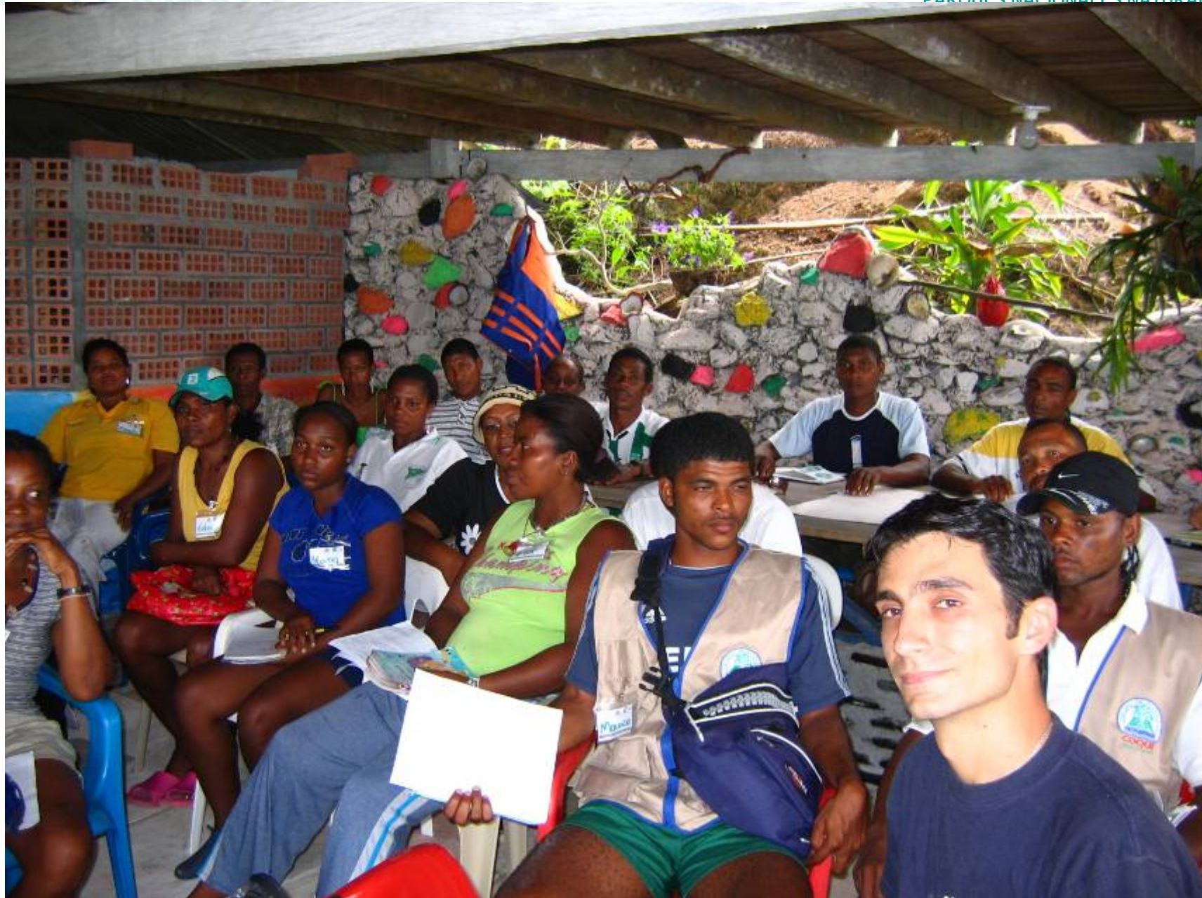
CASOS ESPECÍFICOS DE ORDENAMIENTO DE ACTIVIDADES ECOTURÍSTICAS EN COMUNIDAD.