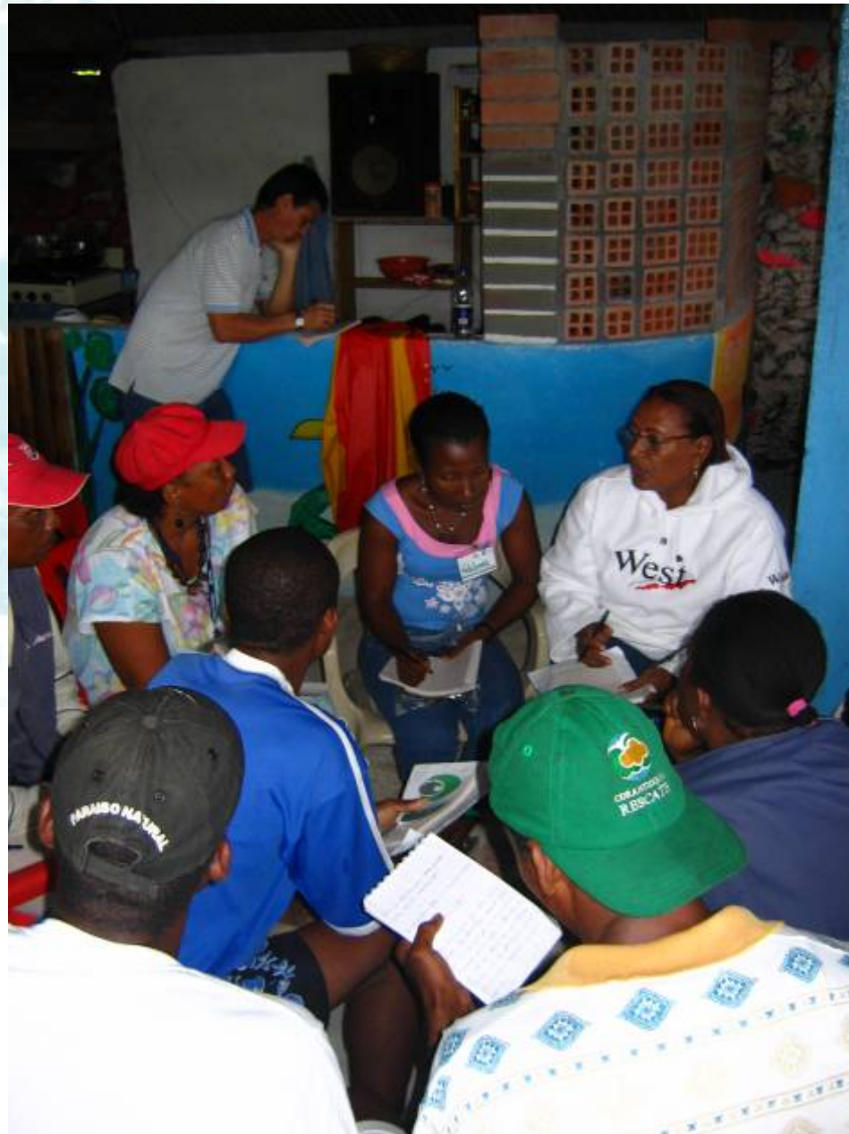
CASOS ESPECÍFICOS DE ORDENAMIENTO DE ACTIVIDADES ECOTURÍSTICAS EN COMUNIDAD.