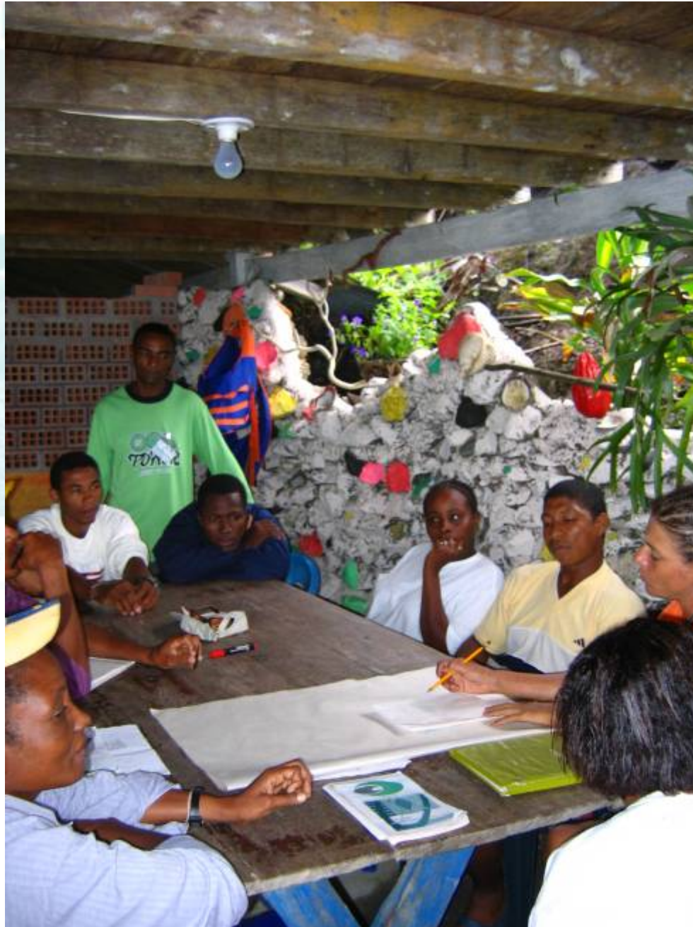
CASOS ESPECÍFICOS DE ORDENAMIENTO DE ACTIVIDADES ECOTURÍSTICAS EN COMUNIDAD.