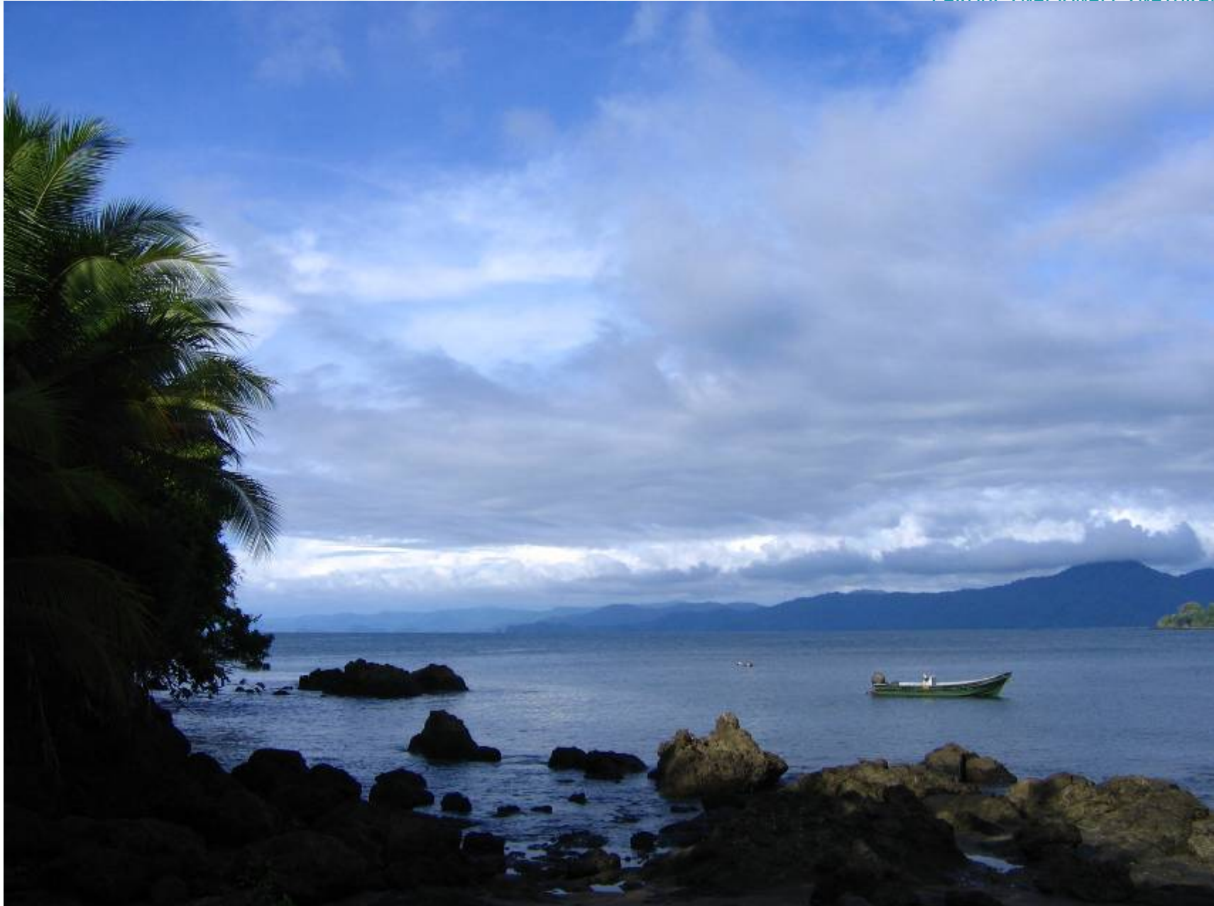
CASOS ESPECÍFICOS DE ORDENAMIENTO DE ACTIVIDADES ECOTURÍSTICAS EN COMUNIDAD.