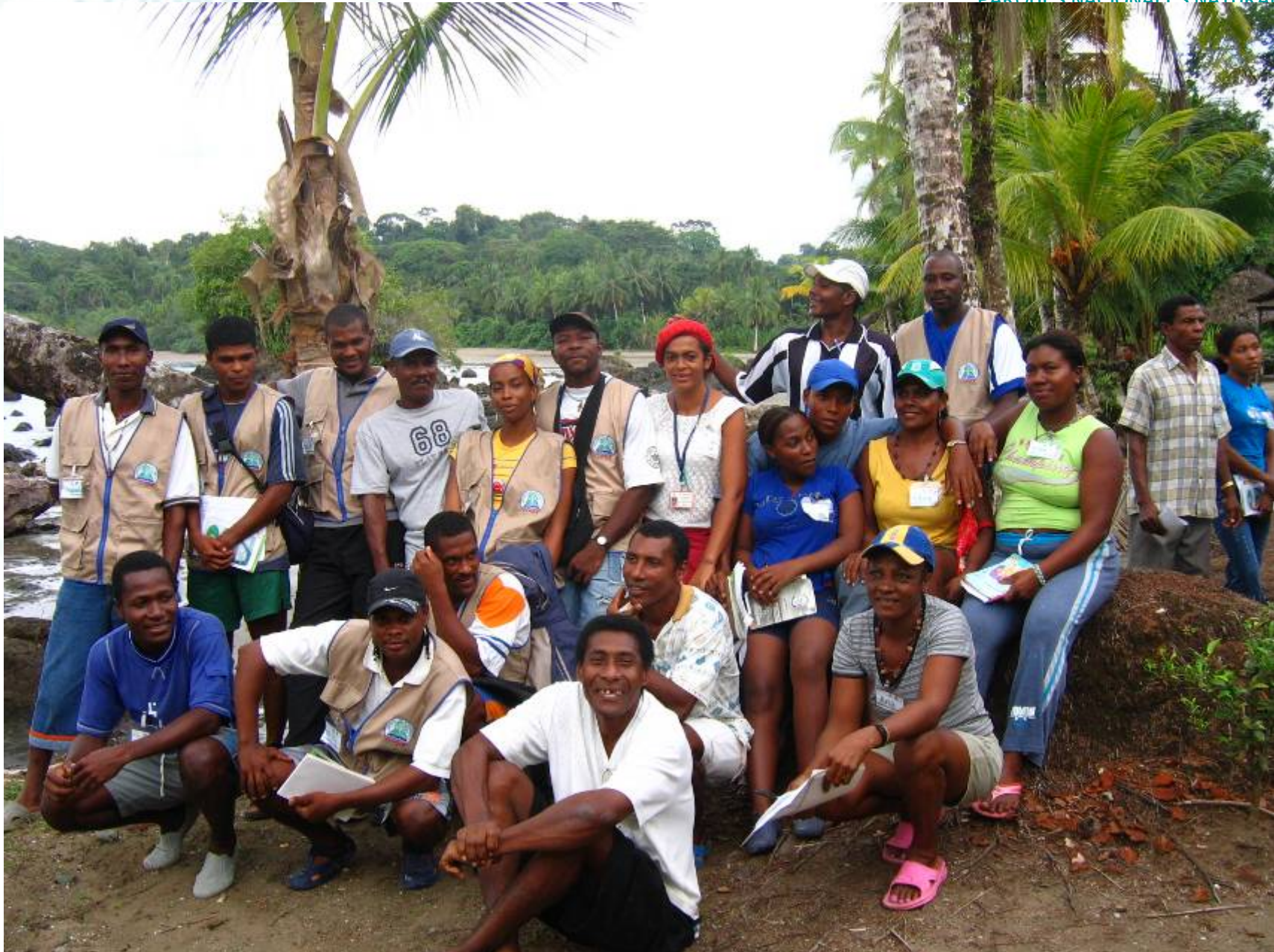
CASOS ESPECÍFICOS DE ORDENAMIENTO DE ACTIVIDADES ECOTURÍSTICAS EN COMUNIDAD.