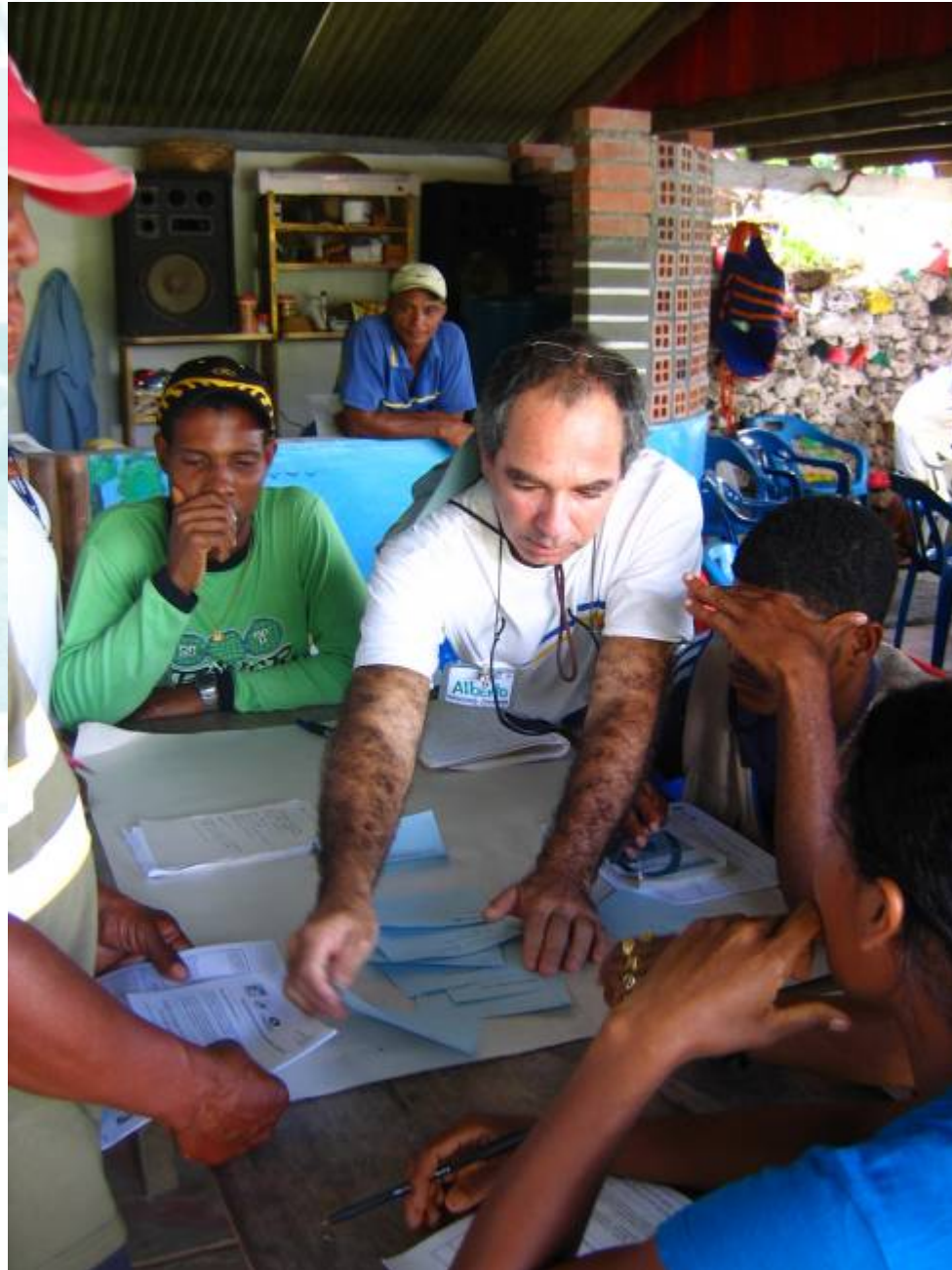
CASOS ESPECÍFICOS DE ORDENAMIENTO DE ACTIVIDADES ECOTURÍSTICAS EN COMUNIDAD.