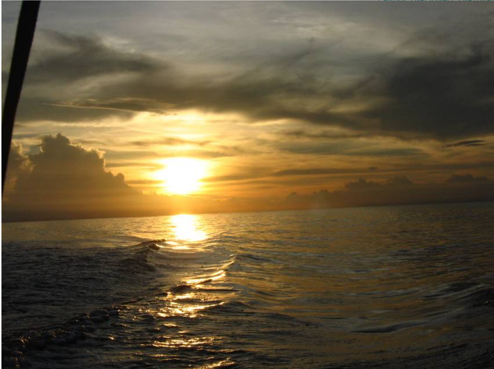
CASOS ESPECÍFICOS DE ORDENAMIENTO DE ACTIVIDADES ECOTURÍSTICAS EN COMUNIDAD.