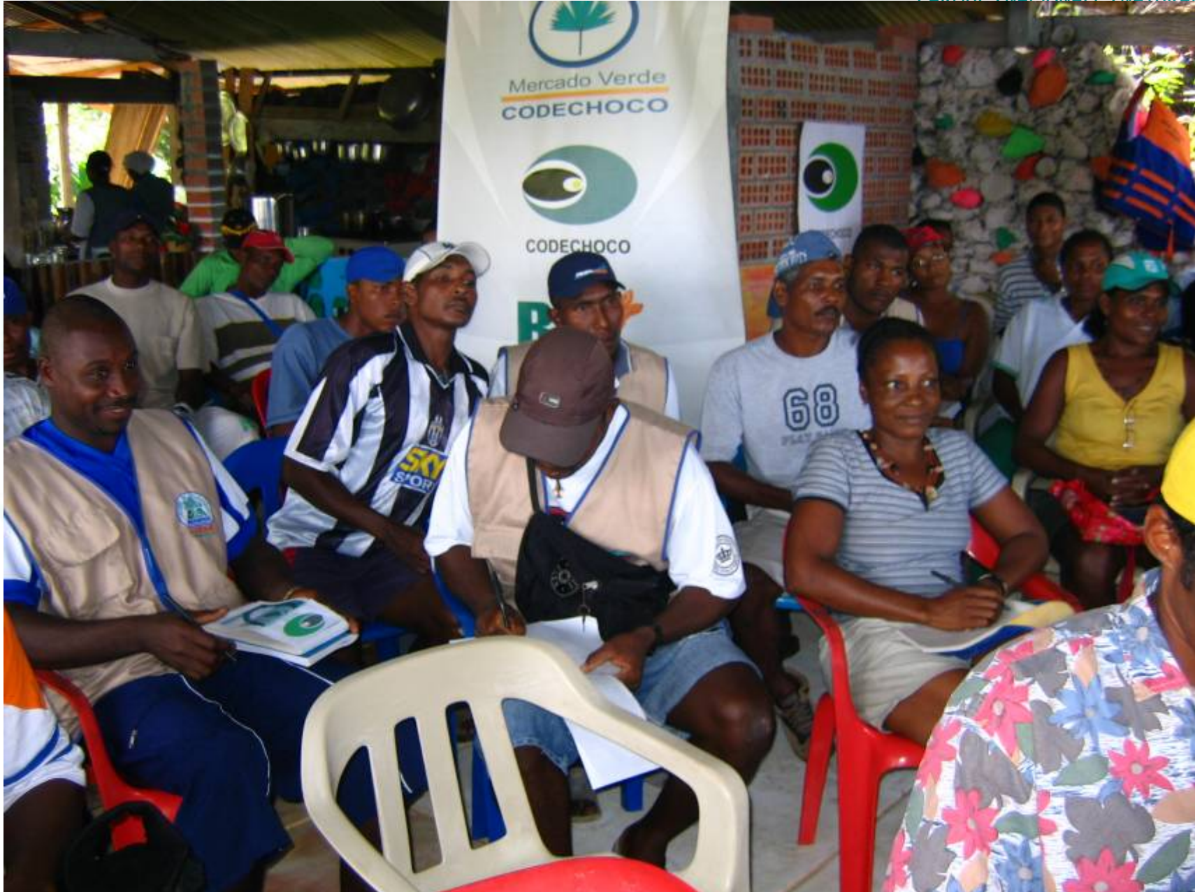
CASOS ESPECÍFICOS DE ORDENAMIENTO DE ACTIVIDADES ECOTURÍSTICAS EN COMUNIDAD.