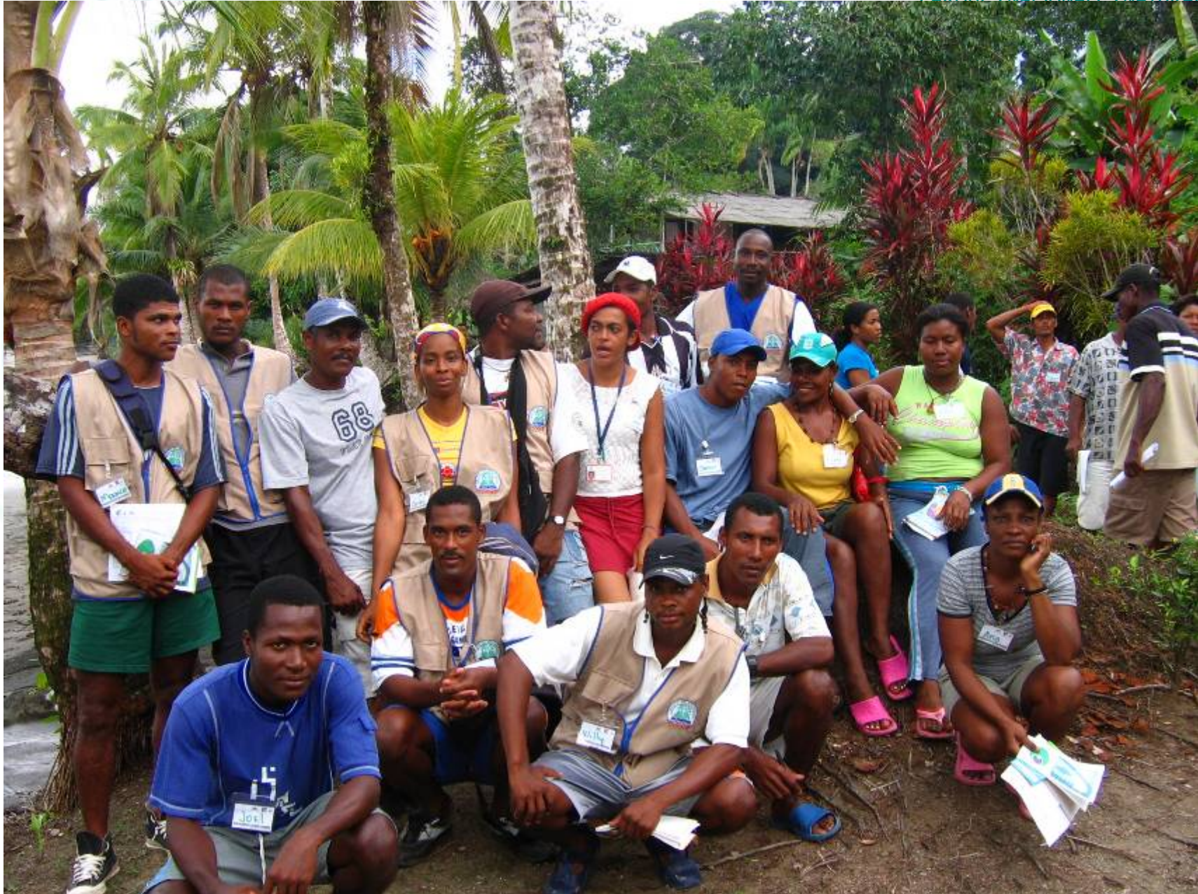
CASOS ESPECÍFICOS DE ORDENAMIENTO DE ACTIVIDADES ECOTURÍSTICAS EN COMUNIDAD.