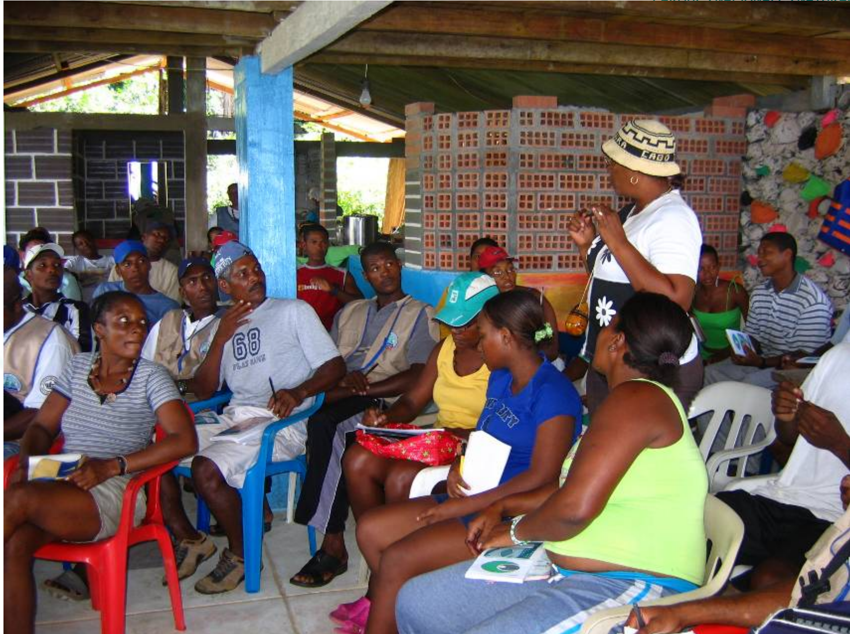
CASOS ESPECÍFICOS DE ORDENAMIENTO DE ACTIVIDADES ECOTURÍSTICAS EN COMUNIDAD.