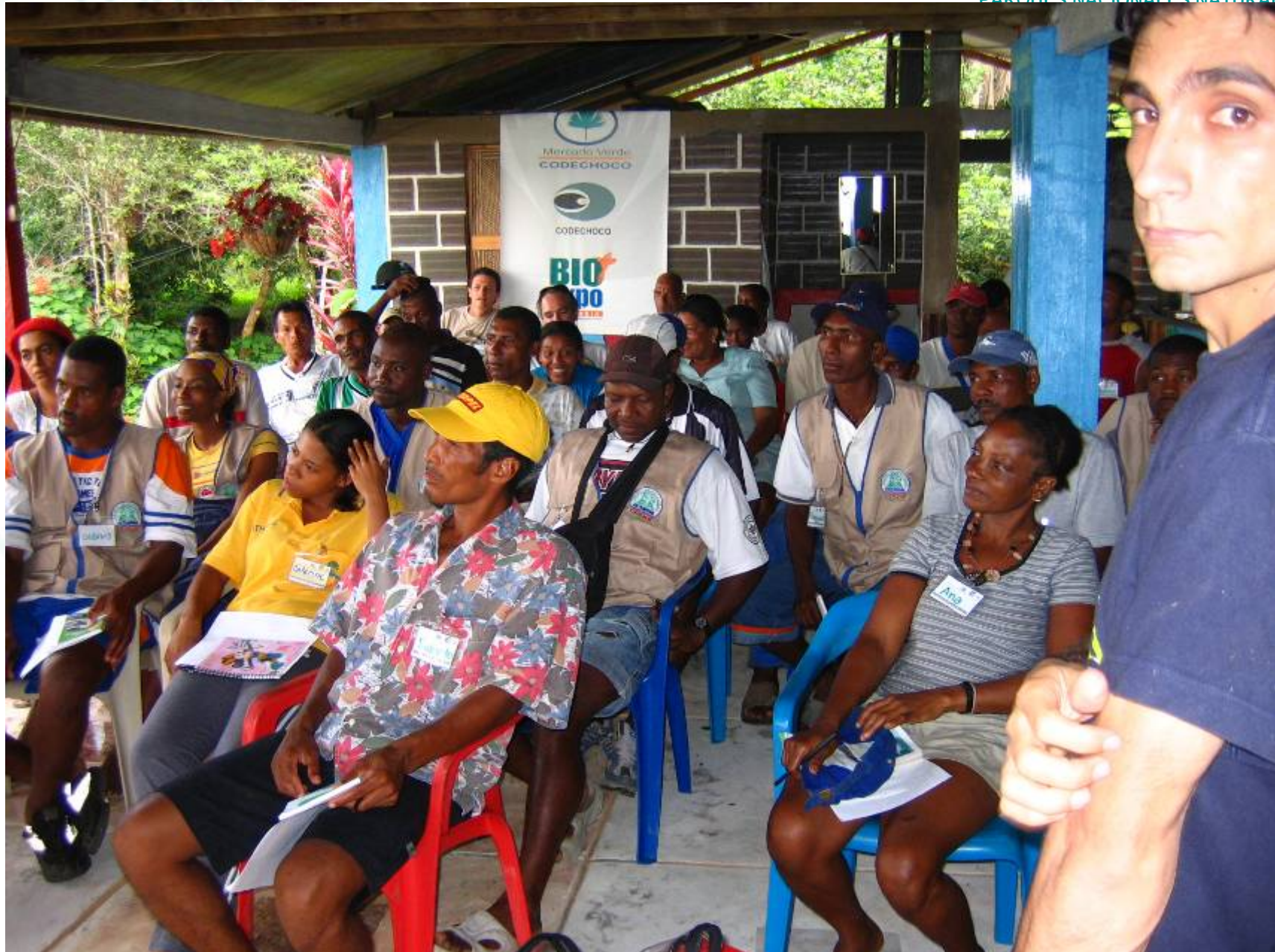
CASOS ESPECÍFICOS DE ORDENAMIENTO DE ACTIVIDADES ECOTURÍSTICAS EN COMUNIDAD.