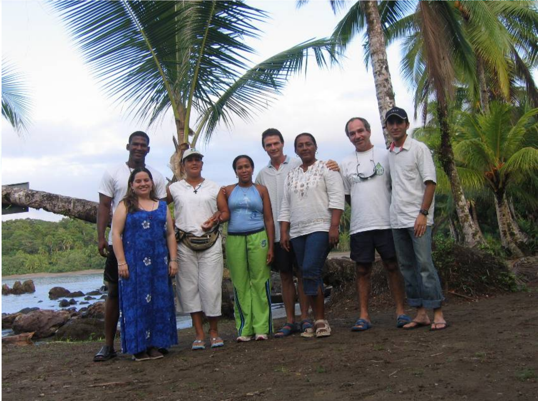
CASOS ESPECÍFICOS DE ORDENAMIENTO DE ACTIVIDADES ECOTURÍSTICAS EN COMUNIDAD.