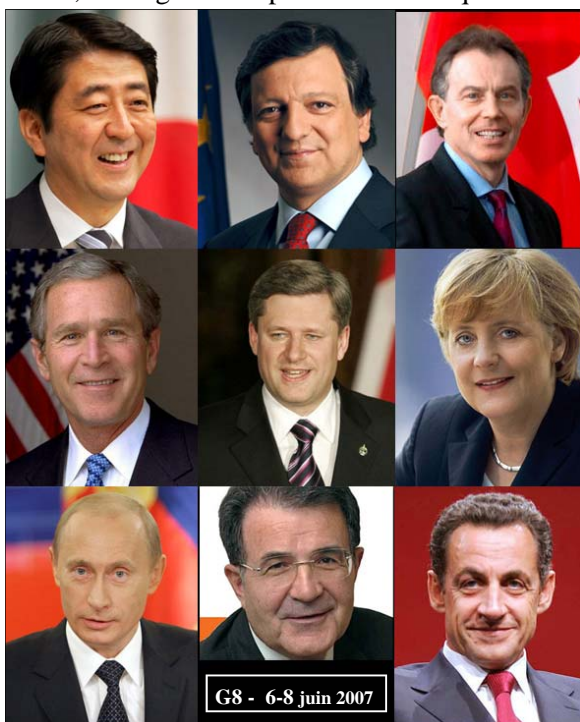
De gauche à droite et de haut en bas :

Au nombre des avancées notables, pour n'en citer que quelques unes, figurent les adaptations importantes adoptées à Halifax (1995) quant au fonctionnement du FMI et de la Banque Mondiale ; l'aide financière substantielle à la lutte contre les maladies infectieuses accordée lors du sommet d'Okinawa (2000) ; le Fonds mondial de lutte contre le VIH/SIDA créé à Gênes (2001), de même que le Nouveau partenariat pour le développement de l'Afrique (NEPAD). Cette année, les questions touchant à la mondialisation, au climat, à l'Afrique ainsi que le contrôle des flux financiers mondiaux devraient dominer l'agenda du sommet de Heiligendamm.