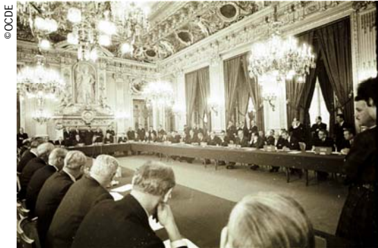
14 décembre 1960 au Quai d'Orsay : signature de la Convention qui allait donner naissance à l'Organisation de Coopération et de Développement Économique (OCDE)

Issue du Plan Marshall et de la Conférence des Seize (Conférence de coopération économique européenne), l'Organisation Européenne de Coopération Economique (OECE) a été instituée le 16 avril 1948. Son siège a été fixé à Paris, au Château de la Muette.