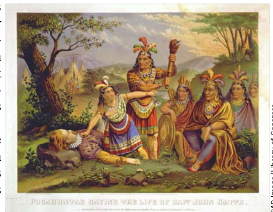
Illustration de la légende de Pocahontas appartenant à la collection de la bibliothèque du Congrès.

Quatre siècles plus tard, les Amérindiens de Virginie sont fiers de leur identité, de leur patriotisme et du rôle qu'ils ont joué dans la construction du pays, y compris de leur service à la nation dans les forces armées, et de leur participation dans les églises locales. Ils souhaitent que leur valeur soit mieux reconnue.