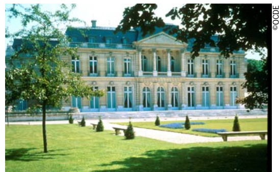
Château de la Muette, siège de l'OCDE à Paris

C'est en septembre 1961 que l'OECE est remplacée par l'Organisation de Coopération et de Développement Economique (OCDE). Organisation mondiale, elle compte aujourd'hui 30 pays membres (Allemagne, Australie, Autriche, Belgique, Canada, Corée du Sud, Danemark, Espagne, Etats-Unis, Finlande, France, Grèce, Hongrie, Islande, Irlande, Italie, Japon, Luxembourg, Mexique, Norvège, Nouvelle-Zélande, Pays-Bas, Pologne, Portugal, République Slovaque, République Tchèque, Royaume-Uni, Suède, Suisse, Turquie).