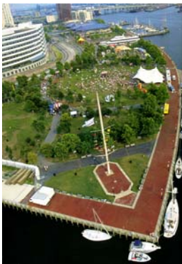
Port de Norfolk

Ce jumelage très actif se concrétise également par des escales annuelles de vaisseaux de guerre des deux nations dans ces deux grands ports militaires. En 2006, l'association « France États-Unis Toulon » a reçu les marins de sept bâtiments de l'U.S. Navy lors de dîners, réceptions ou soirées dansantes. Chaque année, cette association offre un voyage à Norfolk à cinq étudiants qui sont accueillis dans des familles américaines dont les enfants sont, en échange, reçus à Toulon.