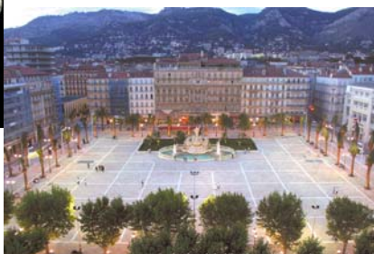
Toulon : la Place de la Liberté