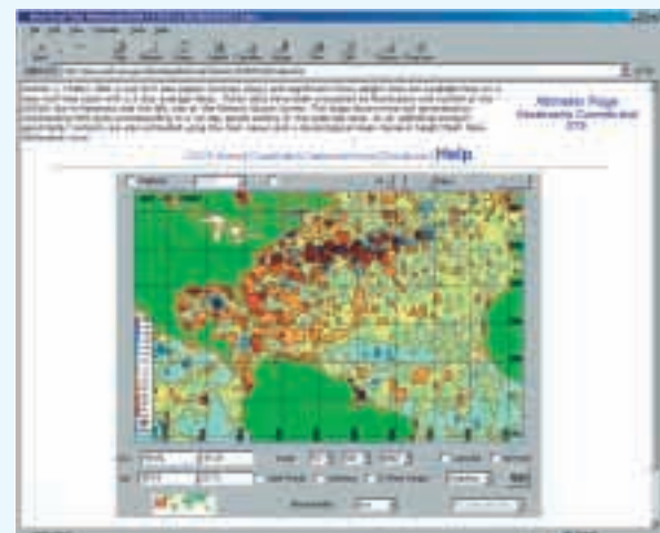
Figure 2. La page d'accueil présente une carte des anomalies de hauteurs de mer de l'Atlantique tropical et de l'Atlantique Nord

Ce système permet aux utilisateurs d'avoir accès aux anomalies de hauteurs de mer (SHA) et d'afficher les traces au sol des altimètres, les champs de hauteurs dynamiques, les vecteurs de courants géostrophiques, les isolignes de hauteurs de mer, ceci en appliquant éventuellement des masques de sélection selon la profondeur, etc. La couverture est mondiale et l'utilisateur peut sélectionner une région d'intérêt particulière ainsi que la période qu'il