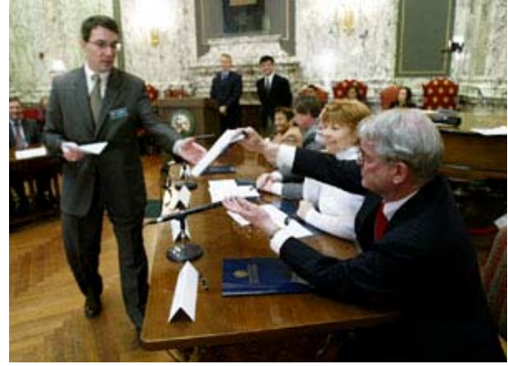
Washington eyaleti seçici kurulunun 11 üyesi 2004'te, Demokrat Parti başkan adayı John Kerry için oy kullanıyor.

Ülkenin kurucuları gücü eyaletler ve ulusal hükümet arasında paylaşılma planlarının bir parçası olarak Seçici Kurul sistemini tasarlamıştır. Bu sisteme göre bir adayın ülke genelinde oyların çoğunluğunu alması başkan olması için gerekli değildir. Bu nedenle, eyalet seçimlerine göre kazanılan seçici oylar ülke genelindeki oyların sayısından farklı bir sonuç oluşturabilir. Amerikan tarihinde 17 kişi oyların çoğunluğunu almadan başkanlık seçimini kazanmıştır. Bu kişilerden ilki 1824 yılındaki seçimlerin galibi John Quincy Adams, sonuncusu 2000 yılı seçimleri galibi George W. Bush'tur. Bazıları Seçici Kurulu eskimiş bir sistem olarak görürken, bazı gözlemciler bu sistemi destekler çünkü bu sistem başkan adaylarının sadece nüfusu çok olan eyaletlerde değil pek çok eyalette yarışmasını gerektirir.