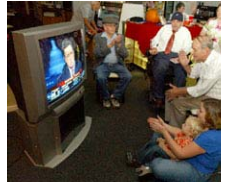
II. Dünya Savaşından sonra televizyonda yayınlanan genel seçimler izleyicilerden büyük ilgi gördü. Resimde, parti müdavimleri Mississippi'nin Meridian şehrindeki Cumhuriyetçi Parti merkezinde televizyonda seçim sonuçlarını izliyor.

Sonuç olarak, şimdilerde eyaletlerin çoğu ön seçim düzenliyor. Eyalet yasalarına bağlı olarak seçmenler ön seçimde oylarını bir partinin başkan adayına ve taahhüt vermiş delegelere, kendileri adına oy kullanacak delegelere veya parti kongresinde bir adaya taahhüt vermiş kongre delegeleri seçerek dolaylı olarak bir adaya verebilir. Parti kongresi sistemine göre küçük bir bölgede yani yerel bir seçim bölgesinde yaşayan partizanlar bir araya gelerek belli başkan adaylarını desteklemeye taahhüt eden delegelere oy verir. Daha sonra bu delegeler seçim bölgesi ve eyalet kongrelerine katılacak olan delegelerin seçildiği il kongresinde bölgelerini temsil eder. Delegeler de bu kongrelerde eyaletlerini ulusal kongrede temsil edecek olan delegeleri seçer. Bu sistem birkaç aylık bir süreç olmasına rağmen, aday tercihleri esasen ilk oylamada belli olur.