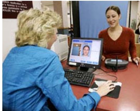
Rhode Island'daki genç bir bayan ehliyetini almak için imza atarken oy kullanmak için de kaydını yaptırıyor.

Seçim sürecinde adil, yasal ve profesyonel bir çaba gösterilir. Ekipman ve oy pusulaları genellikle yerel yetkililer tarafından satın alınır. Bu nedenle seçmenlerin kullandığı ekipmanın tipi ve durumu genellikle yerel