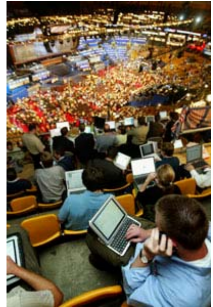
İnternet blogcuları Demokrat Partinin Boston'daki 2004 Yılı Ulusal Kongresinde, kongre bloglarını güncelliyor. Çağdaş başkanlık kongreleri ciddi siyasi toplantılarından daha çok medyatik yönüyle dikkat çeker.

halkın siyasi partilere duyduğu güvensizliğin giderek artmasıdır. Kongre ve eyalet adaylarını belirlemek için ön seçim sisteminin benimsenmesi ve giderek sistemleşmesi halkın partilere muhalif olduğunun bir kanıtıdır. Günümüzde Amerikalılar parti başkanlarının hükümet üzerinde büyük bir güce sahip olmalarına karşıdır. Kamuoyu anketleri sürekli olarak, nüfusun büyük bir çoğunluğunun, partilerin kimi zaman sorunları çözmek yerine daha karmaşık hale getirdiğini ve oy