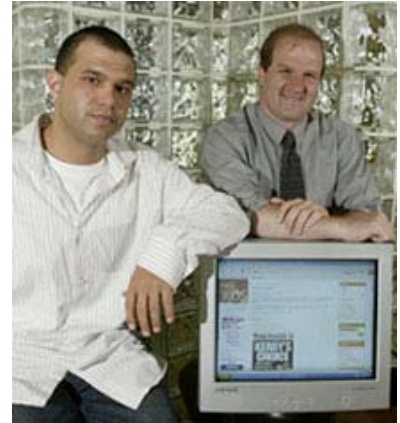
Para toplamak ve kazanma ihtimali düşük olan adaylara dikkat çekmek için internet giderek daha fazla kullanılıyor. Resimde, Ohio kongre üyesi adayı (sağda) ve iletişim direktörü (solda) blog sayfalarını gösteriyor.

II. Dünya Savaşından bu yana süregelen reform hareketlerinin sonucunda iki önemli eğilim doğdu. Öncelikle, daha fazla eyalet, başkanlık ön seçimleri ve parti kongrelerini geç yapmaktansa aday belirleme döneminin başlarında yapmaya karar verdi. Bu eğilim "front-loading" olarak bilinir. Erken ön seçim veya parti kongresi yapmak eyaletteki seçmenlerin, adayların seçiminde daha fazla etkili olmasını sağlayabilir. Ayrıca, adayları eyaletin gereksinim ve ilgi duyduğu alanlara daha erken hitap