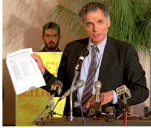
2000 yılında Green (Yeşil) Parti başkan adayı ve sosyal aktivist olan Ralph Nader çok az oy aldı. Al Gore taraftarları Nader'i liberal oyları alıp George W. Bush'un seçilmesine neden olmakla suçladı.

Üçüncü partilerin seçim sonuçları üzerinde büyük bir etkisi olabileceğine dair kanıtlar mevcuttur. Söz gelimi, Theodore Roosevelt'in 1912'deki üçüncü parti adaylığı Cumhuriyetçi seçmenleri bölerek Demokrat Woodrow Wilson'ın toplam oy sayısının yarısından azıyla seçilmesini sağladı. 1992'de, H. Ross Perot'un bağımsız adaylığı 1980'lerde Cumhuriyetçilere oy veren seçmenlerin fikrini değiştirmiş ve seçimlerden önce görevde olan Cumhuriyetçi başkan George H. W. Bush'un galip gelmesine neden olmuştur. Bu durumun en yakın örneği 2000 yılında Cumhuriyetçi George W. Bush ve Demokrat Al Gore arasında yaşanan çekişmedir. Green Party adayı Ralph Nader Florida'da seçimlere katılmasaydı, Gore buradaki seçici oyları kazanıp başkan olabilirdi.