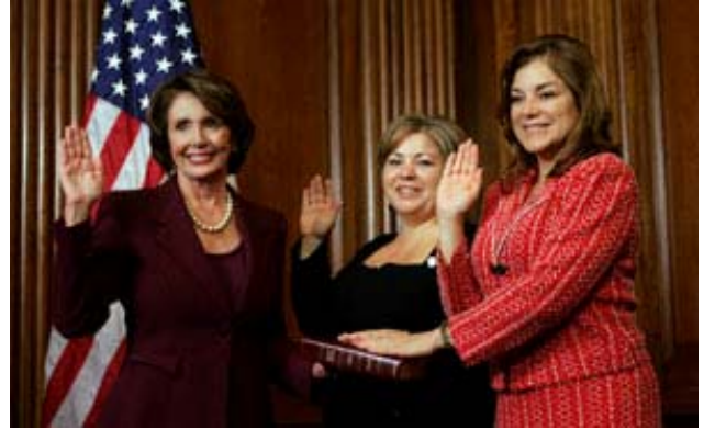
Temsilciler Meclisi Başkanı Nancy Pelosi (solda), Kaliforniya'dan Meclise seçilen Linda (ortada) ve Loretta Sánchez adlı iki kız kardeşe yemin ettiriyor.

Temsilciler Meclisi ve Senato neredeyse eşit yetkilere sahip olmakla beraber üyelerin seçilme yöntemi biraz farklıdır. Amerikan Cumhuriyetinin kurucuları Temsilciler Meclisi üyelerinin halka yakın olması, halkın istek ve emellerini yansıtması niyetindeydi. Bu nedenle Kurucular küçük yasama bölgelerinden çok sayıda üyenin bulunması ve iki yılda bir seçim yapılması için Meclisi oldukça büyük şekilde tasarlamıştır. İlk başta iki yıllık bir dönem bile çok uzun bulundu. Ulaşımın atla yapıldığı günlerde Washington'da iki yıl için seçilen bir kongre üyesi görev süresi boyunca seçmenlerinden uzak kalıyordu. Bugünlerde ise kongre üyeleri, iki yılda bir yapılan seçimler nedeniyle destek toplamak için her hafta kendi bölgelerine gidiyor.