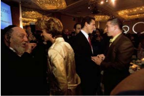
New York'lu siyasetçi Andrew Cuomo (ortada) valilik seçimleri için yaptığı kampanyanın kaynak sağlama etkinliğinde taraftarlarıyla konuşuyor.

organizasyon kendi web sitelerinde adayların, siyasi partilerin ve PAC'lerin katkı ve harcamalarını yayınlar. Bu web sitelerin amacı, basın ve seçmenlerin, adalara ve örgütlere para veren grupları öğrenmesini kolaylaştırmaktır. Vatandaşların ve komitelerin adalara vereceği para miktarına yasal kısıtlama getirilmiştir. Dolayısıyla başkanlık kampanyası için yüz milyonlarca dolar toplaması gereken bir başkan adayı yüzlerce destekleyici bulmalıdır.