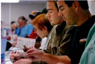
Seçmenler oylarını kullanmadan önce belgeleri dolduruyor, San Diego, 2004.

ABD'de bazı federal hükümet ve çoğu eyalet ve yerel yönetim görevleri için seçimler çift yıllarda yapılır. Bazı eyalet ve yerel idari bölgelerdeyse tek yıllarda yapılır.