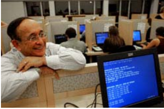
Marist College Kamuoyu Enstitüsü'nden Lee Miringoff anket faaliyetlerini denetliyor.

Seçim politikasını yöneten kural ve yasaların kapsamında yer almasa da, kamuoyu anketleri son yıllarda seçim sürecinin önemli bir parçası haline gelmiştir. Pek çok siyasi aday anketçilerle birlikte çalışarak sık sık anket yaptırır. Anket sonuçları adayların rakiplerine karşı ne kadar önde veya geride olduklarını ve seçmenlerin en çok hangi meselelere önem verdiğini görmelerini sağlar. Ayrıca basın (gazeteler ve televizyon) da kamuoyu anketleri yapar ve sonuçları (özel anket sonuçlarıyla birlikte) halka duyurur. Böylece vatandaşlar destekledikleri adayları, önem verdikleri meseleleri ve politikaları diğer vatandaşların tercihleriyle karşılaştırabilir.