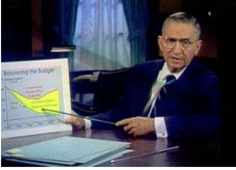
1992'de Teksaslı milyarder Ross Perot federal bütçe açığıyla ilgilendi ve bir üçüncü parti başkanlık seçimi kampanyası düzenleyerek görüşlerini televizyonda ayrıntılarıyla açıkladı. Bazılarına göre Perot'un tek başarısı Bill Clinton'ın başkan seçilmesini sağlamaktı.

Üçüncü partiler ve bağımsız adaylar daha önce bahsedilen engellere rağmen, Amerikan siyasi sisteminde sürekli bir role sahiptir. Zaman zaman büyük partilerin yüzleşmekten kaçındıkları sosyal meseleleri kamu ve hükümet gündemine taşımışlardır. Ancak üçüncü partilerin çoğu tek bir seçimde ayakta kalabilmiş daha sonra kapanmış, önemini yitirmiş veya büyük partilere katılmıştır. 1850'lerden beri yalnızca bir yeni parti, Cumhuriyetçi Parti, büyük bir parti olmayı başarmıştır. Burada ülkeyi bölen bir ahlak sorunu yani kölelik söz konusuydu. Bu sorun aday toplamak ve seçmenleri harekete geçirmek için sağlam bir temel teşkil etti.