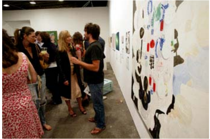
... ya da sanat galerisi veya başka yerlerde kaynak sağlama amaçlı partiler verirler.

Seçim harcamalarının günümüz ekonomisinde ürün ve hizmet masraflarıyla orantılı olduğunu düşünenler reform önerilerine karşı çıkmıştır. Bu bakımdan seçim harcamaları Amerika'nın uzun süredir süregelen çoğulculuk politikasının çağdaş bir ifadesi olarak, çıkar gruplarının yaptığı büyük katkı ve harcamalar ise demokrasinin seçim rekabeti için ödediği bedel olarak görülür. Çıkar grubu bağışlarıyla hükümet politikası arasında bilimsel bir bağlantı olduğunu kanıtlamak zordur. Mahkemeler kampanyaya yapılan bağış ve harcamalar daha fazla kısıtlandığı takdirde, sponsorların siyasi arenada anayasal şekilde korunan ifade özgürlüğünün kısıtlanıp kısıtlanmayacağını sorgulamaktadır. Çağdaş kampanyalar için çok fazla harcama gerektiği göz önünde bulundurulduğunda, bazı varlıklı kişiler resmi bir görev için kendi kampanyalarını rahatlıkla finanse eder. Bunu kısıtlayan bir yasa yoktur. Bazen kazanırlar bazen de kaybederler.