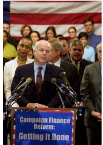
Cumhuriyetçi Parti Senatörü John McCain kampanya finansmanını reforme etmek için çok çaba harcadı. Reform ile ne kastedildiği hala tartışılıyor.

Siyasi komiteler kayıt yaptırdıktan sonra kampanya için para toplamaya başlayabilirler. Bu paralar ve harcamalar üç ayda bir veya her ay FEC'e bildirilir. Bildiriler elektronik olarak dosyalanabilir. İsteyen herkes bu bildirimlere FEC'in web sitesinden [ www.fec.gov ] ulaşabilir. Çok sayıda özel