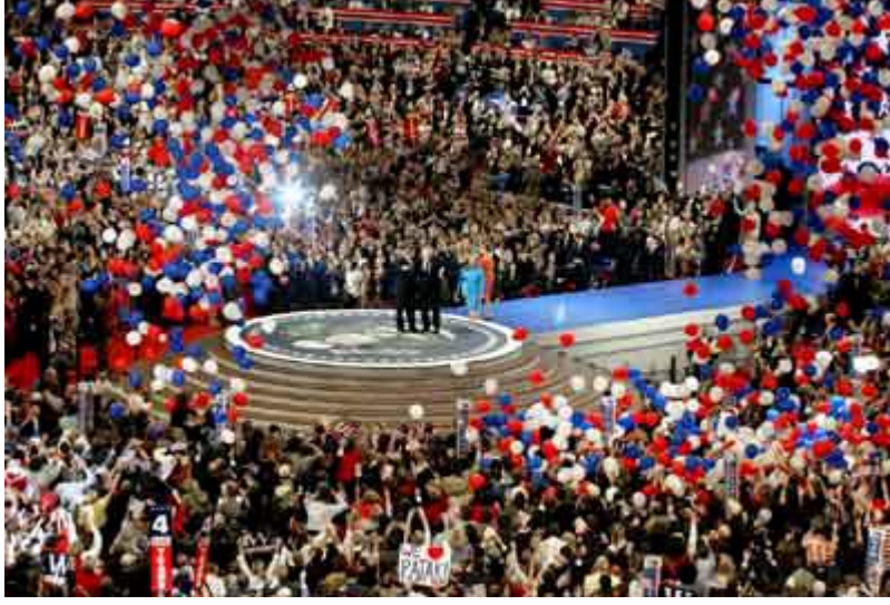
Cumhuriyetçi Partinin Philadelphia'daki 2000 Yılı Ulusal Kongresi.

Özgür ve adil bir seçim demokrasinin temel taşıdır. İktidarın barışçıl bir şekilde devredilmesi için çok önemlidir.