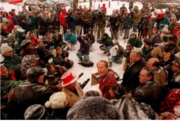
Eyalet ön seçimleri (veya bazen parti kongreleri) Cumhuriyetçi ve Demokrat Parti başkan adaylarının rotası haline geldi. Resimde, bir Cumhuriyetçi başkan adayı olan Lamar Alexander (ortada, kareli gömlekle) 1996 kışında medya ve New Hampshire'daki seçmenlerini selamlıyor.

etmeye teşvik eder ve eyalet içinde organize olmalarına ve aday belirleme sürecinde psikolojik zafer kazanmak amacıyla personel, medya ve otel için harcama yapmaya zorlar.