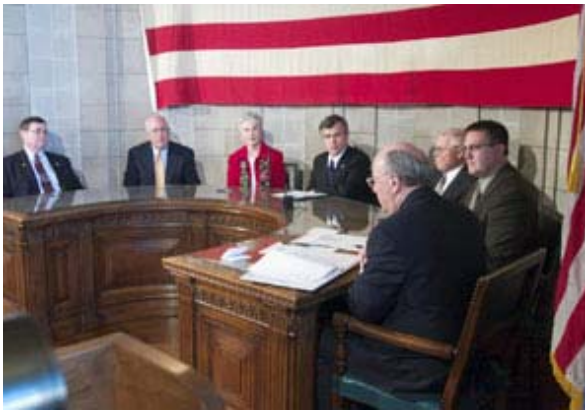
Nebraska Seçici Kurulunun beş üyesi Aralık 2004'te, Nebraska'nın Lincoln şehrinde Başkan George W. Bush için oy kullanıyor.

sistemine göre dağıtılır. Yani çok az farkla olsa bile bir eyaletteki oyların çoğunluğunu alan herhangi bir aday o eyaletteki seçici oyların tümünü kazanır. Maine ve Nebraska'da oyların çoğunluğunu alan aday iki seçici oy kazanırken diğer seçim bölgesindeki adaylar bir seçici oy alır. Tek üyeli bölge sistemi gibi Seçici Kurul da