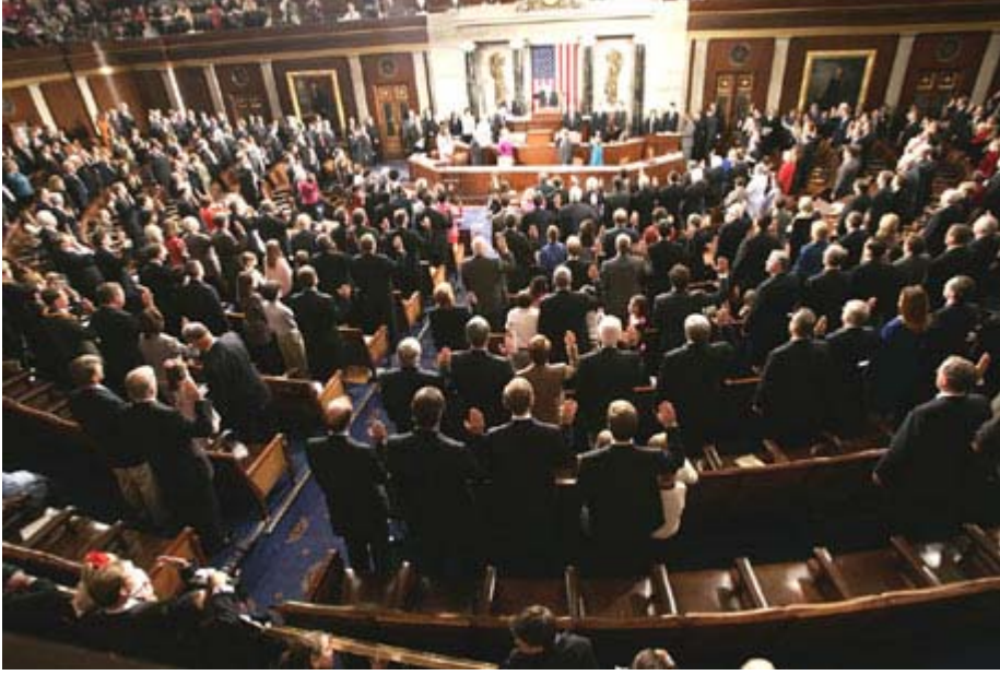
109. Kongre üyelerinin Capitol Hill'de bulunan Temsilciler Meclisindeki yemin töreni, 2005.

ABD'de ulusal ve eyalet düzeyindeki yasama organı üyelerini seçmek için uygulanan standart, "tek üyeli" bölge sistemidir. Bu sistemde herhangi bir seçim bölgesinde oyların çoğunluğunu alan aday seçimleri kazanır. Birkaç eyalet seçimlerinde oyların çoğunluğunun alınmasını gerekli görürken, devlet görevlilerinin çoğu basit çoğunluk ile seçilebilir.