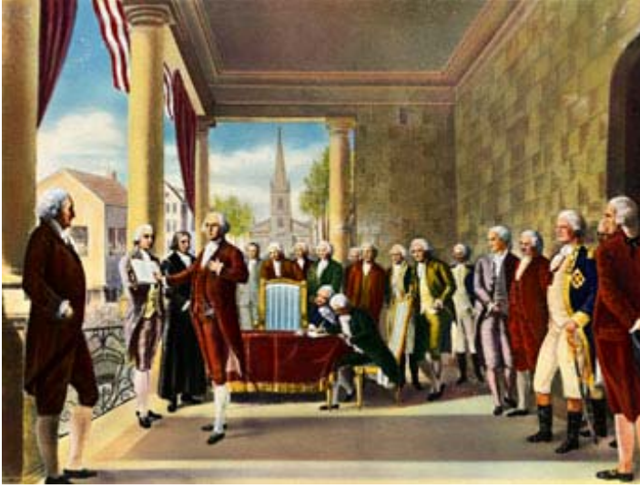
George Washington ABD'nin ilk başkanı olarak yemin ediyor, 1789. Washington siyasi gruplara güvenmese de halkçı partiler onun başkanlığı sırasında yükselişe geçti.

Partilerin başkanlığa aday gösterme kuralları Anayasada belirtilmemiştir. Daha önce de belirtildiği gibi Anayasanın hazırlanıp kabul edildiği 1700'lü yılların sonunda siyasi parti yoktu. Cumhuriyetin kurucuları bu tür partilerin kurulması için herhangi bir prosedür belirleme gereği duymamıştır.