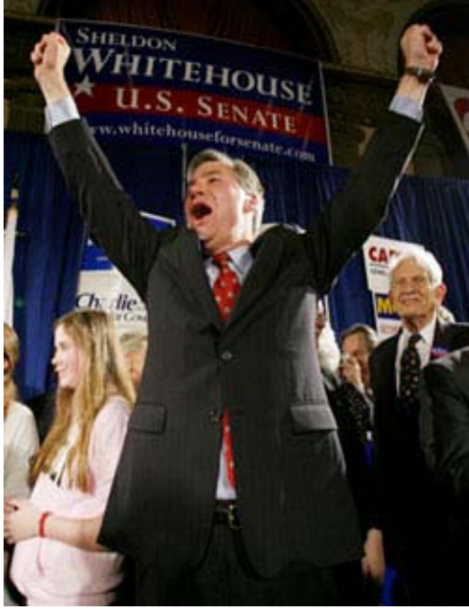
Demokrat Partili Sheldon Whitehouse Rhode Island eyaletinden senatör seçilişini kutluyor. Senatörler ve parlamento üyeleri önemli bir güce sahiptir.

ABD Kongre seçimlerinin başkan seçimleri kadar rekabetçi ve önemli olduğu söylenebilir. Bunun nedeni Kongrenin yasa yapmada merkezi bir rol oynamasıdır.