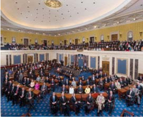
Kongre yüksek meclisi olarak da bilinen Senato kurucular tarafından ölçülü ve dengeleyici bir güç olarak kurulmuştur. Resimde 100 senatör yer alıyor.

Eskiden kongre seçimleri "parti merkezliydi". Pek çok seçmen bir siyasi partiye olan uzun süreli bağlılığından dolayı o partinin istekleri doğrultusunda oy veriyordu. Görevdekilerin kişilikleri ve performansları seçmenlerden gördükleri desteği olumlu veya olumsuz yönde çok az etkiliyordu. Son yıllarda adayların görüş ve kişilikleri seçim politikası üzerinde daha fazla etkili oldu ve vatandaşların partilerine olan bağlılığının önemini azalttı.