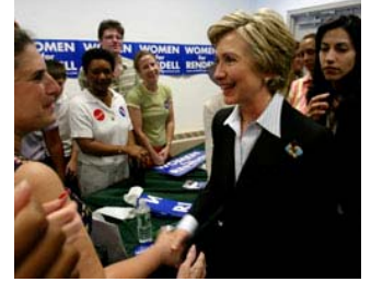
Üstte: Cumhuriyetçi Parti 2008 başkan adayı Rudolph Giuliani Güney Carolina'nın Bluffton şehrinde imza dağıtıyor. Altta: Demokrat Parti başkan adayı (2008) Hillary Clinton Pensilvanya'nın Narberth şehrindeki taraftarlarını ziyaret ediyor.