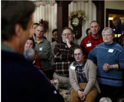
New Hampshire'deki seçmenler 2008'in başlarında Salem'deki bir evde Demokrat Parti başkan adayı John Edwards'ı dinliyor.

Zamanla iki ulusal parti kurulmasına olanak tanıyan sistemden ve Demokratların ve Cumhuriyetçilerin hükümet mekanizmasını kontrol altında tutmalarından dolayı kendi avantajları için işleyen diğer seçim kuralları koymasına şartı koyucu değildir. Sözelimi, yeni bir partinin adını bir eyaletteki oy pusulasına yazdırmak zorlu ve pahalı bir iş olabilir. Bunun için genellikle on binlerce imza toplamak ve bir sonraki seçimlerde pusulada kalmak için yeterli oy almak gereklidir.