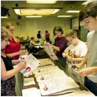
Washington eyaleti 1912'den beri, yeterli sayıda imza toplandığı takdirde vatandaşların inisiyatiflerinin oy pusulasında yer almasına izin verir. Resimde, gönüllüler Seattle'da bir eğitim programının başlatılması için imza veriyor.

ABD’de seçimler bir görev için kişi seçmekten daha fazlasını içerebilir. Bazı yerlerde kamu politikasıyla ilgili meseleler de oy pusulasında seçmenlerin onayına sunulabilir. Eyalet yasama meclisi veya yerel kurul veya konseyin seçmenlere sunduğu düzenlemeler (referandum) ve vatandaşların imzalarıyla oy pusulasında yer alan düzenlemeler (inisiyatif) genellikle bono (kamu projeleri için ödünç para alınmasını onaylama) ve hükümetin diğer zorunluluklarıyla ilgilidir. Son yıllarda oy pusulasında belirtilen önlemlerin özellikle bütçe ve politikalar üzerinde önemli bir etkisi bulunmaktadır. Bunun en iyi örneği Kaliforniya eğitim sistemidir.