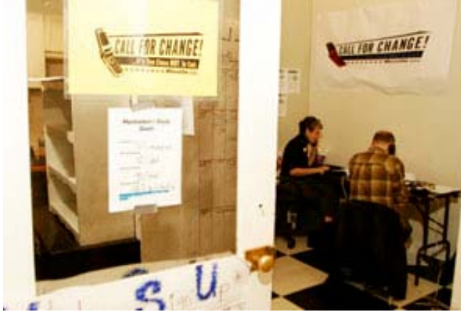
Siyasi Eylem komiteleri kulis yapıp her şekilde para toplayabilir. Seçmenleri harekete geçirmek için telefon edebilirler...

Başkan adayları 1976 yılından beri kamusal kaynaklardan yararlanabilmektedir. 2000 yılı seçimlerine kadar bütün başkan adayları belirtilen miktardan daha fazlasını kullanmayacaklarına dair söz vermeleri karşılığında hükümetin kaynaklarından yararlanabiliyordu. Ancak bu sistem, harcama limiti çok düşük olduğu ve adayların çoğunun özel kaynaklardan rahatlıkla toplayabileceği miktardan daha az olduğu için adaylar arasında giderek daha az rağbet görmektedir. Sonuç olarak gözde adayların birçoğu kamusal kaynağı tercih etmemektedir.