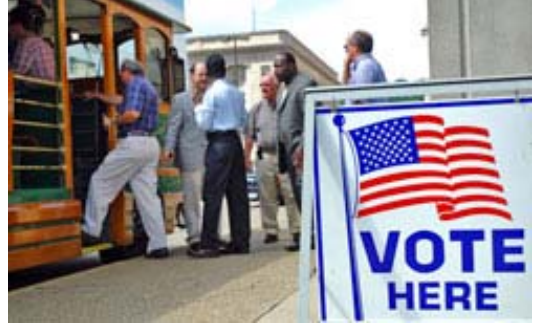
Seçmenler West Virginia'daki oy kullanma yerinden ayrılıyor. Bu kilise liderleri yasal kumar oyunlarının kapsamını genişletmek için yapılan halk oylamasında hayır oyu vermeye geldi.

Bir başkan adayı siyasi komite adı altında bir seçim kampanyası düzenlemelidir. Siyasi komitenin bir haznedarı olmalı ve Federal Seçim Komisyonuna (FEC) kayıt yaptırmalıdır. Her ne kadar adı Federal Seçim Komisyonu olsa da, FEC yalnızca kampanya finansmanı yasalarını denetleyip uygular, seçimleri yürütmez. (Seçmenleri kaydetme, oy verme sürecini yürütme ve oyları sayma eyalet ve yerel seçim görevlilerinin sorumluluğundadır.)