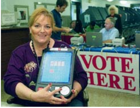
Bir sayman Teksas Austin'de yeni bir seçim aletini tanıtıyor.

Amerikan seçimlerinin çoğunda sonuçlar birbirine çok yakın değildir. Ancak bazen bir taraf çok az farkla kazanırken kimi zaman sonuçlar tartışmalara yol açar. 2000 yılı başkanlık seçimi sonuçları - Amerikan tarihinde sonuçların birbirine en yakın olduğu başkanlık seçiminde kazanını belirlemek için uzun süren çekişme – Amerikalıları ilk kez bu idari meselelerin pek çoğuyla karşı karşıya bıraktı.