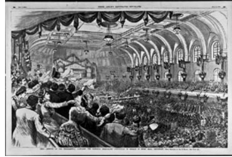
Aday belirleme toplantıları eski bir ABD politikası geleneğidir. Üstte, Cumhuriyetçi Partinin aday belirleme toplantısındaki delegeler, Chicago, 1868. Altta, Demokrat Partinin ulusal aday belirleme kongresi, Cincinnati, 1880.