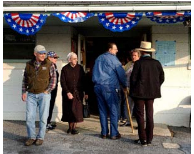
Pensilvanya'nın kırsal kesimindeki seçmenler (Amish topluluğu üyeleri dâhil) oy kullanma yerinde.

Bu bir gecelik anketler kamuoyunun hızlı tepkisini ölçer ancak bazı ekspertlere göre 300 milyondan fazla insanın bulunduğu bir ülkede böyle önemli bir mesele için 500 çok yetersiz bir rakamdır. Pek çok profesyonel bütün nüfusu temsilen en az 1000 yetişkinin görüşünün alınması gerektiğini düşünmektedir. En iyi anketler bile yoruma açıktır ve erken anket sonuçlarına göre ilk başta hiç tanınmayan bir aday daha sonra popüler hale gelebilir.