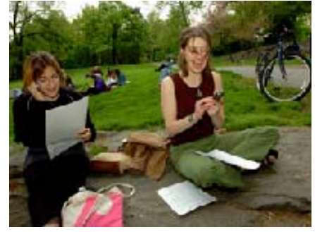
New York City'de bulunan Central Park'ta iki genç bayan Ohio'daki kayıtlı Demokratları oy kullanmaya teşvik ediyor. "Haydi sandığa" adlı çalışmalar yapan ve kar amacı gütmeyen taraftar örgütleri seçimlerde önemli bir rol oynar.

1970'lerden beri, başkan adayları çok sayıda delege topladığı için ön seçim ve parti kongresinden önce nihai adayın kim olacağı belirlenir. Bunun sonucunda, kongreler büyük ölçüde tören haline gelmiştir. Kongrenin önemli olayları arasında parti lideri veya liderlerinin bir konuşma yapması, başkan yardımcısı adayının ilan edilmesi, eyalet delegelerinin verdiği oyların açıklanması ve parti "platformu" (partinin çeşitli sorunlarla ilgili politikalarını belirten belge) onaylanması yer alır. Kongreler televizyonda yayınlanan bir siyasi etkinlik ve genel seçim kampanyasının başlangıcı olarak, parti adaylarını desteklemek ve muhalif partiyle aralarındaki farkı belirtmek için iyi bir fırsattır.