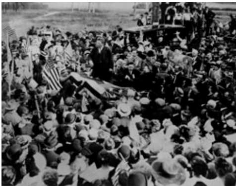
Üçüncü partilerin başkan adayları 20. yüzyılda birkaç kez aday olmuştur. Henüz seçimleri kazanmış olmasalar da başkanlık seçimlerinin gidişatını etkiledikleri bir gerçektir. Resimde, eski başkan Teddy Roosevelt 1912 yılında "Bull Moose" (Erkek Geyik) partisinin taraftarlarına konuşma yapıyor.

Amerikan siyasi sistemindeki uzun süreli ve etkileyici organize partizanlığa rağmen, Amerikan kültürünün en temel özelliklerinden biri