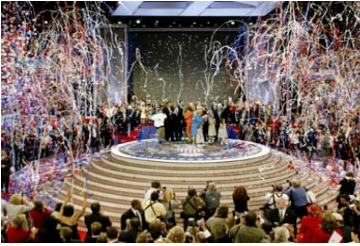
Son yıllarda, ön seçim etkinlikleri nedeniyle Cumhuriyetçi ve Demokrat Parti ulusal başkan adayı belirleme toplantılarının önemi azaldı. Şimdilerde adaylar bu toplantılarda Cumhuriyetçi Partinin New York'taki 2004 yılı kongresinde olduğu gibi kendilerini gösterme şansı buluyor.