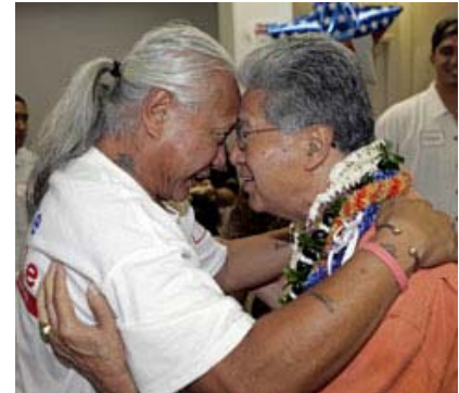
Hawaii Senatörü Daniel K. Akaka (D) (sağda), Honolulu'daki kampanya merkezinde bir taraftarını geleneksel şekilde selamlıyor.

Hem Cumhuriyetçi hem de Demokrat Partililer geniş tabanlı destek arar. Bu partiler tüm ekonomik ve demografik gruplardan destek görür. Genellikle Afrikalı Amerikan ve Yahudi seçmenlerin çoğu oylarını Demokrat başkan adayına vermesine rağmen, her iki parti de toplumdaki tüm sosyo-ekonomik gruptan önemli oranda