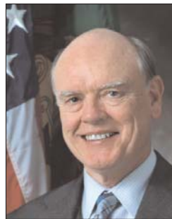
John Snow Ministre des finances des États-Unis

Les mesures visant à désorganiser les circuits financiers du terrorisme et à les démanteler sont appliquées sans relâche et vont se poursuivre. Nous ne reviendrons pas sur notre décision de découvrir les commanditaires du terrorisme et de mettre fin à leur action. Le présent numéro de «Perspectives économiques» montre dans quelle mesure les États-Unis et leurs alliés dans le monde entier continuent de se servir de leur pouvoir, de leurs relations et de leur savoir-faire pour s'attaquer aux sources, aux circuits et aux avoirs des commanditaires du terrorisme.