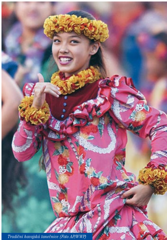
Tradiční havajská tanečnice