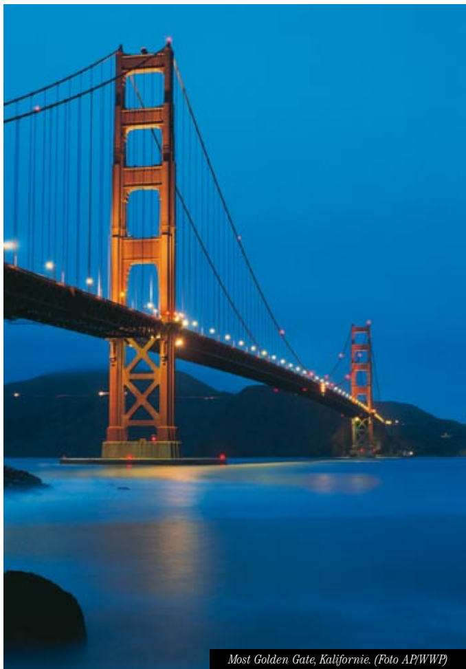
Most Golden Gate, Kalifornie.