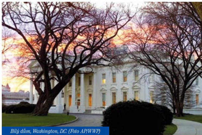
Bílý dům, Washington, DC.