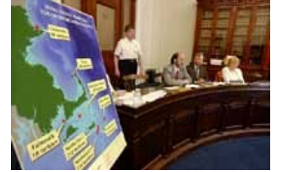
Massachusetts Eyaleti Yasama Meclisinin enerji komitesi 2003'te enerji üreten deniz üstü rüzgâr türbinlerinin kurulmasına ilişkin uzmanlardan bilgi alıyor.