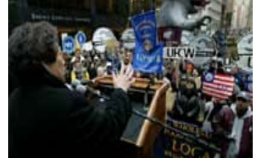
Bir sendika yetkilisi 2004'te New York City'de yapılan bir işçi mitinginde halka sesleniyor. Bu grup Kaliforniya'daki süper market çalışanlarının grevini desteklemek için toplanmıştır.