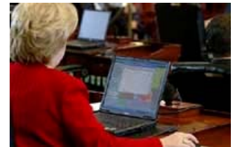
Eyalet yasama meclisi eyalet valilik makamıyla hemen hemen eşit güce sahiptir. 2003 tarihli bu fotoğrafta, bir Teksas eyaleti senatörü eyalet Senato meclisinde dizüstü bilgisayarından bazı verileri kontrol ediyor.

Bu sorumluluklardan bazıları pek çok eyalette, yerel yönetimler tarafından veya bu yönetimlerle birlikte yapılır. Söz gelimi, çoğu eyalette evlilik cüzdanları belediye veya il yönetimleri tarafından çıkarılır.