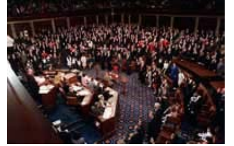
Temsilciler Meclisi üyelerinin Ocak 1989'daki vemin töreni

Temsilciler Meclisinin Senatoyla paylaşmadığı özel yetki ve sorumlulukları şunlardır: