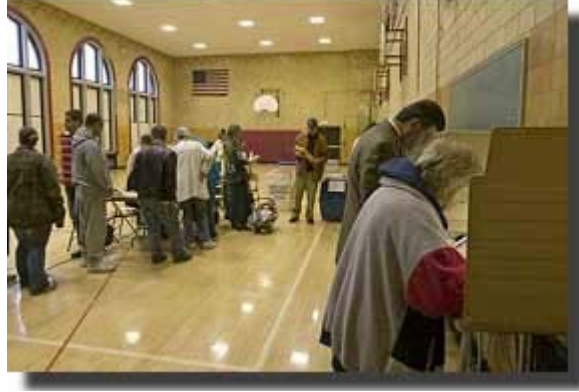
Arap Amerikalılar 2004 ABD başkanlık seçimleri için Michigan Dearborn'daki bir okulda oylarını kullandı

ABD dünyadaki tek anayasal federal cumhuriyet değildir. Pek çok "demokrasi" gerçekte anayasa cumhuriyeti olmakla beraber ABD gibi uzun süredir demokratik temsil, hukukun üstünlüğü ve anayasal koruma ilkelerine sahiptir.