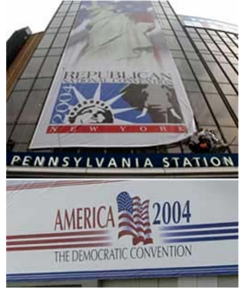
Üstte: Bir işçi Cumhuriyetçi Parti'nin 2004 Ulusal Kongresine hazırlık için New York City'deki Madison Square Garden binasının dışına bir pankart asıyor. Altta: Boston'daki Demokratik Parti'nin 2004 Kongresinin reklâmını yapan Fleet Center'da bir pankart asılı.

Yabancı hükümetler ABD'deki elçilikler aracılığıyla halkla ilişkilere yönelik çalışmalar veya kulis yapabilir ancak federal hükümette yer almak isteyen adayların kampanyalarını finansal olarak destekleyemez.