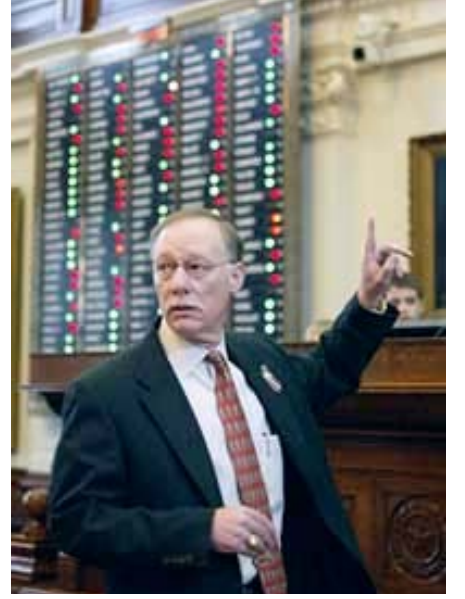
2005'te Teksas eyaletindeki bir yasa koyucu, bir okul finans vergisi yasa tasarısının son kabul aşamasında Teksas Temsilciler Meclisinde yapılan oylamada "evet oyu" kullanıyor. Teksas'ta iki yasama meclisi olduğu için yasa koyucunun tasarısı daha ayrıntılı müzakere edilmek üzere eyalet Senatosuna sunulur.

Son olarak, anayasa gereğince çoğu eyaletin dengeli bir bütçeye sahip olması gereklidir. Ulaşım veya diğer yapı projelerini finanse etmek için borç alma gibi istisnalar anayasada belirtilmelidir.