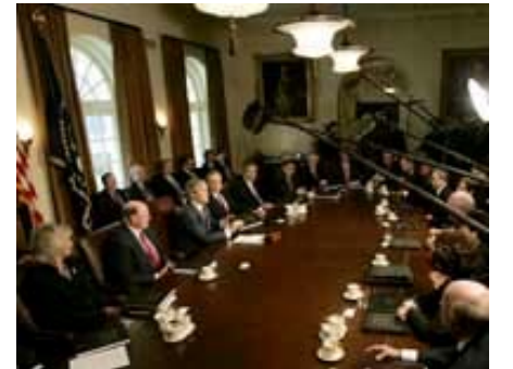
Başkan Bush Kasım 2004'te bir kabine toplantısına başkanlık ediyor.