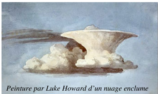
Peinture par Luke Howard d'un nuage enclume