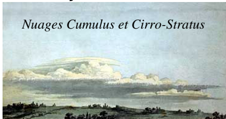
Nuages Cumulus et Cirro-Stratus

parce que leurs sommets sont souvent dans le niveau de nuages à mi-hauteur.