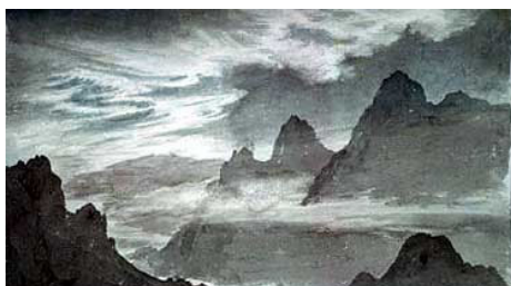
Peinture de nuages cirrus

Le nom Cirrus est dérivé du terme latin signifiant tresse de cheveux. Ces nuages sont minces et filamentés—comme des plumes d'oiseau, avec les bouts arrondis. On les appelle parfois queues-de-cheval à cause de leur forme, et ils accompagnent le beau temps. Ces nuages donnent parfois lieu à des phénomènes visuels comme le halo et la couronne. Les nuages cirrus sont les plus communs des nuages hauts.