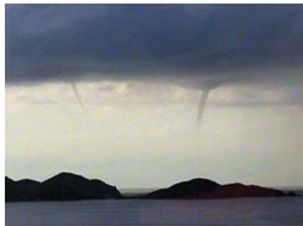
Tornado marine sous des nuages dans les Iles Vierges

C'est pourquoi la NASA lance des satellites vers l'espace pour le seul but d'étudier les nuages. Certains des satellites prennent simplement des photos de nuages. D'autres envoient des rayons invisibles vers les nuages pour mesurer des choses comme leur épaisseur ou le contenu d'eau.