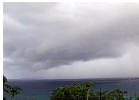
Photo d'un nuage bas sous un cumulonimbus avec convection d'air vigoureuse.