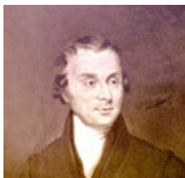
Luke Howard, père de la Classification des Nuages