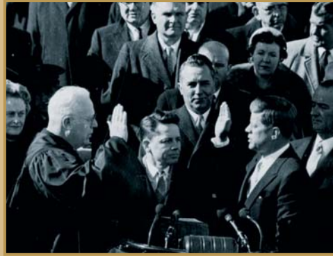
राष्ट्रपति जॉन एफ. केनेडी अपने पद की शपथ लेते हुए।