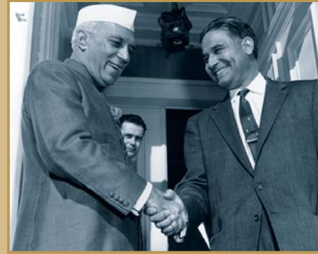
प्रधानमंत्री जवाहर लाल नेहरू प्रतिनिधि दलीप सिंह सौंद के