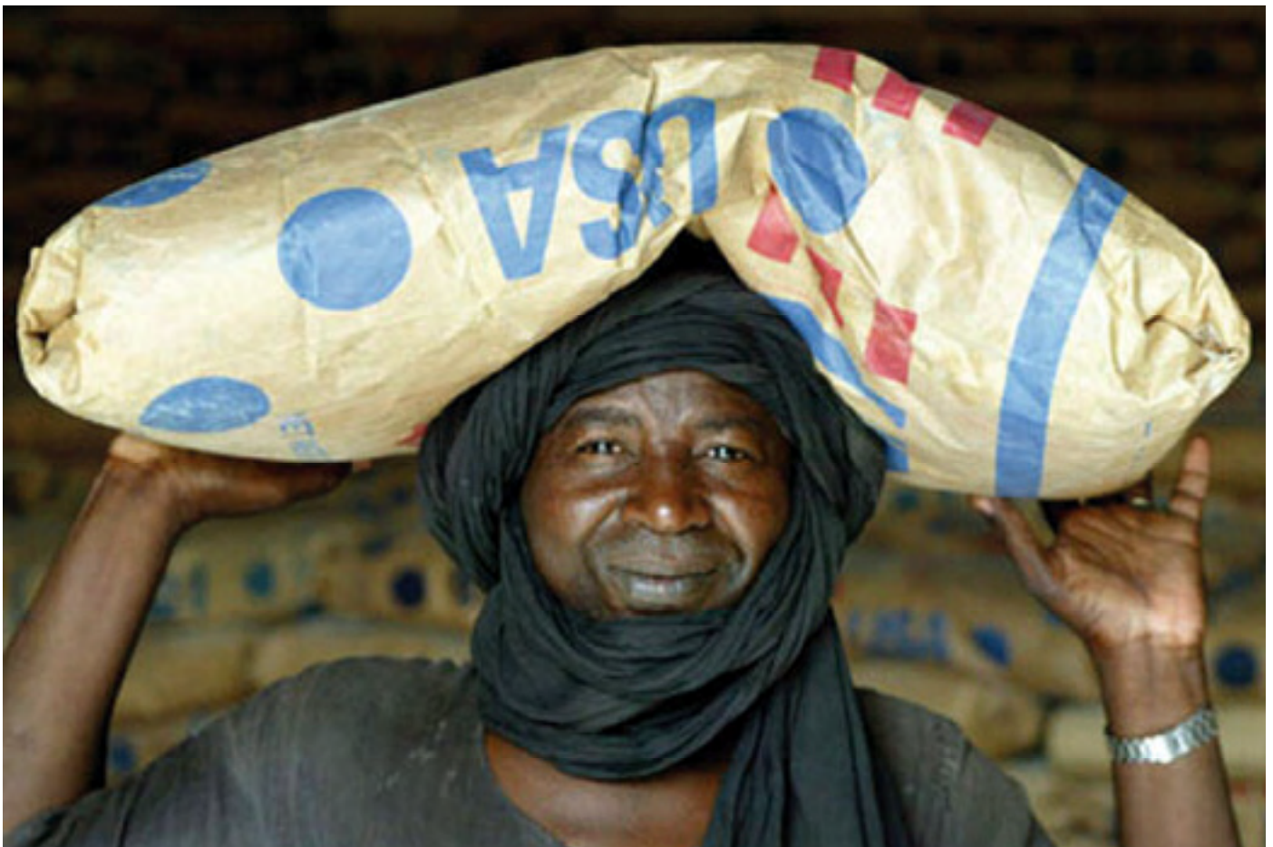
Los programas regionales de los EEUU en Africa del Oeste apoyan a las poblaciones locales.

En Monterrey, México, el Presidente George W. Bush hizo un llamamiento en favor de un nuevo pacto para el desarrollo mundial que vincule unas contribuciones mayores de los países desarrollados a una mayor responsabilidad de las naciones en desarrollo. Como respuesta, los Estados Unidos establecieron la MCC en 2004 para colaborar con algunos de los países menos favorecidos del mundo. La MCC se fundamenta en 50 años de experiencia de los Estados Unidos en materia