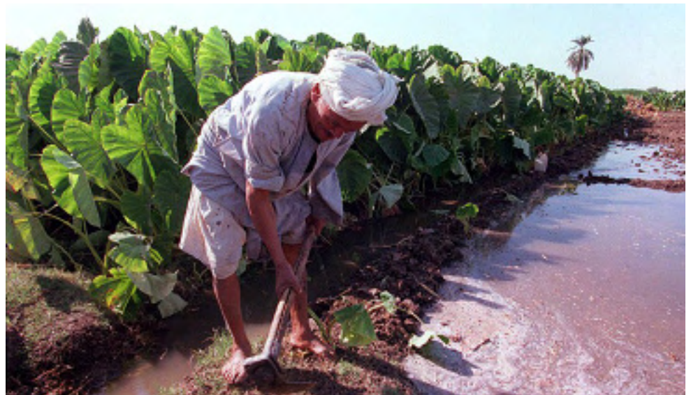
Mejora de la productividad en el sector agrícola de Egipto.

Uno de los mecanismos primordiales de los Estados Unidos para prestar asistencia a la