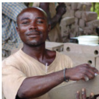
En Uganda, el fortalecimiento en capacidad de comercio ayuda al crecimiento de las pequeñas empresas.

Director, Departamento de Comercio y Competencia, 7 de octubre de 2005