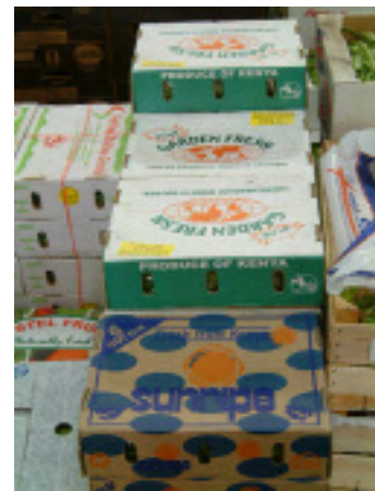
Productos agrícolas de Kenya listos para envíos a destinos locales o internacionales.

Otros tipos de asistencia abarcan desde los servicios energéticos hasta el turismo sustentable. La Iniciativa Regional del Asia Meridional tiene un aspecto energético que promueve la formación de vínculos mutuamente beneficiosos en materia de energía entre las naciones del sur de Asia. Este programa fomenta la comprensión de los beneficios derivados del comercio energético regional y establece la capacidad para aprovechar las oportunidades que ofrece ese comercio. En Ecuador, la asistencia técnica y la formación respaldan el ecoturismo basado en los recursos locales como opción productiva a la sobrepesca, mejora la administración local y fomenta un plan de zonificación marina.