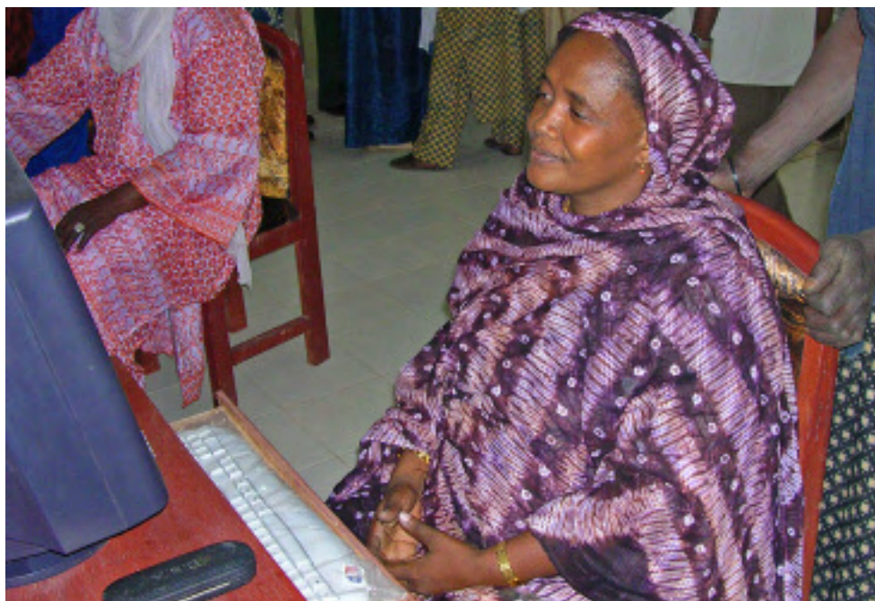
Unos clientes que utilizan un Centro comunitario de Información en Mali.

los donantes se ha reconocido como una "práctica óptima" para la gestión general del proceso del MI.