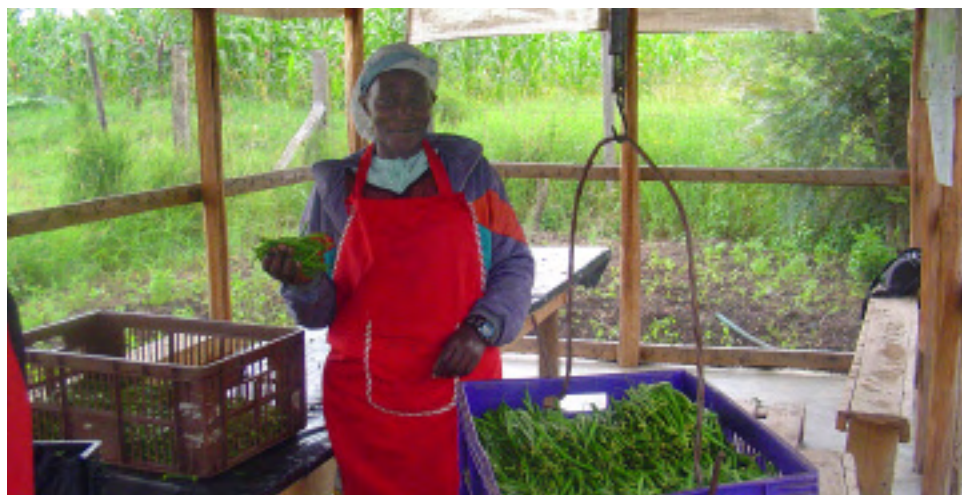
Unos agricultores de Kenya clasifican, pesan y almacenan productos agrícolas para mantener la calidad y la inocuidad.