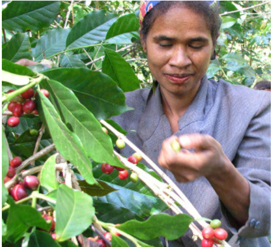
Los cultivadores de café de Timor-Leste amplían sus ventas mediante el reconocimiento de los posibles mercados de café orgánico certificado.

Los Estados Unidos son el mayor país donante de asistencia para el FCC, a lo que contribuyen más de $1.340 millones durante el ejercicio fiscal de 2005, lo que representa un aumento considerable respecto de los