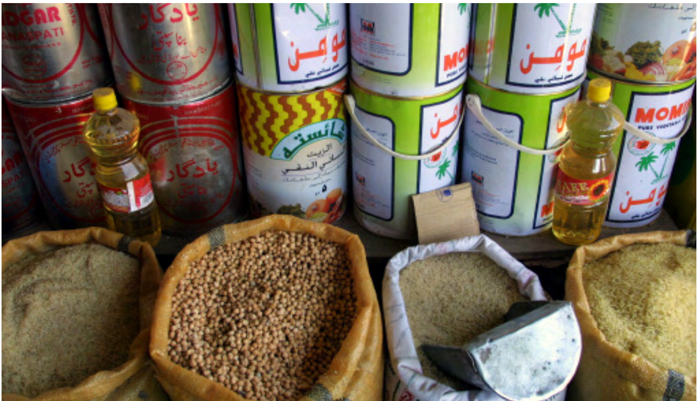
Los granos básicos en un mercado en Afganistán.

En julio de 2004, los miembros de la OMC se fijaron un programa ambicioso para la conclusión de la Ronda de Doha de negociaciones comerciales. En ese momento, los miembros reconocieron,