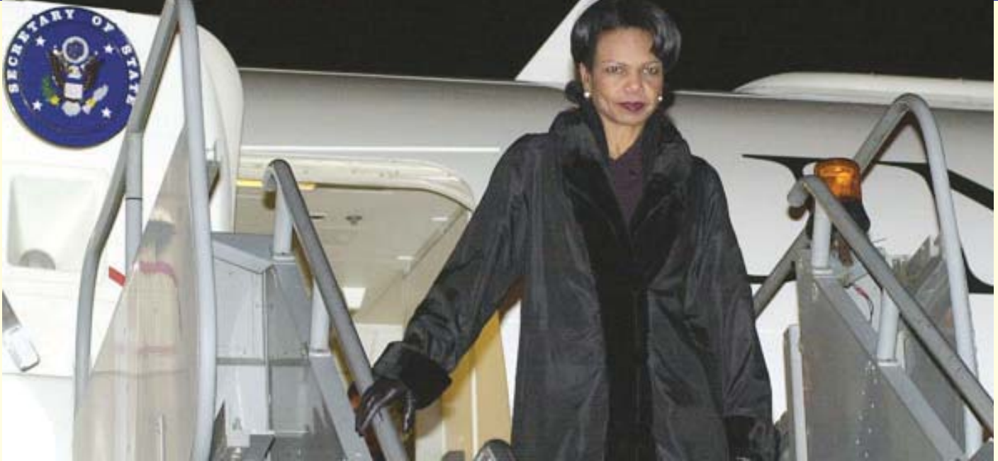
Dr. Condoleezza Rice