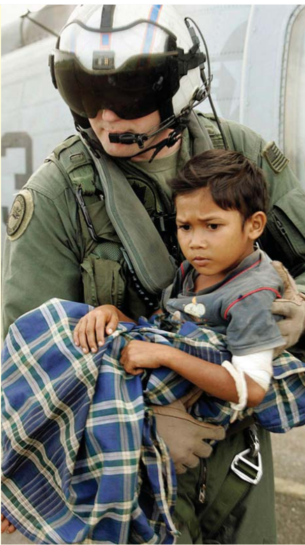
Wani Sojan Amirka dan agaji na kokarin taimakawa dan yaro da ya ji rauni a Banda Aceh.