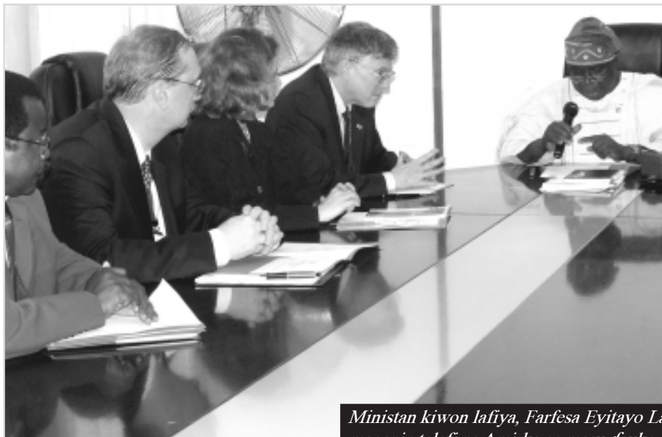
Daga Musa Ibn Mohammed Sashen Hulda da Jama'a Ofishin Jakadancin Amirka da ke Abuja.