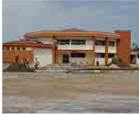
Dakin Nazari na Amirka da ke Kalaba, Cibiyar BunKasa Harkokin Mata, Layin Ekpo Achibong, Sashen Mariam, Kalaba.. Wayar Tarho: 087-2389020/2.