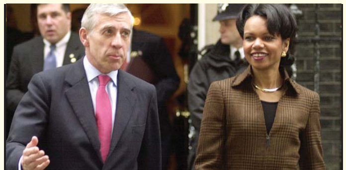
Tare da Sakataren Harkokin Waje na ƙasar Biritaniya, Jack Straw