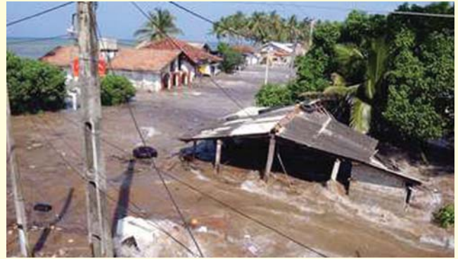
Boren ruwan Tsunami ya mamaye gari a Banda Aceh.