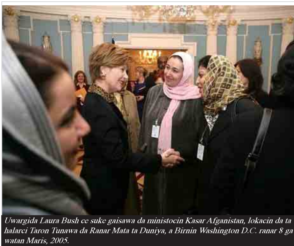
Uwargida Laura Bush ce suke gaisawa da ministocin Kasar Afganistan, lokacin da ta halarci Taron Tunawa da Ranar Mata ta Duniya, a Birnin Washington D.C. ranar 8 ga watan Maris, 2005.

“Duk mun fito daga wurare dabam-daban, amma fafutukar neman 'yanci wani haƙƙi ne da ya rataya a wuyan kowace al'ummar da kowa sai ya tsoma baki a dukan ƙasashe”.