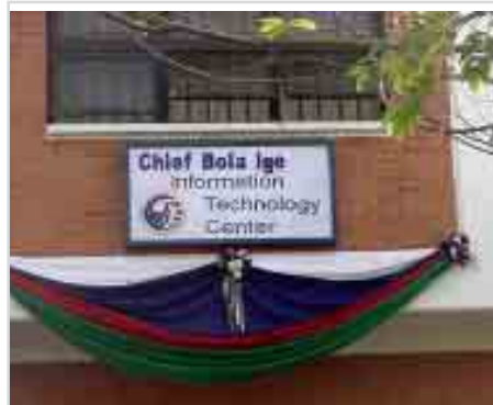
Dakin Nazari na Cif Bola Ige da ke Abuja, Cibiyar BunKasa Harkokin Mata, Central Business District, Abuja. Wayar Tarho: 09-6715939.