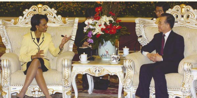
Ganawa da Firamiya ƙasar Sin, Wen Jiabao