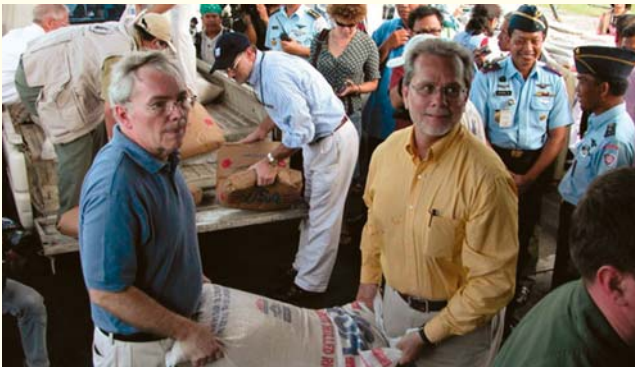
Jakadan Amirka a Indonesia Pascoe tare da Daraktan USAID Frejo sune suka jagoranci wannan kokarin farko na taimakon agaji.