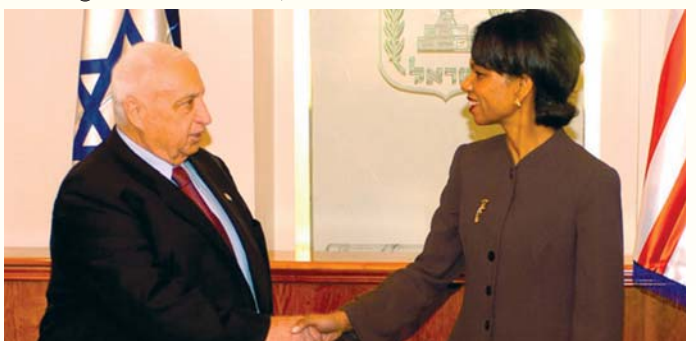
Tare da Firayim Ministan Is'raila, Ariel Sharon.