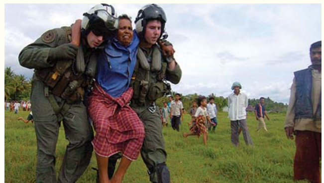
Sojojin Amirka na kokarin kai wannan mata cikin jirgi mai saukar angulu domin taimaka mata da magani.