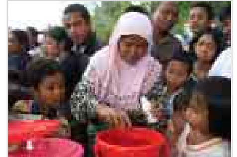
Kokarin tsabtace ruwan sha domin tabatar da ci gaba lafiyar yara da sauran al'umma a ƙasashen Asiya da Afirka inda wannan bala'in ambaliyar Tsunami ta abku.