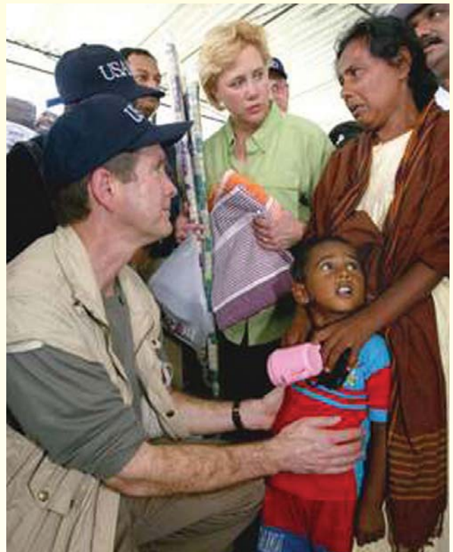
'Yan Majalisar Dattijai Bill Frist (farko daa hagu) da Mary Landrieu (a tsakiya) su na kokarin jajanta ma wadanda wannan bala'i ta abka masu.