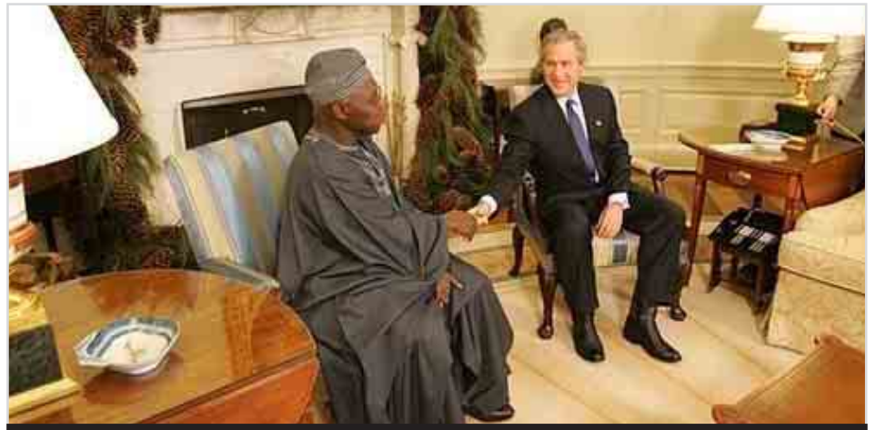
Shugaba George W. Bush tare da Shugaban Kungiyar Tarrayar Afirka kuma Shugaban Nijeriya, Cif Olusegun Obasanjo a Fadar “White House” da ke Amirka.

Kayayyakin da Amirka ke kawowa kasashen da ke yankin Saharar Afirka don taimaka wa shirin na AGOA ya karu da kashi 36.3 cikin 100 wanda ya kai dalar Amirka miliyan dubu 14 a cikin 2003. Kaso mafi tsoka kuma ya fito ne daga Nijeriya, a kan kayayyakin shirin na AGOA daga Amirka, waƙanda suka shafi harkar wutar lantarki da makamantansu, in ji rahoton. Amma an samu ragowa a kan kayayyakin masaƙu da sutura da injunan harkokin safara, a cikin yawan kayayyakin da Amirka ta kawo a 2002. Hukumar cinikin ta bayar da bayanan harkokin cinikin da zuba jari tsakanin Amirka da Afirka da cewa sun bunkasa a 2003, yayin da ta bayar da rahoto a kan shirin AGOA da tattaunawa a kan manyan harkokin ci gaban ƙasa dangane da ciniki da tattalin arziki da zama masu muhimmanci ga ra'ayoyin saye da sayarwa. Ta kuma bayar da rahoto a kan haƙe kasuwannin yankin Sahara da tara bayanai kan irin dɓimbin taimakon da shirin na Amirka ke bayarwa da