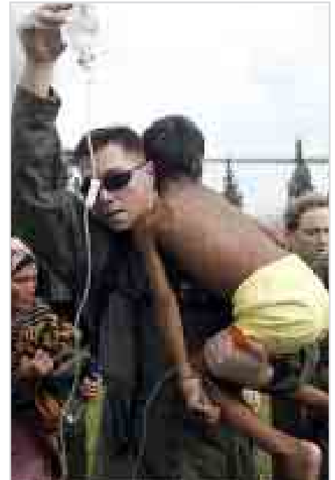
Ceton rai, shi ne babban burin Amirkawa da suka kai gudumawa wannan yankin da wannan bala'i ta abku.