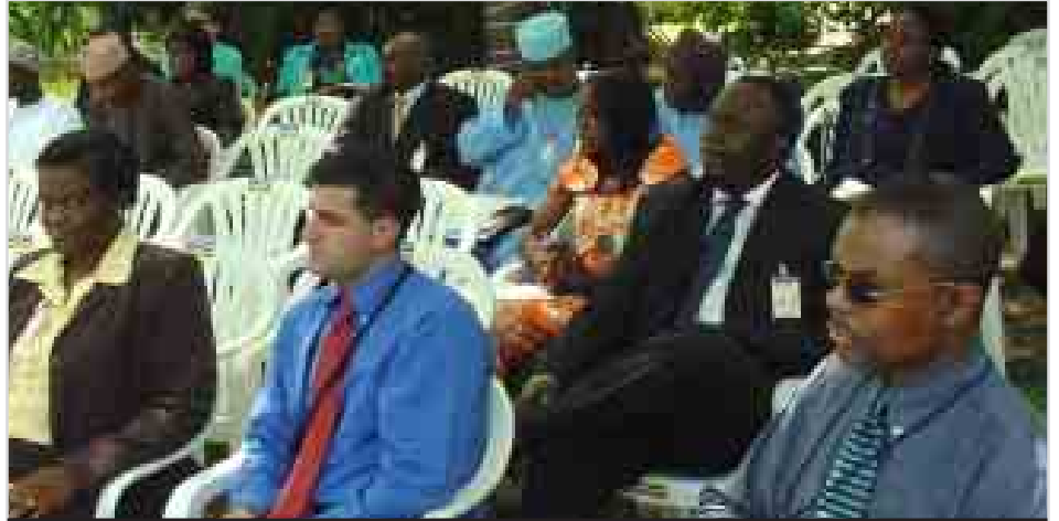
Wakilan kungiyoyi da ma'aikatu daga sassa dabam-daban da suka hallarci taron sa hannu a yarjejeniyar kafa dakunan karatu da nazari na Amirka a yankuna shida na Nijeriya.

Yau jama'a na yin amfani da na'urorin komfuta wajen yin hulfa da gudanar da ayyuka dabam-daban. Dakunan nazarin da Ofishin Jakadancin Amirka ya kafa, tun cikin 1992, sun zama wata hanyar karfafa harkokin diflomasiyya, hasali ma, irin waɗannan wuraren a Nijeriya, sun ƙara kawo fahimtar juna, a tsakanin Amirka da jama'ar Nijeriya, wajen waɗata masaniya game da Amirkar ta hanyoyi da dama, kamar litattafai da mujalloli da ƙasidu da faya-faye, da nufin mayar da hankali ga kwancitashin Kasar Amirka don amfanin jama'a. Da farko a garin Badun aka fara kafa wannan daki na nazari, a ranar 8 ga watan Yunin 2003, amma yau, akwai irinsa har goma, a garuruwan Badun da Bauci, da