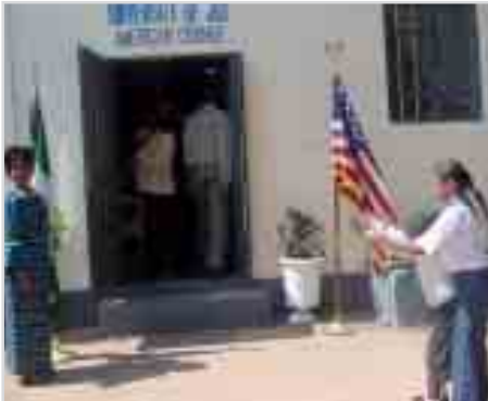
Dakin Nazari na Amirka da ke Jas, Jami'ar Jos, Titin Murtala Mohammed, kusa da Asibitin Koyarwa na Jami'ar Jos. Wayar Tarho, 0730-611928 ko 0803-5894100. Intanet: unijosamcorner@yahoo.com