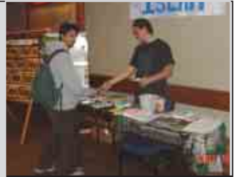
Dalibai a Jami'ar Michlin na kokarin rarraba kasidu domin wayar ma takwarorinsu kai game da harkokin addinin Musulunci.