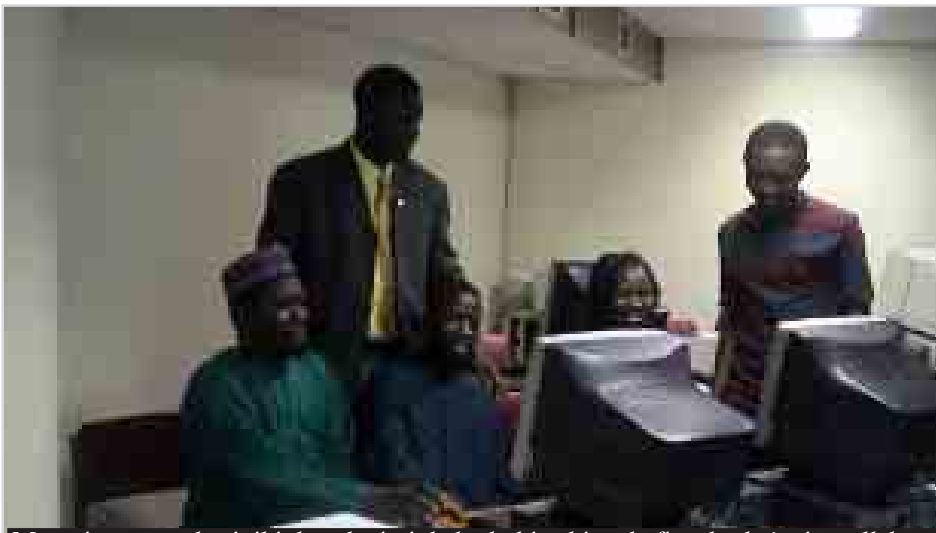
Masaniya game da ciniki da zuba jari da harkokin shige da ƙice da sha'anin tsallaka kan iyakoki, waɗansu al'amura ne da suke cikin zukan mafi yawan jama'ar Nijeriya.