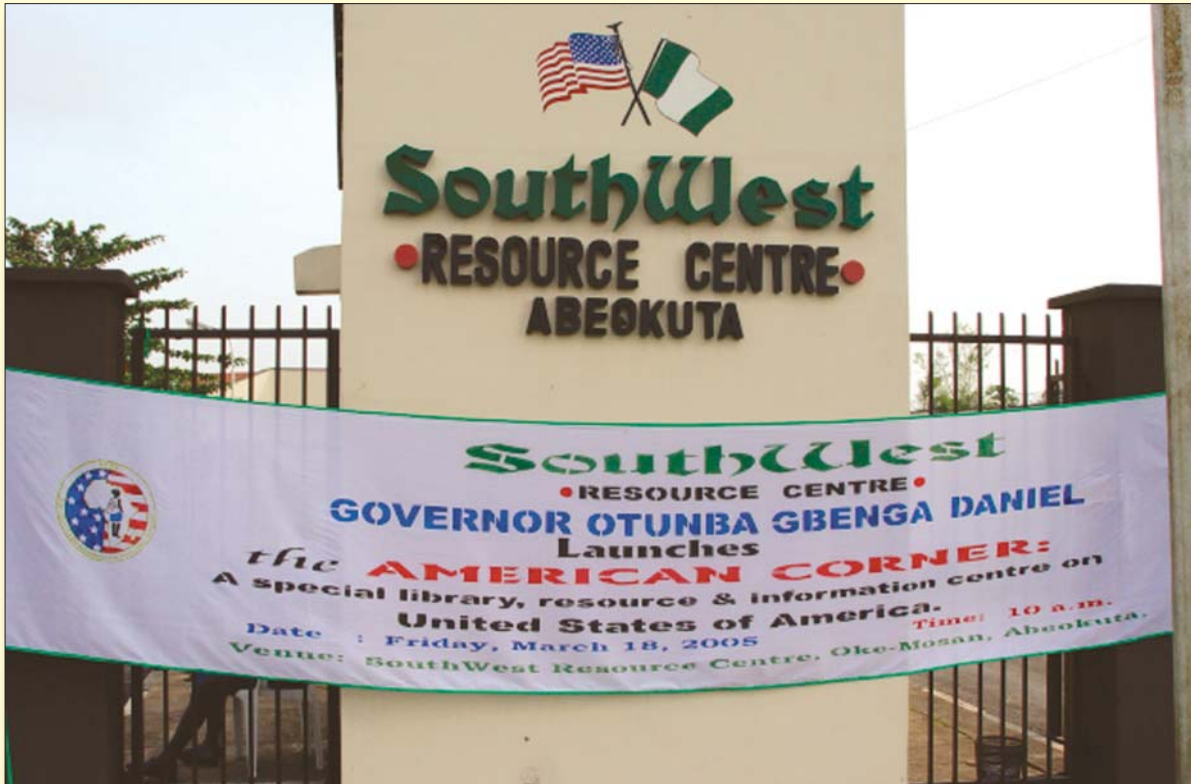
Sabon Dakin Karatu Da Nazari Na Amirka A Garin Abekuta A Kudu Maso Yammacin Nijeriya