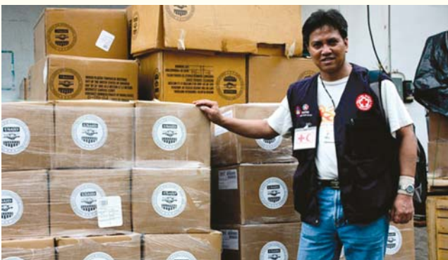
Kwalye cike da kayayyakin agaji da Hukumar Amirka ta USAID suka tura da farko zuwa Medan, a Kasar Indonesia.