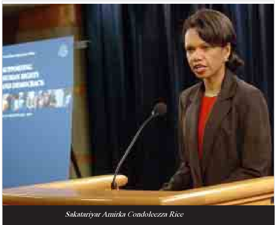
Sakatariyar Amirka Condoleezza Rice

Condoleezza Rice ita ce Mai Bayar da Shawarar Harkokin Tsaro na shekaru huɗu da Shugaba Bush ya fara yi. Shugaba Bush kuma ya zaɓe ta don maye gurbin da Colin L. Powell ya bari, na Sakataren Gwamnati. Powell babban aminin Condoleezza Rice ne. ■