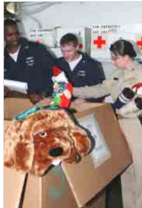
Sojojin Amirka na kokarin tattara kayayyakin wasannin yara da za a kai ma yara da wannan boren ruwan Tsunami ya yi wa barna.