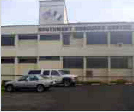
Dakin Nazari na Amirka da ke Abekuta, Shagunan Kudirat Abiola, IBB Boulevard, Oke-Mosan, Abekuta. Wayar tarho: 0803-727-0666, 0803-373-4789.

D akunan Karatu da Nazari na Amirka ne wuraren farko da suka kamata ka ziyarta, a duk lokacin da kake da wata tambaya game da Amirka. Manufar kowane dakin nazarin ita ce ta wadata ka da duk bayanin da kake bukata game da gwamnatin Amirka, ko wani abokin hulfa. Dimbin kayayyakin da ke waƙfannan dakunan nazari sun kunshi fannoni da dama da suka shafi Amirka da manufofinta da jama'a da ilimi da al'adu, duk a kyauta.