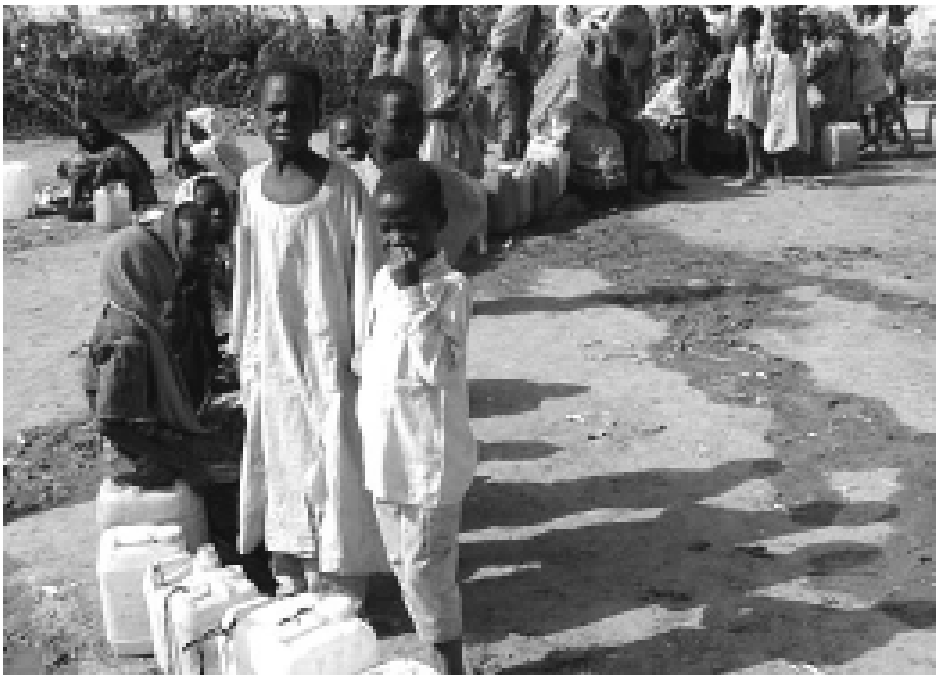
Yara 'yan asalin Sudan da ke zaman gudun hijira a Kasar Cadi.

A mirka za ta bayar da gudunmawar dalar Amirka miliyan 17 da dubu 800 ga Babban Kwamishinan Majalisar Dinkin Duniya a kan Harkokin 'Yan Gudun Hijirar Sudan da suka kaurace zuwa