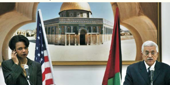
Sakatariya Condoleezza Rice da Shugaban Hukumar Falasdinawa, Mahmoud Abbas a wani taron manema labarai da suka kira a Yammacin Gaƙar garin Ramalla.