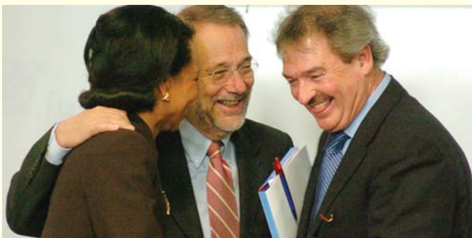
Tana raha da Babban Sakataren Kungiyar Tarrayan Turai, Javier Solana (tsakiya) da Shugaban Kungiyar, Jean Asselborn (a dama).