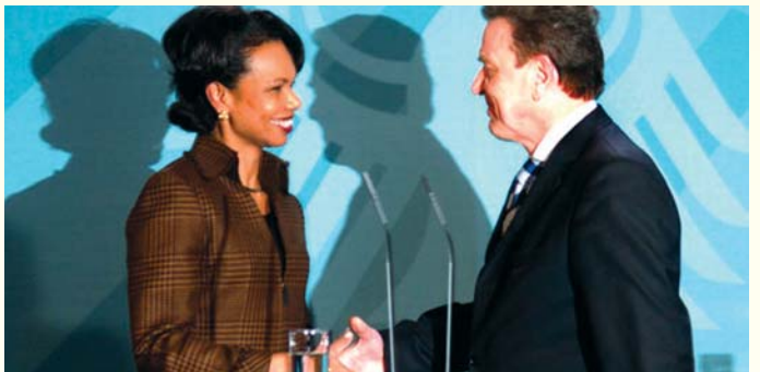
Da shugaban ƙasar Jamus, Gerhard Schroeder.