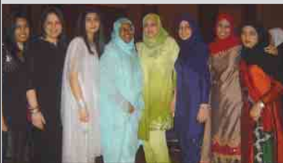
'Yammata, Musulmi, a jami'ar Michigan da ke Amirka na nunama takwarorinsu muhimmanci suturan Musulunci.