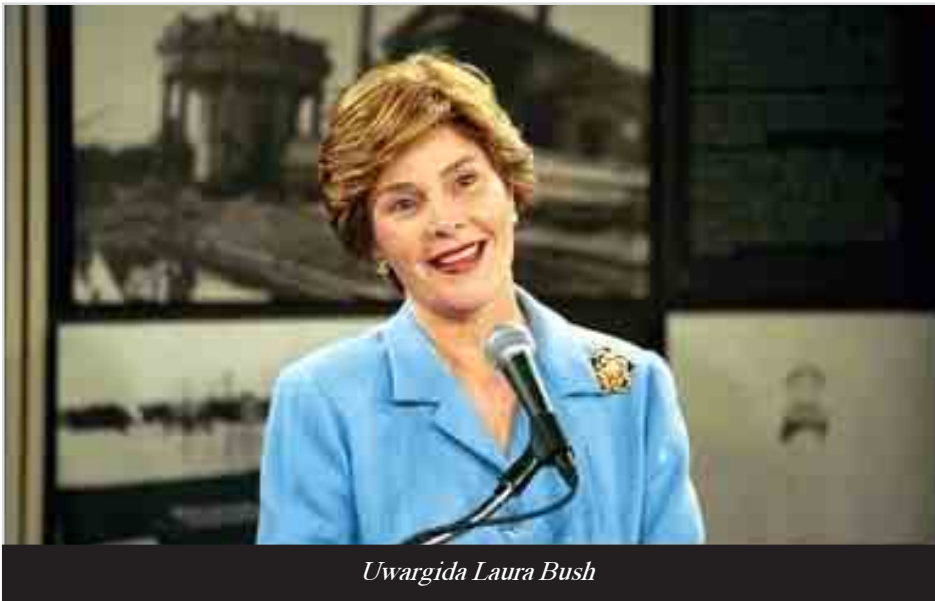
Uwargida Laura Bush

Shugaba Bush ya amince da a bai wa ci gaban ’yancin mata wani