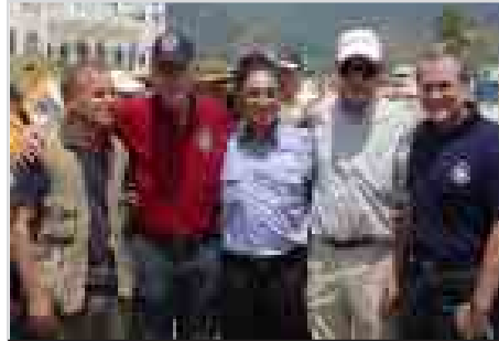
Tsofaffin Shugabannin Amirka, Bill Clinton (na biyu daga hagu) da George Bush (na biyu daga dama) a lokacin da suka ziyarci yankunan da ambaliyar tsunamin ta yi wa barna domin jajanta masu da kuma kara jawo hankali ga kawo masu taimako

nAn mayar da hankali ga taimakon gaggawa na abinci da sauran kayayyakin agaji da mafaka da ruwan sha da harkokin tsabtace muhalli da lafiya, da ilimi da kuɗaɗen gudanar da ayyuka da ceton rayuka