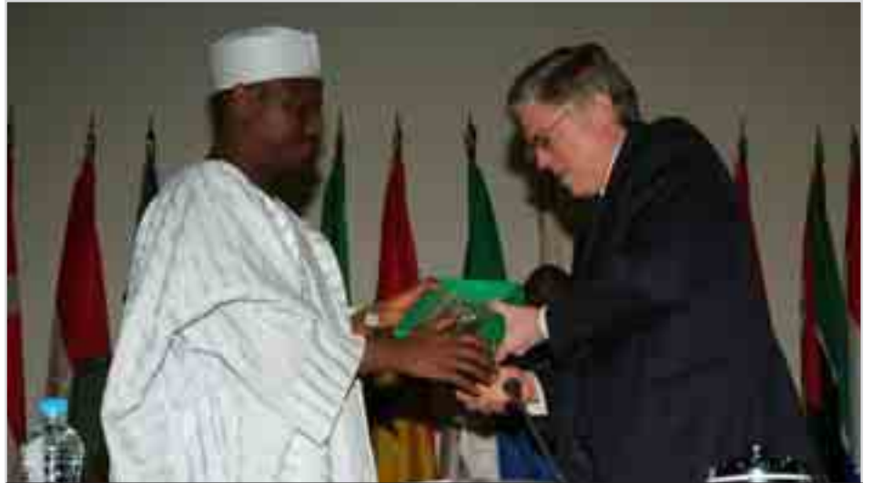
Ministan Tsaro, Dr. Rabiu Musa Kwankwaso ne, yake bada kyauta ma Jakadan Amirka a Nijeriya, Ambasada John Campbell bayan kammala wannan taro a Abuja.

Taron ƙara wa juna sanin ya bincika al’amura uku, kamar mai, a matsayin abin tanadi da gudanar da harkokin na mai da harkar tsaro da bunƙasa tanadin dabarun samar da