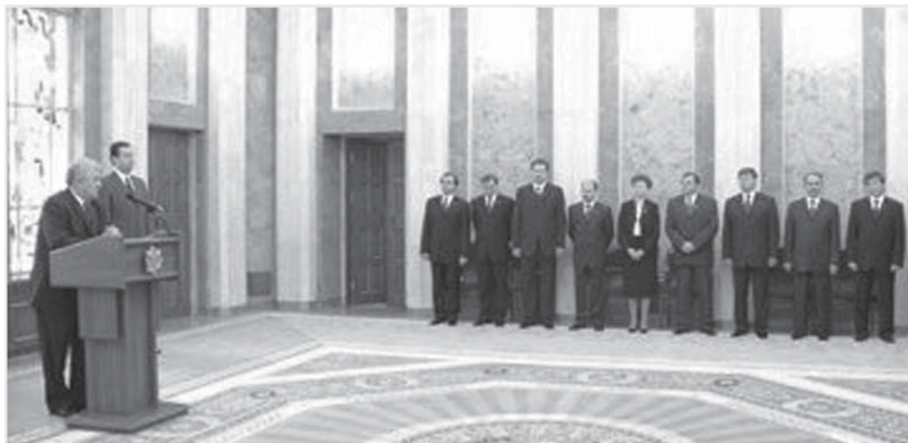
Un Guvern nou - pentru o democrație nouă

SUA a adus experți media pentru a participa la conferințe și seminare destinate îmbunătățirii capacităților profesioniștilor și studenților moldoveni din domeniul mass-media. SUA au continuat și susținerea unui parteneriat de trei ani între Facultatea de Jurnalism a Universității de Stat din Moldova, Centrul Independent de Jurnalism și Școala de Jurnalism din Missouri, în scopul îmbunătățirii procesului de studii în jurnalism.