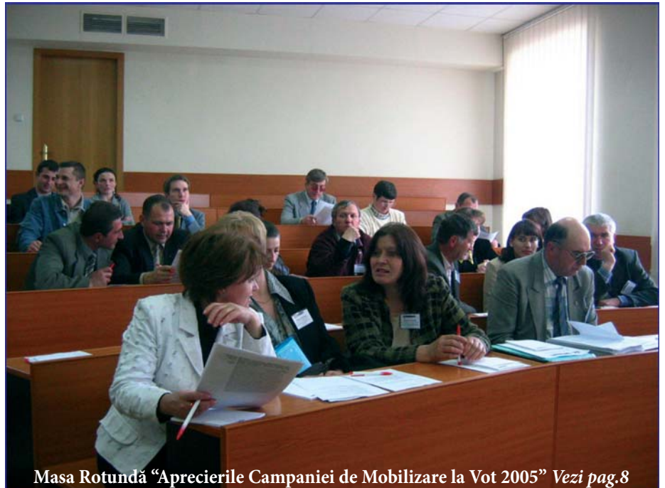
Masa Rotundă “Aprecierile Campaniei de Mobilizare la Vot 2005” Vezi pag.8