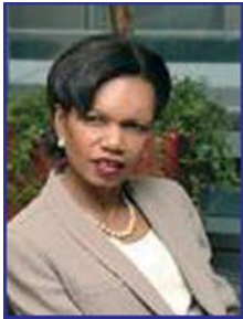
Condoleezza Rice, Secretar de Stat