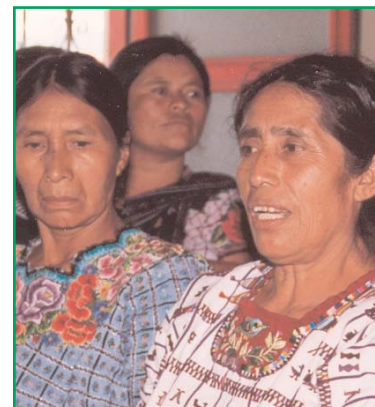
Mulheres de Rxiin Tnamet.