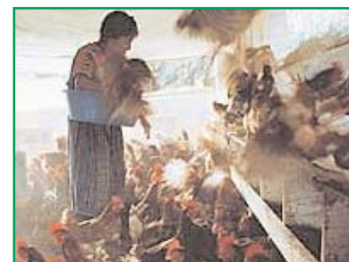
Cokadi - criação de galinhas

A Asociación de Mujeres Indígenas para el Desarrollo Integral (AMIDI), grupo de base rural-guatemalteca apoiado pela Coordinadora Kaqchikel de Desarrollo Integral (Cokadi), donatária da IAF, foi reconhecida por sua criatividade na preparação de alimentos com ovos e uso de métodos de produção orgânica para criar galinhas. Slow Food , movimento internacional com sede em Turin, Itália, com mais de 60.000 membros, escolheu a AMIDI entre 300 candidatos do mundo todo. A Slow Food , assim chamada por sua filosofia a respeito de alimentos, promove o respeito pelo meio ambiente e biodiversidade de cultivos "do solo à panela e à mesa." Para obter informações mais detalhadas sobre a Slow Food , favor consultar o website www.slow-food.com .