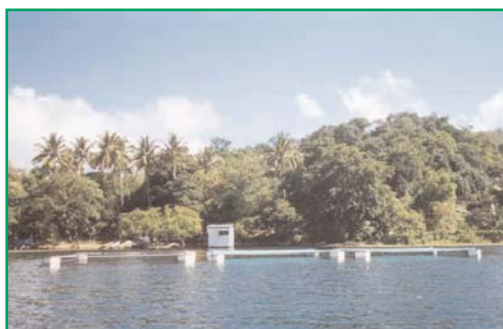
Lago Llopango em El Salvador.

Agencia de Desarrollo Local para Los Municipios de Llopango, Soyapango e San Martín (ADEMISS), donatária da IAF, está combatendo problemas de pobreza e poluição numa área densamente povoada na área circunjacente ao Lago Llopango, em El Salvador. A poluição é um problema real que causa doenças intestinais e altas taxas de mortalidade infantil. Não se pode pesar com lucro, nadar confortavelmente ou convidar turistas para visitar o local, limitando assim a geração de renda na área.