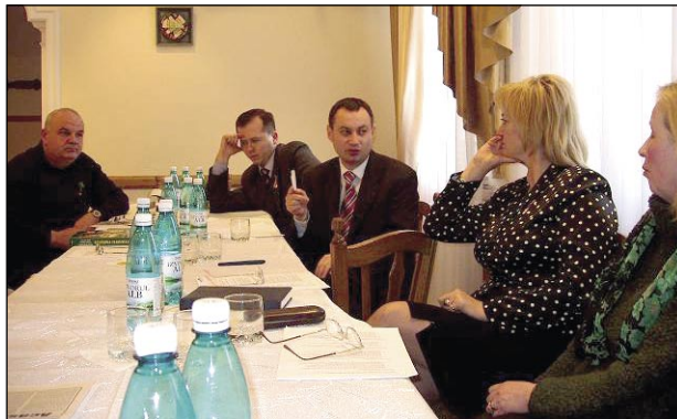
Absolvenții discută despre viitorul turismului rural în Moldova

Pornind de la aceste premise, turismul rural a început să fie privit ca o posibilitate concretă de dezvoltare a localităților rurale, inclusiv pentru zonele defavorizate. Acest gen de petrecere a timpului liber permite valorificarea unui bogat potențial natural și antropoc, desconggestionarea zonelor turistice aglomerate, îmbunătățirea nivelului de trai al populației de la sate, stabilizarea forței de muncă prin crearea de noi locuri de muncă în do-