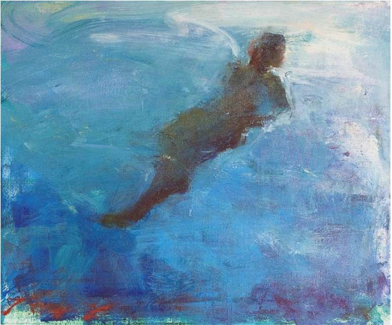
Floating , 2005. Oil on canvas, 20 x 24 in. Επιπλέοντας , 2005. Λάδι σε καμβά, 50,8 x 61 εκ.