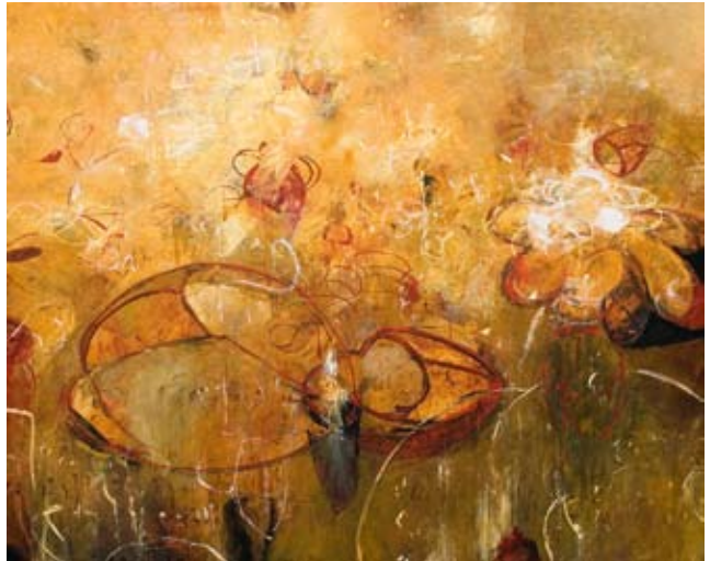
Toroids of Apollonius 02, 2008 Acrylic on canvas, 48 x 60 in. Courtesy of the artist, Seattle, Washington, and Winston Wachter Fine Art, Seattle, Washington, and New York, New York

Δακτυλιοειδείς πλάκες του Απολλώνιου 01, 2008 Ακρυλικό σε καμβά, 121,9 x 152,4 εκ. Ευγενική παραχώρηση του καλλιτέχνη, Σιάτλ, Ουάσινγκτον και της Σχολής Καλών Τεχνών Γουίτσον Γουάτσερ, Σιάτλ, Ουάσινγκτον και της πόλης της Νέας Υόρκης