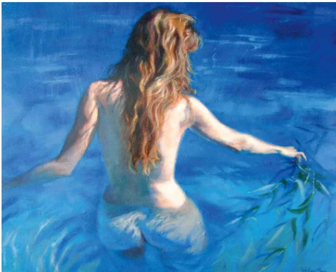
Ophelia , 2007. Oil on canvas, 24 x 30 in. Οφηλία , 2007. Λάδι σε καμβά, 61 x 76,2 εκ.