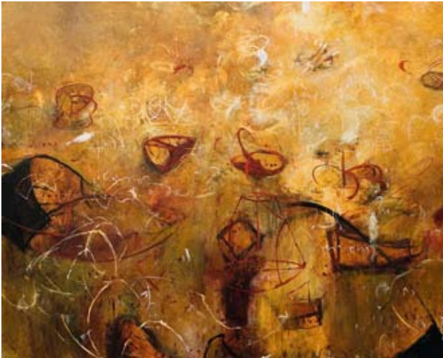
Toroids of Apollonius 01, 2008 Acrylic on canvas, 48 x 60 in.

Δακτυλιοειδείς πλάκες του Απολλώνιου 01, 2008 Ακρυλικό σε καμβά, 121,9 x 152,4 εκ.