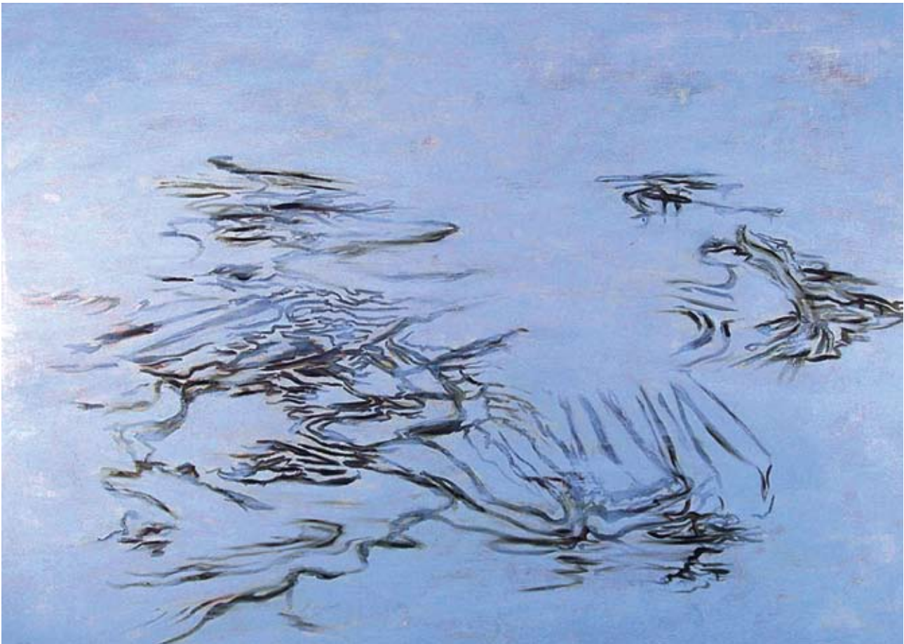
Tidal Script , 2005. Oil on panel, 31 x 43 in. Παλίρροια , 2005. Ελαιογραφία, 78,7 x 109,2 εκ.