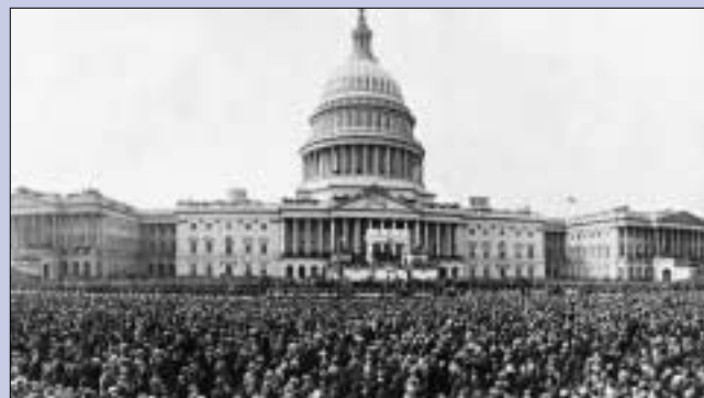
A partire dal 1801, gli insediamenti dei presidenti si sono sempre celebrati nel Campidoglio. Questo è l'insediamento di Calvin Coolidge nel 1925 (in alto).