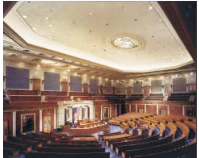
L'aula della Camera dei Deputati.

La Camera dei Rappresentanti, dopo una legge approvata nel 1911, è limitata a 435 membri. Ad ogni stato è assegnato un numero di deputati proporzionale alla rispettiva popolazione, che viene ricalcolata con censimenti a cadenza decennale. Ogni stato ha diritto ad almeno un deputato. Qualora un deputato muoia o si