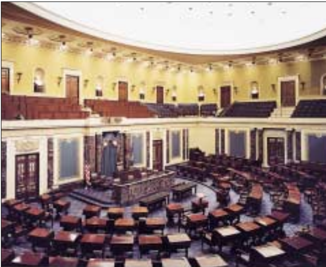
L'aula del Senato.

Il Senato è composto da cento membri, due per ciascuno stato. I senatori devono avere compiuto trent'anni, essere residenti nello stato che li elegge e cittadini statunitensi da almeno nove anni. Il loro mandato dura sei anni ed un terzo dei membri viene eletto ogni due anni.