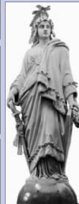
La Statua della Libertà alla sommità della cupola (in alto).