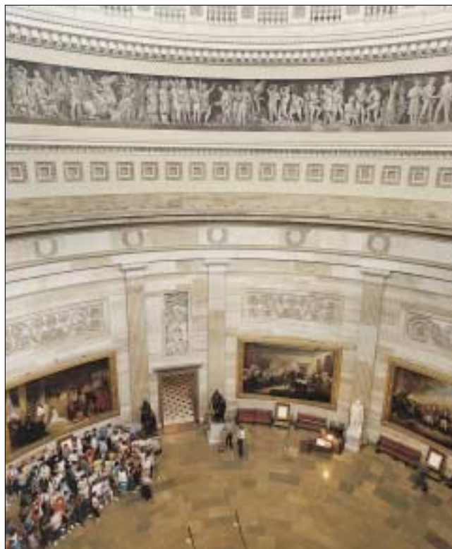
La Rotonda rappresenta un momento particolare della visita al Campidoglio.

I visitatori sono benvenuti al Campidoglio per ammirare le opere d'arte e le sale storiche, soffermarsi nelle gallerie delle due camere e visitare gli uffici dei propri senatori e rappresentanti. Il Congresso è fiero di mantenere al minimo le restrizioni ai visitatori dell'edificio capitolino. Il Campidoglio è aperto sette giorni alla settimana, eccetto il Giorno del Ringraziamento, Natale e Capodanno. Telefonando al (202) 225-6827 si ottengono gli orari delle visite ed informazioni sulle visite con guida. Per accedere alle gallerie delle aule durante lo svolgimento delle sedute del Senato e della Camera è necessario ottenere un biglietto (gratuito). I visitatori stranieri possono ottenerlo per la Camera dei Rappresentanti al banco degli appuntamenti della Camera situato al piano terra, e per il Senato al banco degli appuntamenti del Senato, sempre al pianterreno. Il Congressional Special Services Office (Ufficio Servizi Speciali del Congresso) situato nell'area centrale al pianterreno, denominata Cripta, offre visite guidate ed assistenza per i disabili: per informazioni sulle visite si prega chiamare il (202) 224-4048.