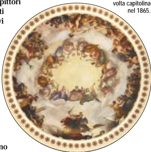
Constantino Brumidi dipinse l' Apoteosi di Washington nella volta capitolina nel 1865.

Aiuta a preservare i tesori artistici capitolini per le future generazioni: osserva e apprezza i dipinti e le sculture, ma non toccarli .