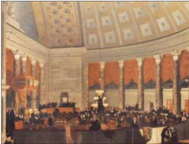
L'Aula Vecchia della Camera dei Deputati, come appare nel dipinto di Samuel F.B. Morse della Galleria d'arte Corcoran.

pietra arenaria era ancora in fase di completamento. Il Congresso s'installò nell'ala nord, non molto spaziosa. All'inizio, la Camera si riuniva in un salone al secondo piano, destinato alla Biblioteca del Congresso, mentre il Senato si riuniva in un'aula del piano terra, che ora infatti si chiama Aula Vecchia del Senato.