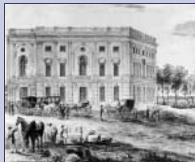
Una veduta del Campidoglio nel 1800 con soltanto l'ala nord completata (a sinistra).