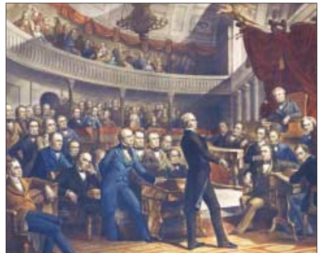
Il senatore Henry Clay pronuncia un discorso a favore del Compromesso del 1850 nell'Aula Vecchia del Senato.

Il Campidoglio fu originariamente progettato dal Dott. William Thornton e fu il Presidente George Washington a posare la prima pietra per la sua costruzione il 18 settembre 1793. Tra i vari architetti che diressero le fasi originali dei lavori, ricordiamo Benjamin Henry Latrobe e Charles Bulfinch. Nel 1800, quando il governo si trasferì a Washington nel Distretto di Columbia dalla capitale temporanea di Filadelfia, l'edificio capitolino in mattoni e