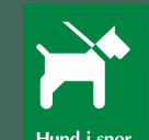
Hund i snor