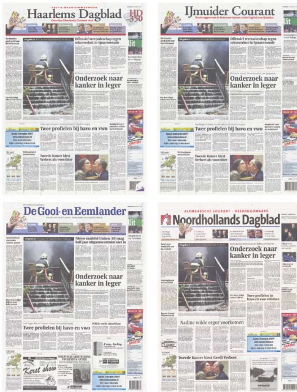
Figuur 7.1 Kernkrant: HDC-dagbladen

onderling alleen nog door een enkel regionaal bericht op de voorpagina en afzonderlijke pagina's met regionaal nieuws. Met ingang van deze rapportage telt de Monitor naast het aantal titels voortaan óók het aantal kernkranten, als unieke redactionele product-eenheden voor bovenregionaal nieuws.