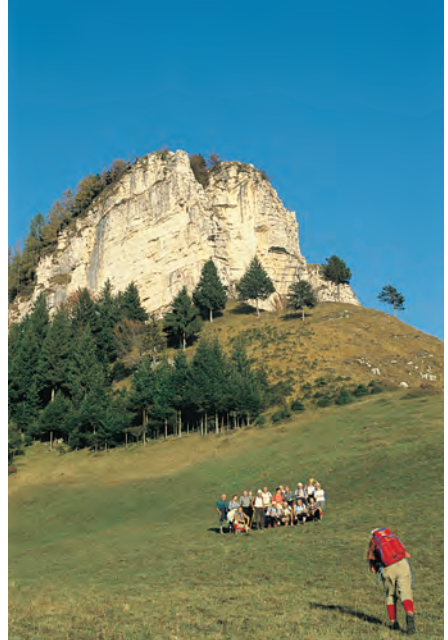
Sentiero Gruppo Sella Lorenzini: in gita a Lazer - Feit

Qui, il tardo autunno del 1943 ha offerto alla memoria uno scenario di violenza e di sangue: il sentiero di Pratolungo si raggiunge risalendo l'erta scoscesa del monte S. Giovanni di Terzano o ripercorrendo la strada che dall'abitato di