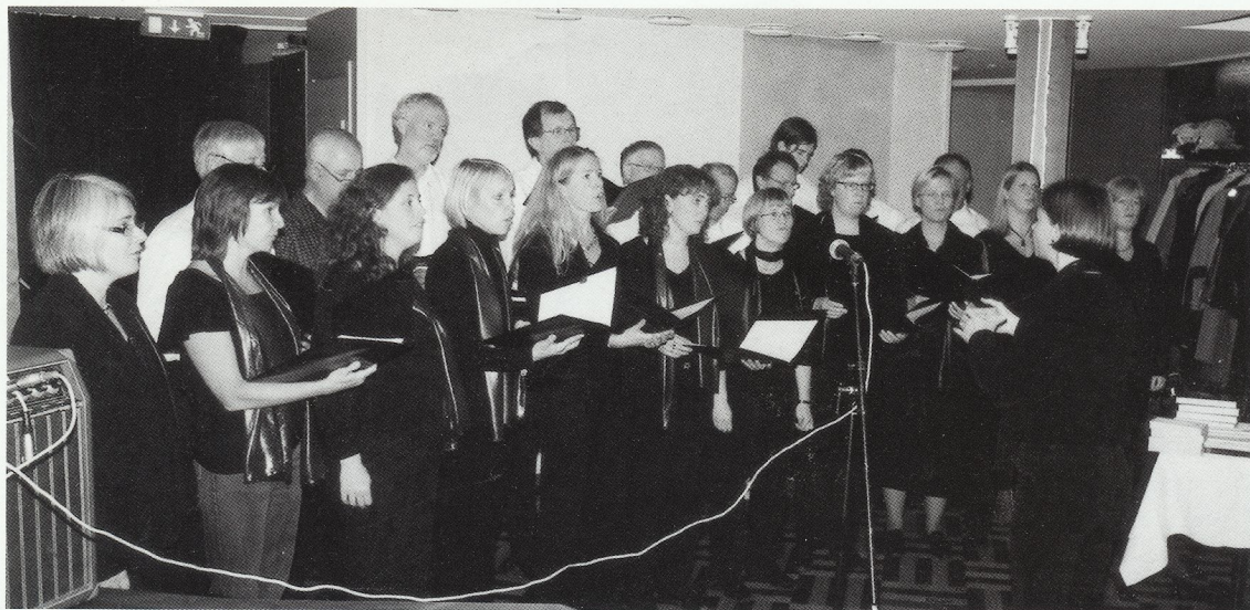
Kören Akva Vera från Lidingö inledde kvällen.