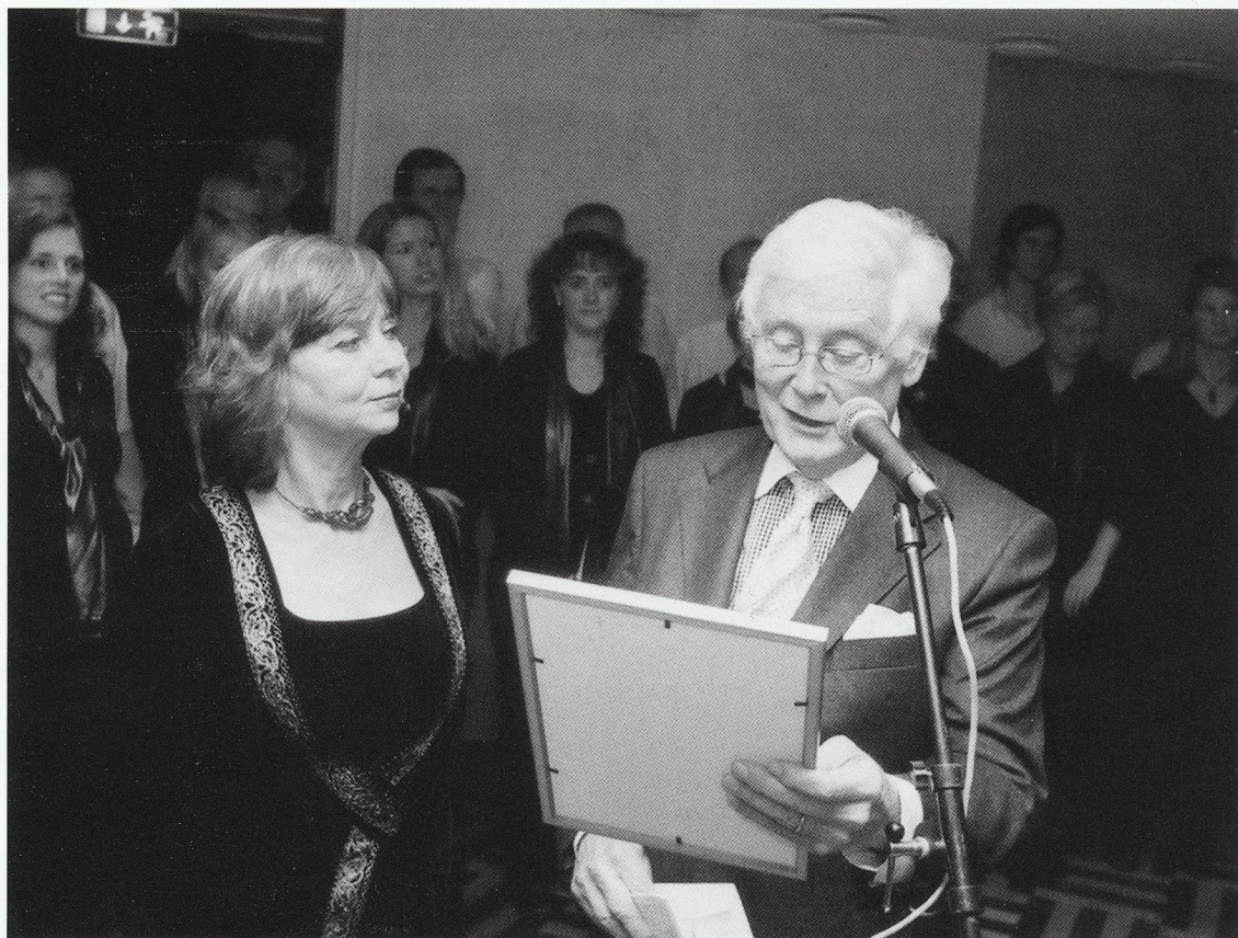
Ordföranden Jan Mårtenson läser motiveringen till Ferlinpriset på diplommet för Ylva Eggehorn.