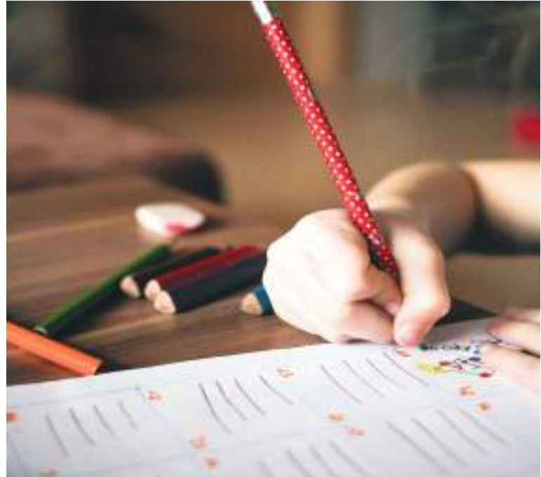
Určite si s deťmi čas na učenie.

Mnohé deti sa z voľna najskôr možno tešili, pretože nemuseli vstávať do školy. Dnes je to už iné a preto je dobré, aby sme deťom v tejto mimoriadnej situácii dali aspoň základný režim. „S deťmi sa deň vopred dohodnite, čo vás bude čakať na ďalší deň, kedy budete vstávať,