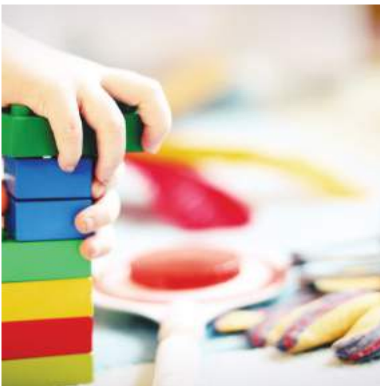
Naplánujte si s deťmi voľnočasové aktivity.

Informácie poskytol Výskumný ústav detskej psychológie a patopsychológie STRANU PRIPRAVILA: RENÁTA KOPÁČOVÁ