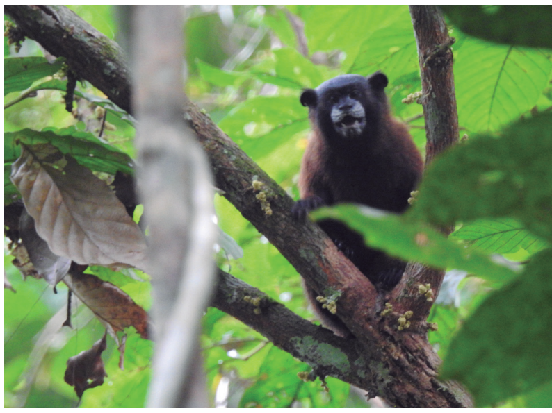
MICO BEBELECHE Leontocebus fuscus

PARA EL MONITOREO COMUNITARIO PARTICIPATIVO EN EL NÚCLEO MONONGUETE Y EL RESGUARDO INDÍGENA INGA DE NIÑERAS (SOLANO, CAQUETÁ).