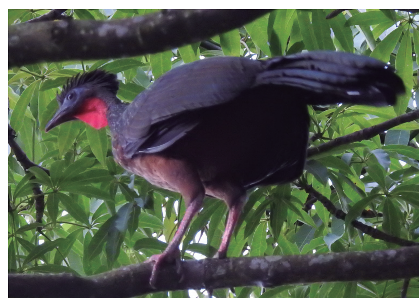
PAVA TARRO Penelope jacquacu

Puedes compartir tus observaciones escritas en físico al promotor ambiental de su vereda o a través del correo electrónico: promotoresambientales20@gmail.com