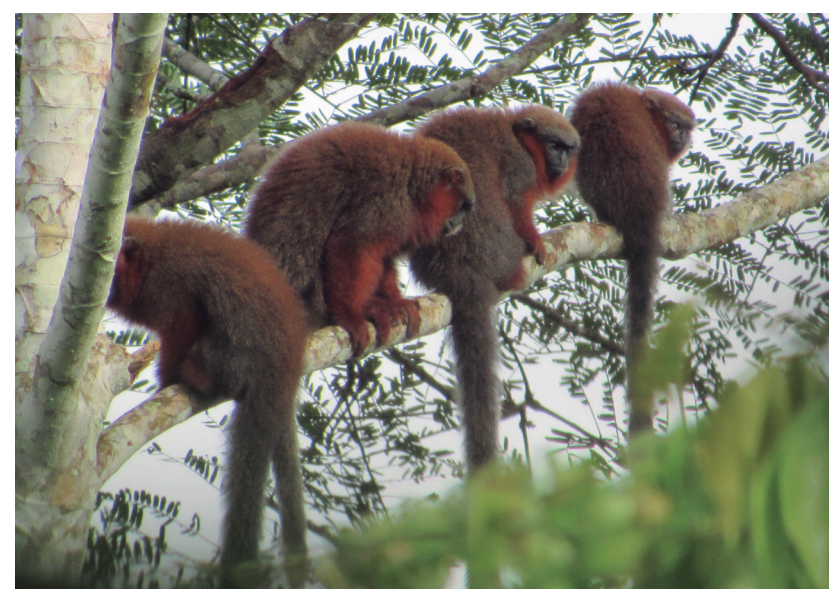
MICO CAQUETENSIS Plecturocebus caquetensis