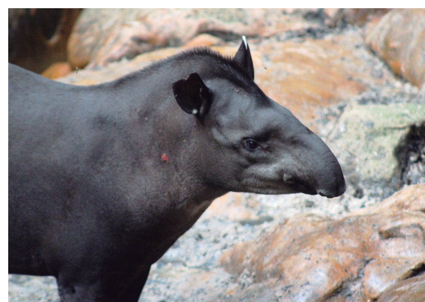
DANTA Tapirus terrestris