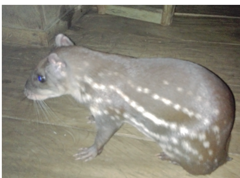
Boruga Cuniculus paca