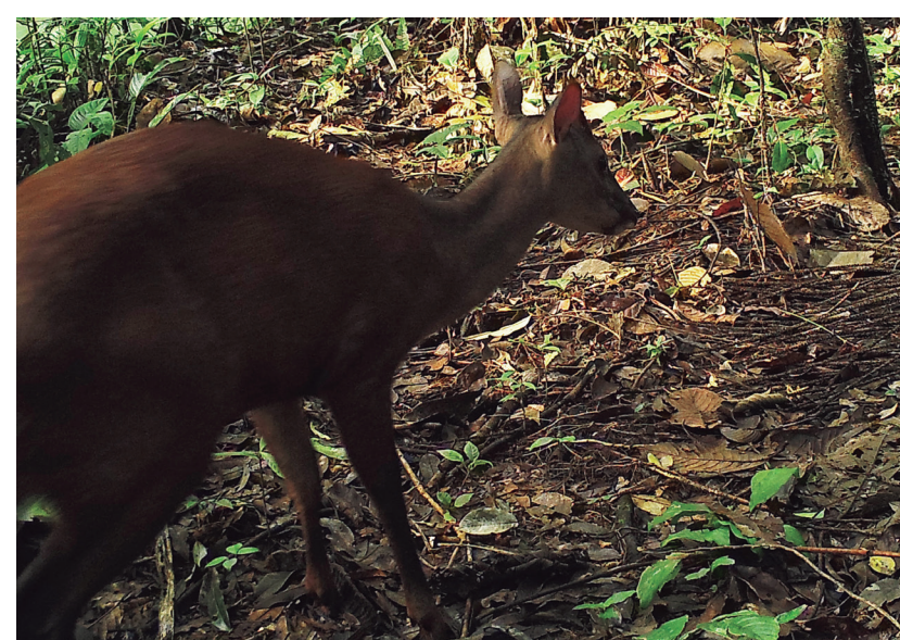
VENADO COLORADO Mazama americana