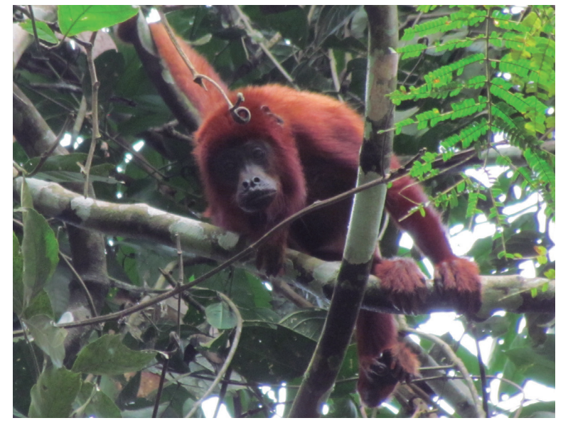
MICO MONO BOMBO Alouatta seniculus