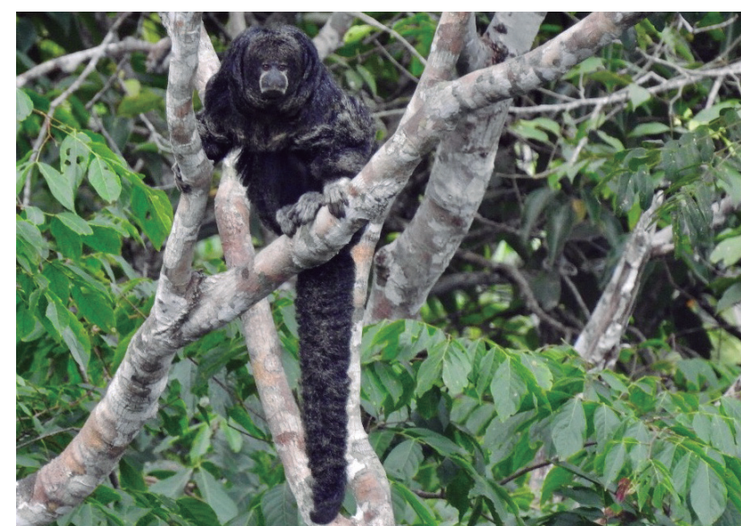
MICO VOLADOR Pithecia milleri