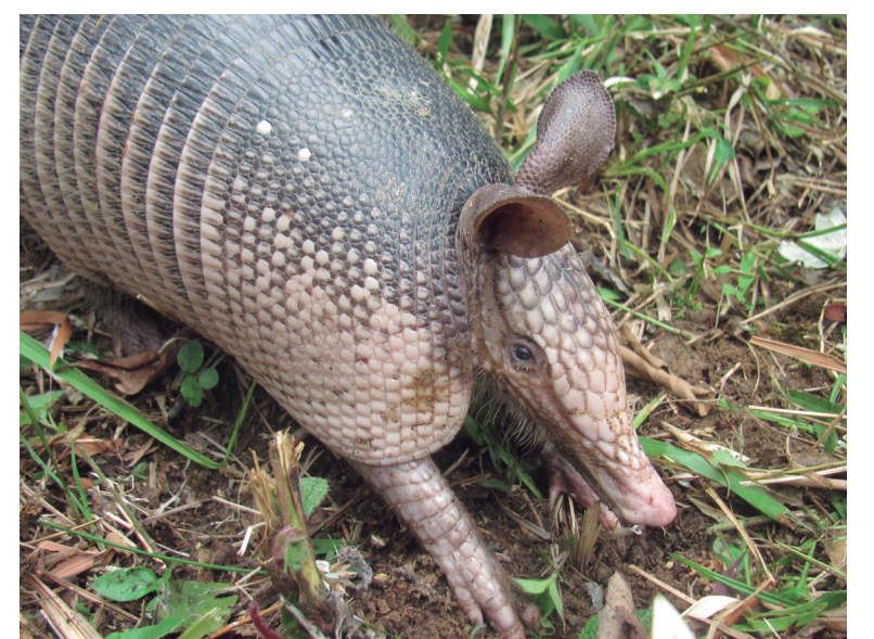
GURRE COMÚN Dasypus novemcinctus