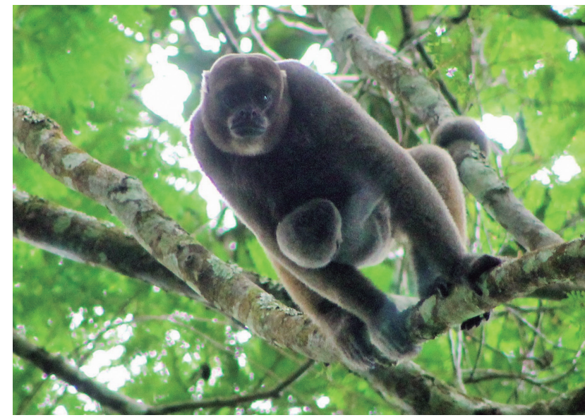
MICO CHURUCO Lagothrix lagothricha lagothricha