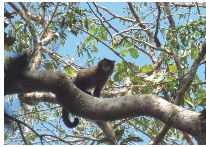
MICO MAICERO Sapajus apella