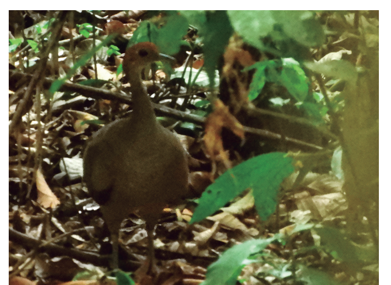
GALLINETA COMÚN Tinamus major