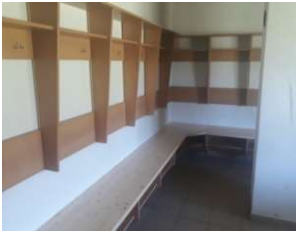
Nové vybavení šaten