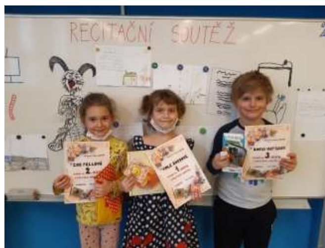
Recitační soutěž v ZŠ