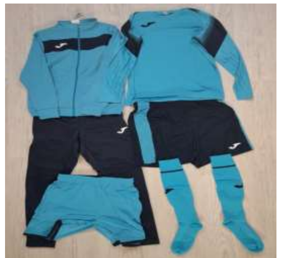
Dres a oblečení pro brankáře přípravy