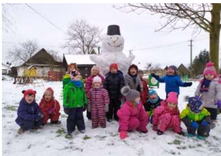
Zimní radovánky v MŠ

naši dostali domů k vypracování pracovní listy z různých oblastí rozvoje a jednou týdně se na jednu hodinu připojují s paní učitelkou online, aby udrželi sociální kontakt se školkou a hlavně s kamarády. Distanční výuku bereme jako novou výzvu, příležitost vyzkoušet si různé metody, rozvíjet se v oblasti ICT, vidět se častěji se spolužáky ze zahraničí, ale (dle mého názoru) nenahrazuje plnohodnotně prezenční výuku v prostředí školy. Doufáme, že současná nařízení a opatření budou ku prospěchu, epidemiologická situace u nás se zlepší a my se budeme moci brzy vrátit do školy k učení i k realizaci akcí, které nás těší a k naší škole neodmyslitelně patří.