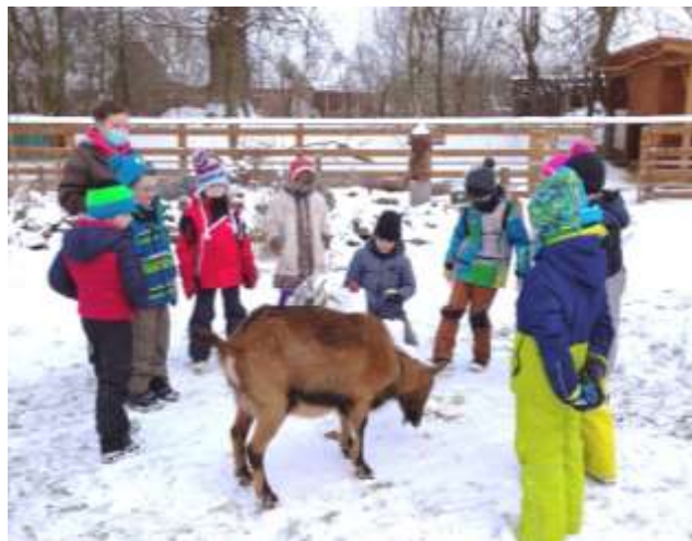
Zimní radovánky na zahradě

V měsíci únoru jsme obdrželi drobné ceny a hlavně certifikát „ Světové školy “, který naši školu opravňuje tento titul používat. I v letošním roce jsme se začali globálním problémům světa věnovat. Žáci nyní doma kreslí obrázky zvířátek ze statku, podle kterých chceme tisknout na naší 3D tiskárně vykrajovátka. Uvidíme, jestli se nám podaří prodejem perníčků a vykrajovátek vydělat si na koupi „Skutečného dárku – veselé kozy“ pro jednu chudou rodinu ve světě. ( https://www.skutecnydarek.cz/p/vesela-koza/ )