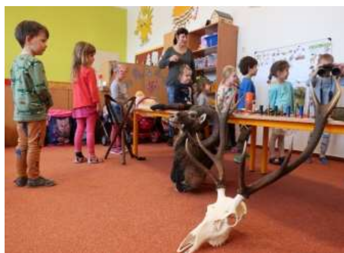
Projektový den v MŠ „Co se děje v lese“