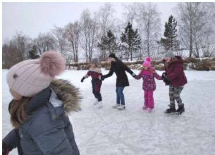
Bruslení na rybníku

Po delší době tuto zimu napadlo hodně sněhu, a tak jsme si hlavně v rámci hodin tělesné výchovy (které jsou ve vnitřních prostorách také zakázány) a ve školní družině mohli užít zimní radovánky: koulování, bobování či bruslení na místním rybníku.