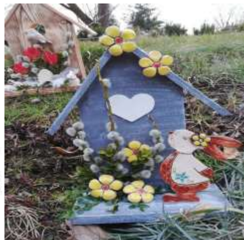
Ukázka výrobků z choryňského kláštera