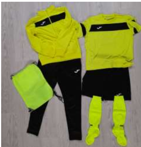
Dres a oblečení pro přípravku a žáky