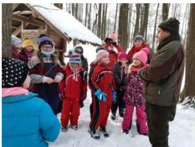
Projektový den „Les“

Žáci ZŠ měli běžné vyučování zpestřeno ještě např. „Palačinkovým dnem“, kdy si vyzkoušeli palačinky také připravit či školním kolem „Recitační soutěže“.