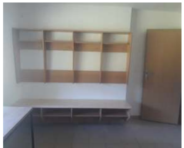
Nové vybavení šaten