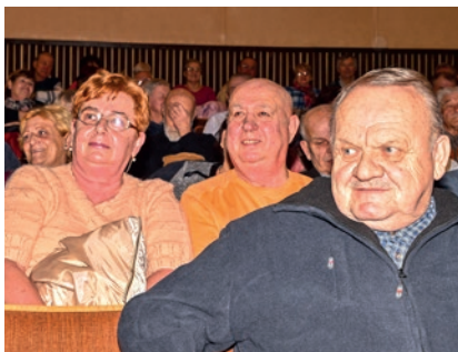
Účastníci akce Setkání s pamětníky

V letošním roce komise ve spolupráci s městem připravuje další akce. Začátkem března proběhlo v kině druhé setkání s pamětníky. Promítaly se staré filmy ze života a dění v Paskově. Nahlédli jsme také do soukromého