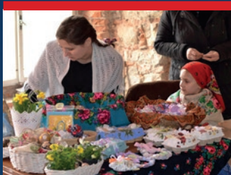
Velikonoční jarmark najdete v kalendáři na str. 15–18