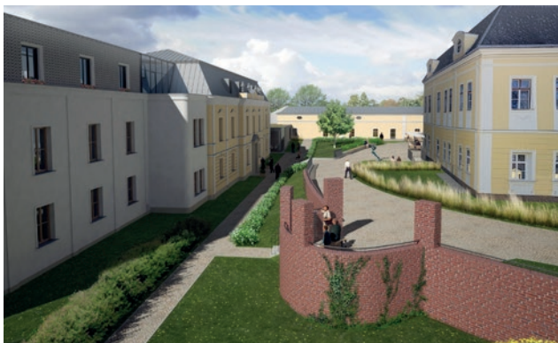
Vizualizace vzhledu po demolici objektu ozařoven