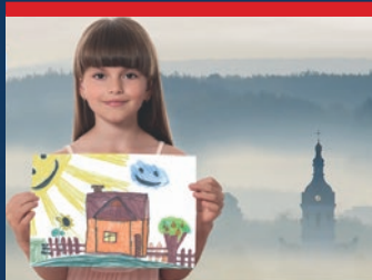
Kotlíkové dotace čtěte na str. 5