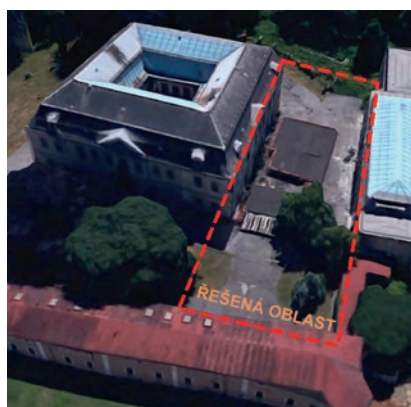
Vyznačení projednávané oblasti