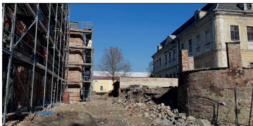
Aktuální vzhled staveniště