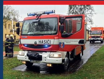
Hasiči informují čtěte na str. 27