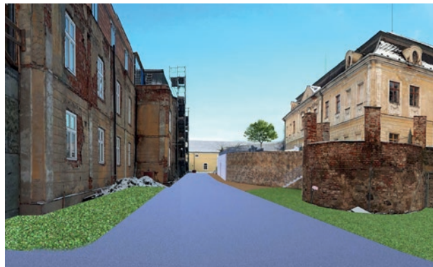
Vizualizace vzhledu při zachování objektu ozařoven