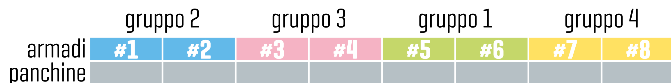
ESEMPIO A - passaggio centrale comune alle due file