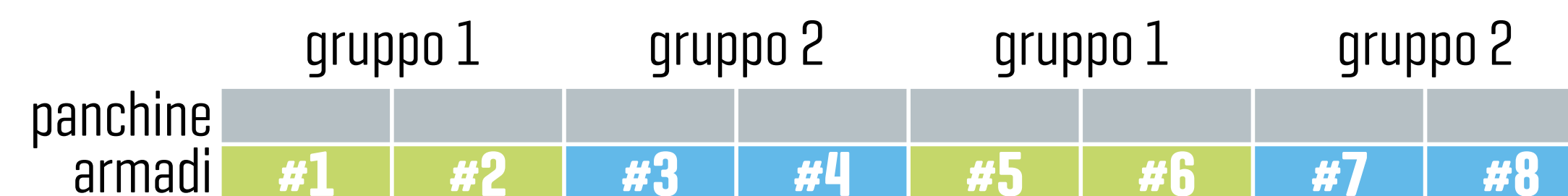
ESEMPIO B - passaggio per singola fila