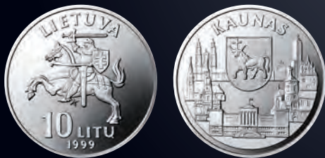
10 litų moneta, skirta Kaunui (iš serijos „Lietuvos miestai“)

Monetos briaunoje: LAISVAS BŪDAMAS, LAISVĖS NEIŠSIŽADĖSI Monetos dailininkas Rimantas Eidėjus Vario ir nikelio lydinys Cu/Ni. Kokybė „proof“ Skersmuo 28,70 mm. Masė 13,15 g. Tiražas 7 500 vnt. Išleista 1999 m. Baigta platinti 2004 m. Išplatinta 6 028 vnt.