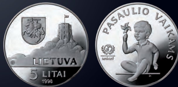
5 litų moneta (Jungtinių Tautų vaikų fondo (UNICEF) tarptautinė monetų programa „Pasaulio vaikai“)

Monetos briaunoje: LIETUVOS BANKAS Monetos dailininkas Antanas Žukauskas Sidabras Ag 925. Kokybė „proof“ Skersmuo 38,61 mm. Masė 28,28 g Tiražas 3 000 vnt. Išleista 1998 m. Išplatinta 3 000 vnt.