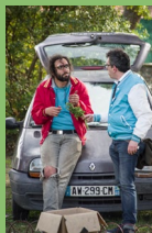
Compagnie l'Arbre à vache