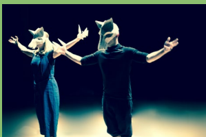
Compagnie du Réfectoire