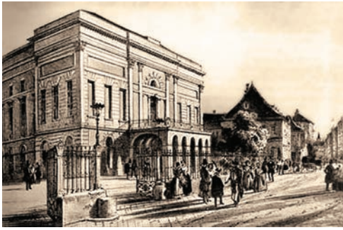
A Pesti Magyar Színház épülete 1837-ben ■ Milyen stílusú az épület?