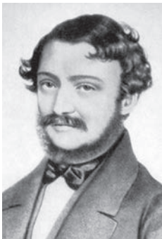
Erkel Ferenc 1845-ben ■ Évekig együtt dolgozott a Szózat zeneszerzőjével. Ki volt ő?

klasszicista stílus: művészeti irányzat, amely a klasszikus ókori épületeket és romokat tekintette követendő példának