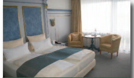
In schönen Zimmern wohlfühlen