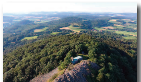
3.6 Die Milseburg, „Perle der Rhön“ Sage vom Riesen Mils, Ritter Gangolf und dem Teufel