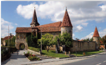
2.5 Kirchenburg Ostheim Die größte und schönste Kirchenburg Deutschlands