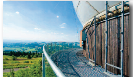
3.3 Radom - Bis 1998 Radarstation Leitzentrale der Rosinenbomber (Berlinblockade)