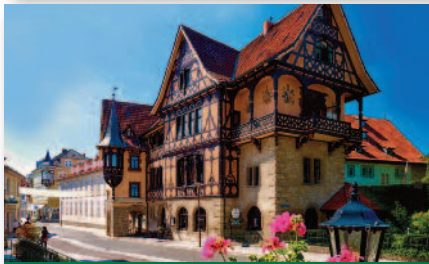
2.4 „Henneberger Haus“ Rhönküche