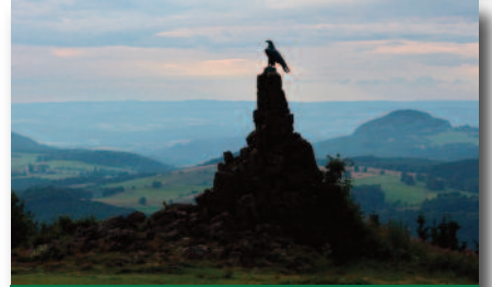
3.2 Fliedgerdenkmal auf dem Wasserkuppenareal