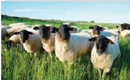
5.5 Das berühmte Rhönschaf