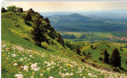
5.4 Ibengarten / Wiesenthaler Schweiz