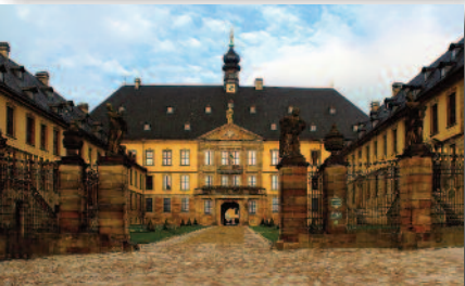
4.5 Stadtschloss Schönstes Barockschloss Hessens