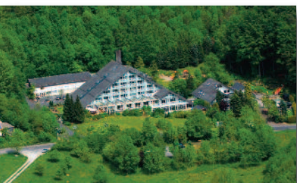
1.6 ★★★★★ Rhön-Garden Lukulltour-Domizil vom 18.-22.Oktober