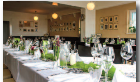
3.4 „Peterchens Mondfahrt“ Rhönküche