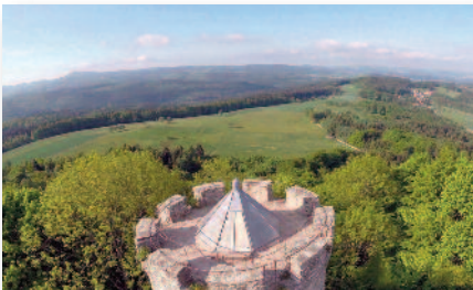
4.1 Ebersburg Der Turm der schönsten Burgruine der Rhön