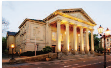
2.1 Musenhof Meiningen Wiege des Naturalismus