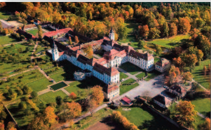
1.5 Schloss Fasanerie Schönstes Barockschloss Hessens