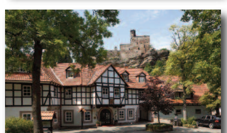
„Wenn die Zeit reicht“ gibt's auf der Rückfahrt noch eine Kaffeepause...