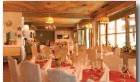
Hier werden wir am Abend Leckeres aus Küche und Keller probieren