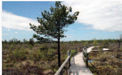
5.1 Schwarzes Moor - eines der bedeutendsten Moore Mitteleuropas - UNESCO Biosphärenreservat