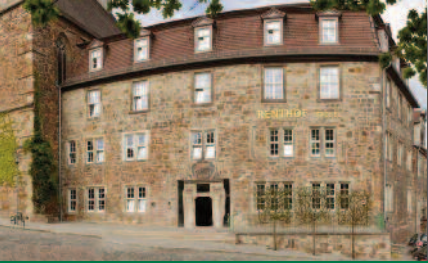
1.2 Renthof Kassel Frühstück vom Feinsten