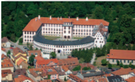
2.3 Das Meiningen Schloss Elisabethenburg