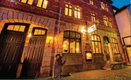
4.2 „Zum Ritter“ Fulda Manufaktur für feine Speisen - Rhönküche