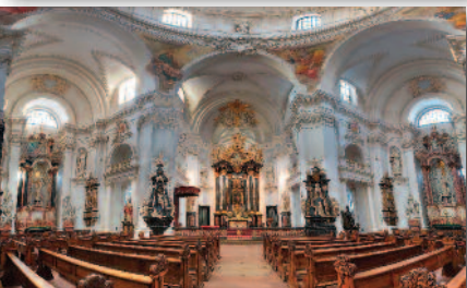
4.4 Der Dom