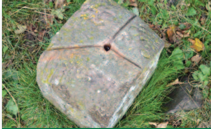
5.2 Das Dreiländereck Bayer, Hessen, Thüringen Friedrich von Schiller und Richard Strauss