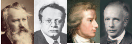
2.2 Auf den Spuren von Johannes Brahms, Max Reger, Friedrich von Schiller und Richard Strauss