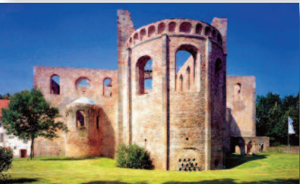
1.3 Führung durch die Festspielstadt Bad Hersfeld Größte romanische Kirchenruine Europas