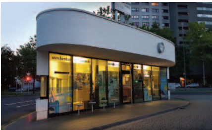
1.1 Abfahrt 18.10. / Ankunft 22.10. Bus-Terminal Braunschweig