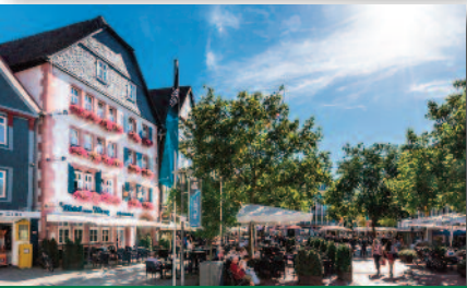
1.4 Romantik-Hotel „Zum Stern“ Rhönküche