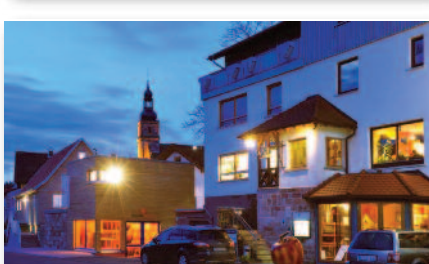
5.5 „Krenzers Rhön“ Abschlussleckereien aus Küche & Keller