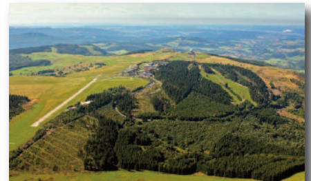
3.1 Wasserkuppe 950,2m - höchster Berg der Rhön Aussicht auf Rothaargebirge und Taunus