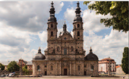
4.3 Der Dom St. Salvator - Bischofskirche Hessens bedeutendste Barockkirche