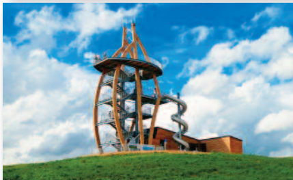
5.3 Noahs Segel / der Hochrhöner