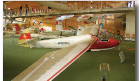
3.4 Das Deutsche Segelfluggmuseum Das größte dieser Art auf der Welt