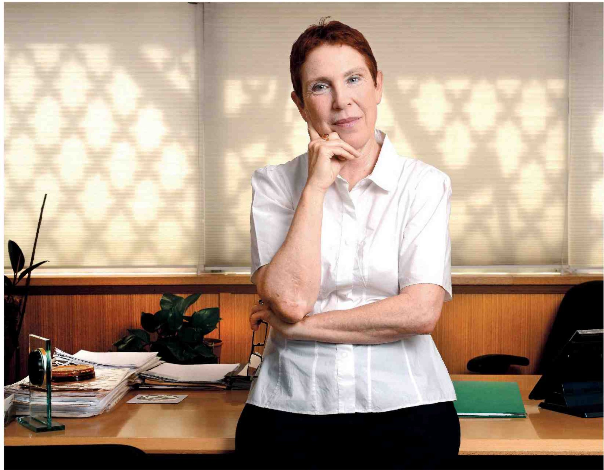
"כמי שישבה מול דכנר ב־60 או 70 ימי דיון, התרשמתי שהכול היה תוכנית גדולה שהוא הכין לעת צרה. וכשבאמת הוא נתקל בעת צרה, וירד מנכסיו, הוא השתמש בכל הנשק שאגר"

אחת מתוך עשרות, אולי מאות, של סוגיות שבהתחלה גולגלו לפתחו של השופט, עד שהוא הבין כי אין אפשרות להגיע להכרעה בסוגיות המקצועיות האלה. ● מה המחיר של ניהול תיק בל־כך גדול מבחינת הצדדים? "המחיר הוא, שגם הפרקליטות וגם הסנגורים נאלצו לעגל קצוות. ללא עיגול הקצוות אי אפשר היה להתגבר על התיק הזה, שלא ניתן היה לקרוא בו את כל החומר. ובסופו של דבר, גם לא היה מיקוד מספיק מדויק ומדוקדק ביחס לכל אחד מהנאשמים." ● מה הפרקליטות היתה