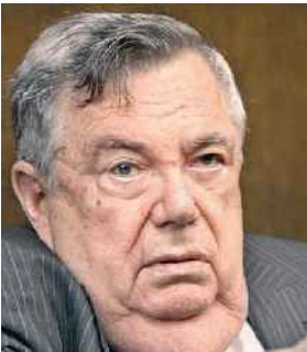
דכנר היח