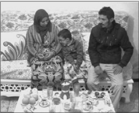
4 _ ربيع 2019 سيبقي في الذاكرة مع سكن جديد