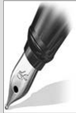
■ بقلم: عبد القادر بودرامة باحث في علوم الاتصال

عليها إدارة المجتمع. والتمثيل في الأنظمة الاستبدادية انتقائي، وفي الأنظمة الديمقراطية فوضوي، وكلا التمثيلين معيب عيبا يُفقدّه الشرعية ويُنتج إدارة سيئة. فما هو الحل إذن؟ تفعيل نظرية العصبية الخلدونية في إطار الشورى الشرعية، العصبية المحمودة لا المذمومة بطبيعة الحال؛ لأن العصبية فطرة وجعل رباني عصي عن الانفكاك بخلاف الفكرة السياسية التي تنظم الحزب، الذي هو معرض للضعف غالبا مستباح للمستبد إن شاء أخضعه وإن شاء بدّده. ثم تأتي البرامج الإصلاحية من بعد ذلك تبعا، وفي النتيجة تحلّ العصبية القبلية محل الحزب السياسي، وتحل الشورى محل الديمقراطية؛ فتتشكل بذلك مجالس في كل مستويات الحكم، كانت في تاريخنا الطويل تلتئم لتنظر في شؤون الرعية، فتتقاسم الحكم وتبعاته والولاء ومسؤولياته، وتنال الغنائم من بعد ذلك بعدل وإنصاف، في جو من العبودية لله تعالى والتجرد عن الأطماع الدنيوية؛ فكانت هذه المجالس راحة للناس من صداد المناكفات السياسية، وسدا منيعا ضد من يتأبط بالشعب شرا، وعصمة للناس من غلواء الفتن، ما ظهر منها وما بطن.