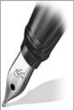
■ بقلم: عز الدين مصطفى جولي أستاذ جامعي

بقيت الإشارة إلى نقطة التمثيل الشعبي في المجالس المنتخبة. إذ تنوب بموجبه الأقلية عن الأكثرية لدى السلطة، فتسهل