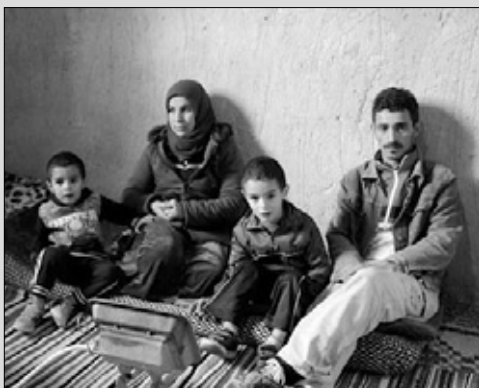
3 _ نظرات أفراد العائلة في انتظار القرم