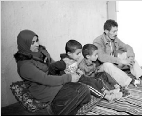
2 _ أطفال يحلمون بالدء في عز الشتاء البارد