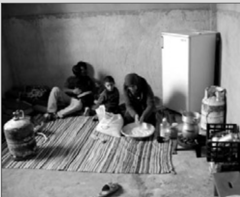
1 _ هنا كانت تعيش عائلة بوتبينة بين قارورات الغاز