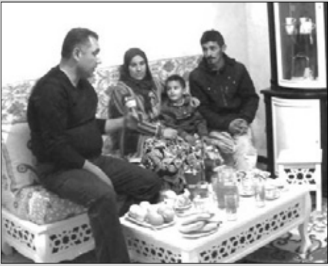
5 _ حصة وافعلوا الخير منحت عائلة بوتبينة السكن والسكنية