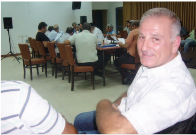
איריה אופטימית במועצת העיר בתום הצגת המצגת