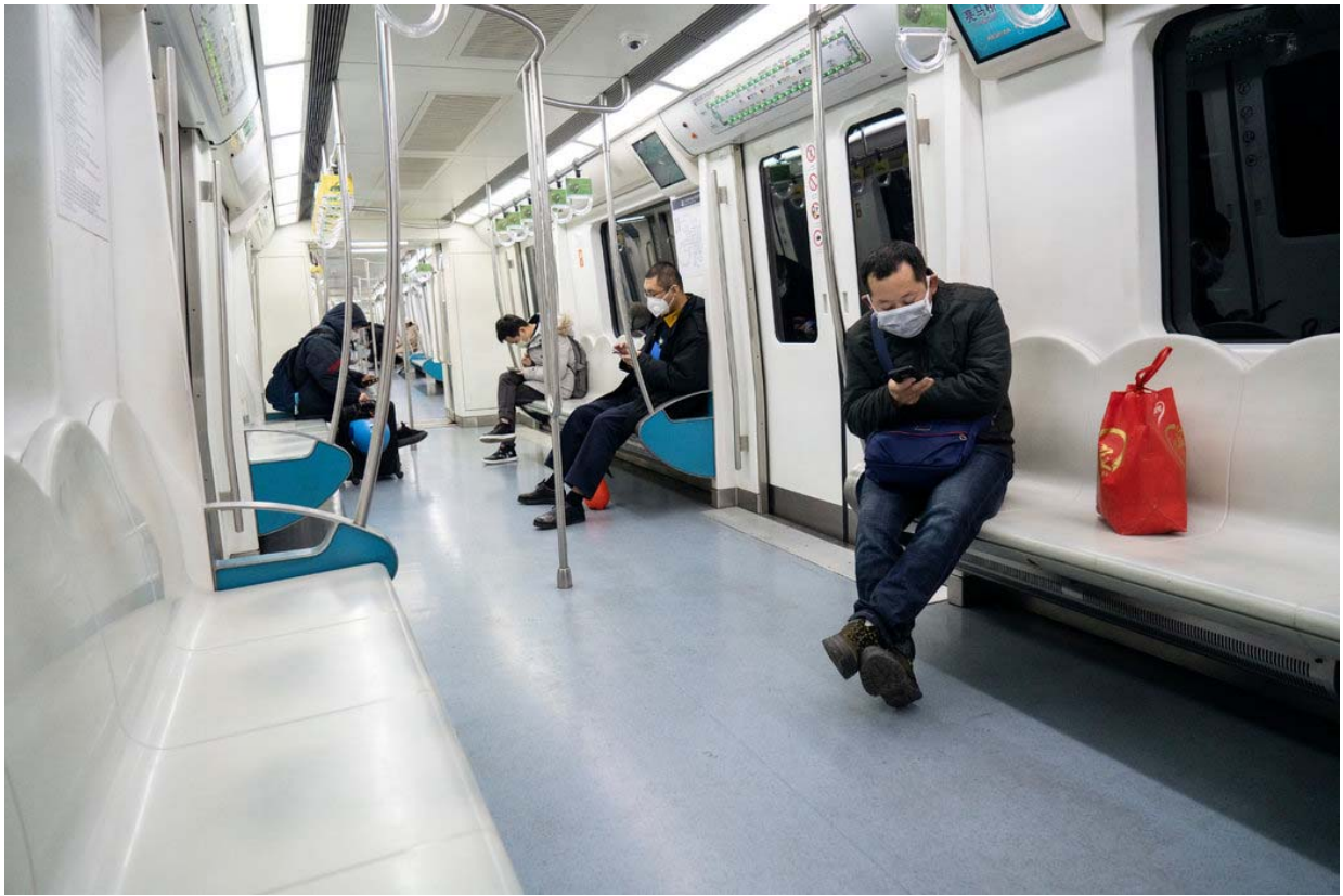
周一，地铁上空空荡荡。

这种只差名分的封锁发生在中国各地的城市，扰乱了人们的生活，描绘出一个人口骤降的国家里反乌托邦的远景。