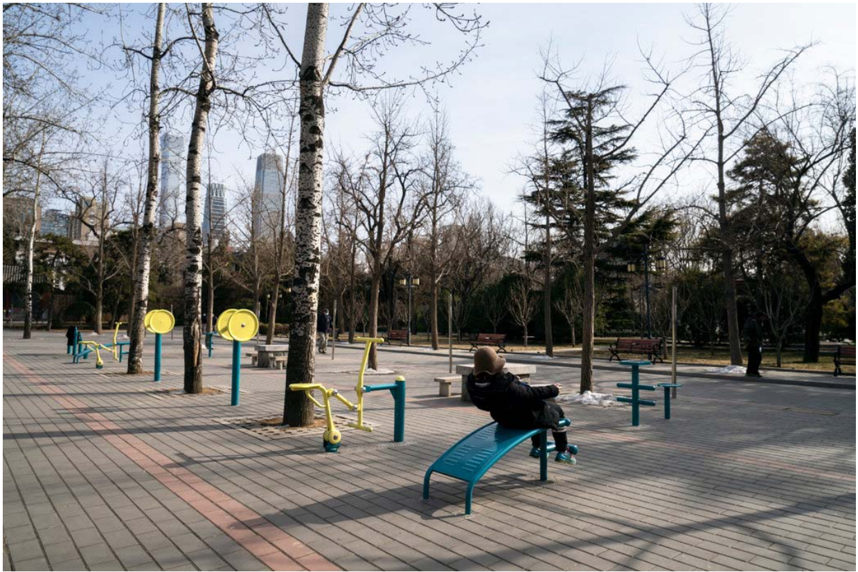
在人迹寥寥的日坛公园锻炼身体。

不久前的一天，公园里唯一能听到的声音来自喇叭，它重复着四处张贴的传单上的建议：避开拥挤的地方，不要随地吐痰，勤洗手。根据政府法令，任何进入公园的人都必须戴上口罩，并接受体温测量。