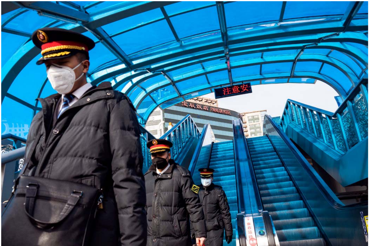
在去北京火车站的路上，列车员带着防护口罩。