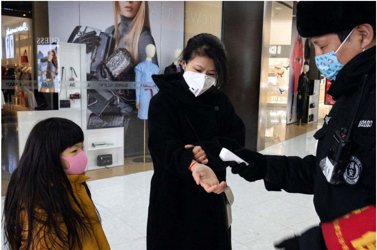
保安正在给一名进入商场的女士测量体温。

猜疑本身成了传染病。“待那儿别动，”朝阳公园里一个跟女儿打羽毛球的男子发出警告，两人都戴着口罩。“别离太近。”