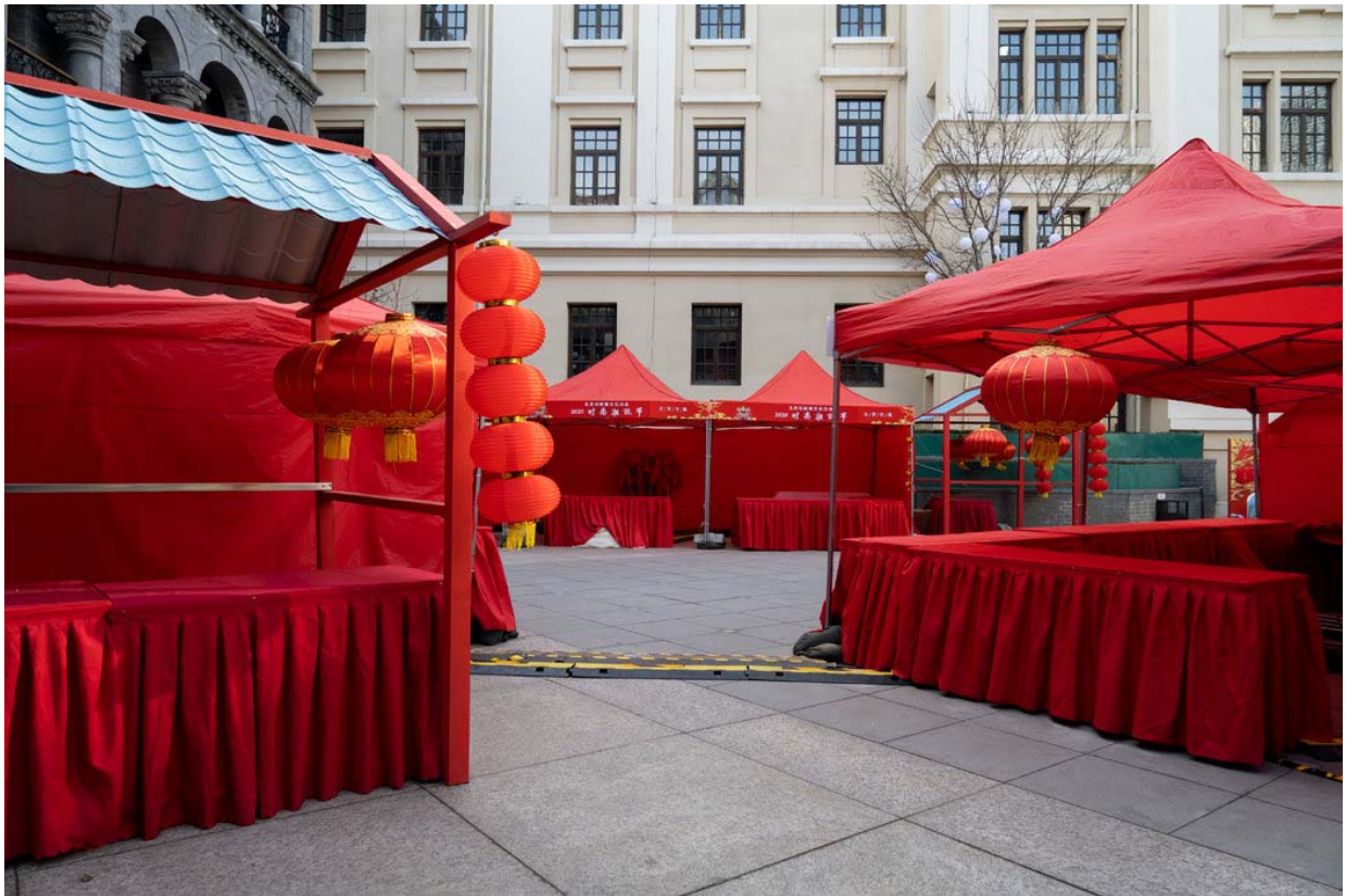
前门，空无一人的摊位。

该城的最新冠状病毒统计数字是212例确诊和1例死亡，但这些数字可能还会上升。一名城市官员周一 宣布 ，复兴医院有5名医务人员被感染。