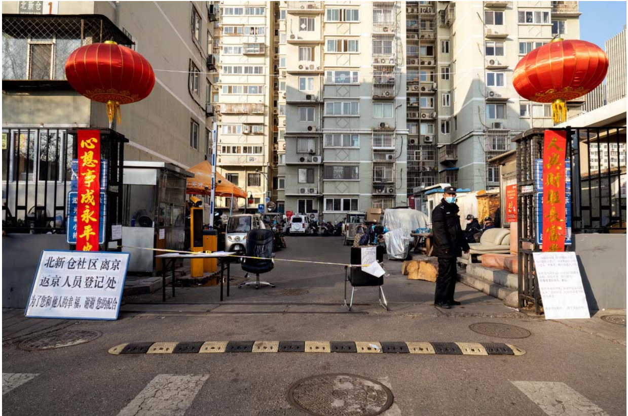
在东直门社区的一栋公寓楼外，保安检查进入小区人员的体温。

随着检查站的消息传开，北京政府副秘书长陈蓓在周六紧急宣布，当局不会容忍针对病毒的民间自发警戒行为。