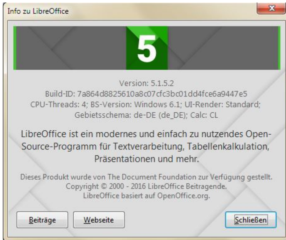
Abbildung 2: 2