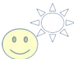
Илюстрация 6: inserted as raster image

Щеше ли да го спаси тази врата? Той чу тихи стъпки зад себе си. Това не предвещаваше нищо добро. Кой би го следвал толкова късно през нощта в този забутан квартал? При това точно в този момент, веднага след големия удар, докато се измъква с парите. Дали и друг мошеник бе стигнал до същата идея и сега го наблюдаваше, дебнейки възможност да заграби плодовете на труда му?