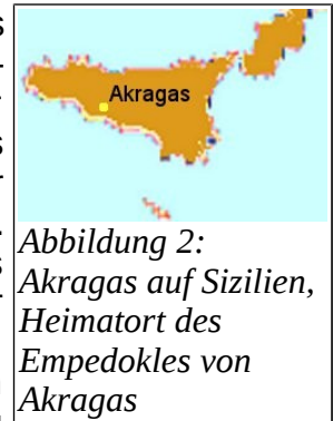
Abbildung 2: Akragas auf Sizilien, Heimatort des Empedokles von Akragas

Vermutlich lebte er nach seiner Verbannung auf dem Peloponnes, vielleicht aber auch in Thurioi . Empedokles starb um 432 (v.Chr.). Zu seinem Tod verbreiteten seine Spötter, er hätte Selbstmord begangen, indem er sich in den Krater des Ätnas stürzte. Und dies weil so seine Leiche unauffindbar bliebe und niemand die Behauptung seiner Göttlichkeit an Hand eines verwesenden Leichnams widerlegen könne. Die Anhänger des Empedokles gingen hingegen davon aus, dass Empedokles nicht den Tod eines Sterblichen starb, sondern, als ihm danach war, einfach in den Himmel aufgefahren sei.