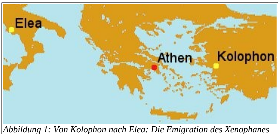
Abbildung 1: Von Kolophon nach Elea: Die Emigration des Xenophanes

Xenophanes trat zunächst als Rhapsode in Erscheinung, d.h. er trug zu musikalischer Begleitung