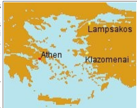
Abbildung 3: Klazomenai, Athen und Lampsakos: Die Lebensstationen des Anaxagoras.

Mit Anaxagoras erreicht die vorsokratische Philosophie nun endlich auch Athen. Der in Klazomenai geborene Anaxagoras war der erste Vorsokratiker, der über Jahre hinweg in Athen lehrte. Seinen Text zur Naturphilosophie konnte man dort für kleines Geld erwerben. Wahrscheinlich lernte damals auch Sokrates die Lehren des Anaxagoras kennen. 69