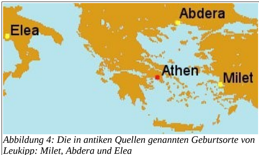
Abbildung 4: Die in antiken Quellen genannten Geburtsorte von Leukipp: Milet, Abdera und Elea

Zur Biografie des Begründers des antiken Atomismus liegen kaum zuverlässige Daten vor. Selbst Geburtsort wie (ungefähres) Geburtsjahr sind unklar. Als Geburtsort werden in antiken Quellen sowohl Milet, Elea als auch Abdera genannt. Einige Quellen sprechen davon, dass Leukipp ein Schüler des Eleaten Zenon war. Etwa um 450 (v. Chr.) hat Leukipp in Abdera eine Philosophenschule gegründet. Wenigstens dieser Punkt