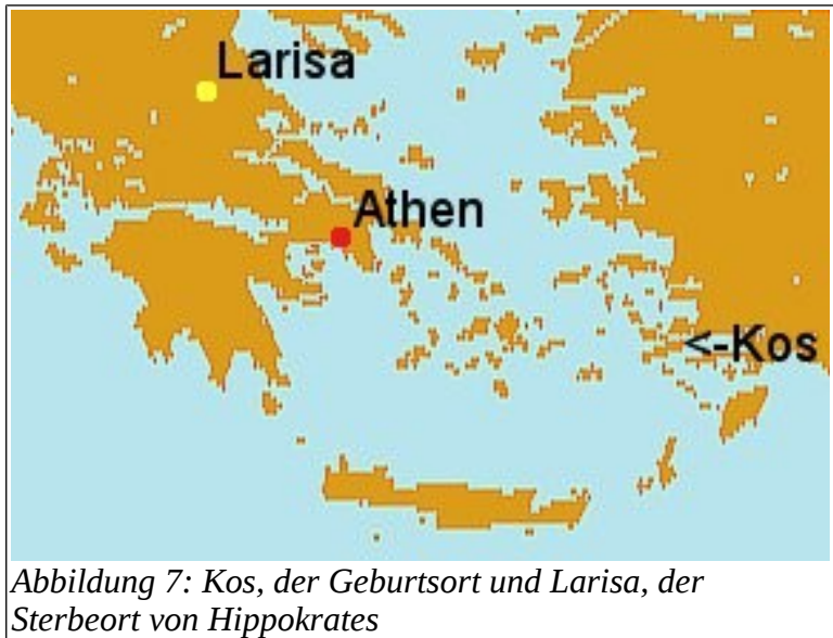
Abbildung 7: Kos, der Geburtsort und Larisa, der Sterbeort von Hippokrates

Eine solche persönliche Beziehung zwischen Hippokrates und Gorgias hätte aus der Sicht der Ideen- und Wissenschaftsgeschichte durchaus ihren besonderen Charme. Ob ihnen