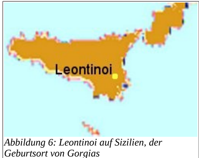
Abbildung 6: Leontinoi auf Sizilien, der Geburtsort von Gorgias

Für Gorgias, den Sohn Charmantides, nimmt man heute allgemein eine ähnliche Lebenszeit wie für Protagoras an, seine Geburt wäre also an den Beginn des 5. Jh.s zu setzen; die antike Tradition überliefert uns indessen widersprüchliche oder verworrene Angaben, einzig das lange Lebensalter, das über 100 Jahre hinausgehen soll, ist einhellig. 116