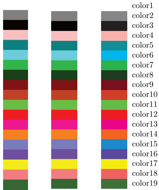
Figure 1: left - png image; center - table with RGB fill; right - table with CMYK fill