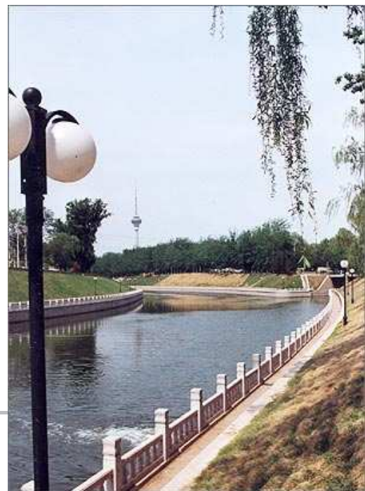
经过半年的修缮,昆玉河水景走廊已初露新姿。

山属于山林性绿地性质,土壤瘠薄,水肥条件较差,因此在环境改造中使用了大量的景天科、菊科植物,如蛇莓、连钱草、紫花地丁、二月兰等品种。与传统花卉相比,野生宿根花卉不仅拥有一种与生俱来的自然感,